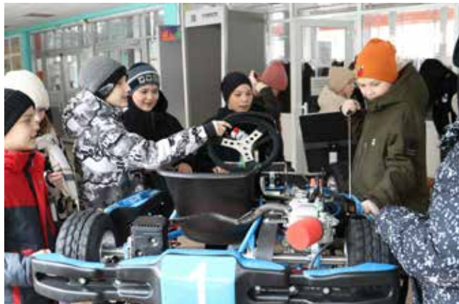
Руками трогать... можно и нужно! Где ещё узнаешь об устройстве карта, как не на Дне «КАМАЗа»?

Ученики младших и средних классов начали свой камазовский день с зарядкой, а затем отправились на спортивную эстафету. И болты они на скорость закручивали, и пазл собирали, и даже сотрудника завода одевали по правилам техники безопасности. И в кибербудущем ребята побывали: специалисты «Кванториума» подготовили интересные игры