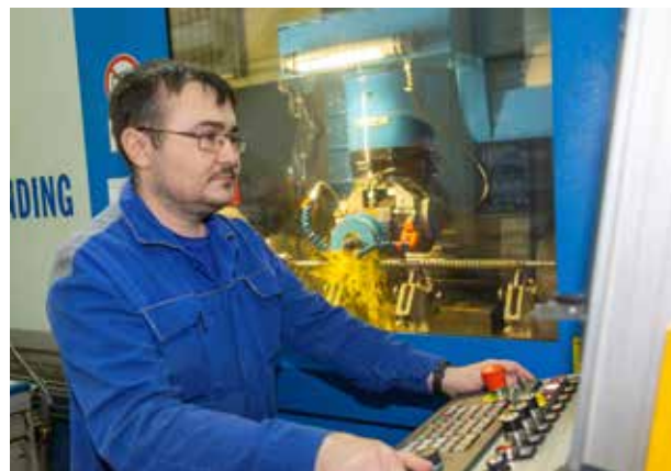
Работать на таком оборудовании интересно и престижно

Кстати, на заводе действует специальная программа, по которой новички в течение полугода получают солидную зарплату — так им дают время освоиться и набраться опыта. Хочешь попробовать?