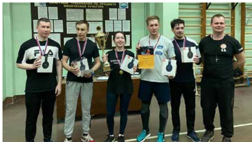
Команда НТЦ — чемпион по лазертагу-2023

Победители и призёры были награждены медалями и дипломами. Все финалисты получили призы от партнёров и организаторов турнира.