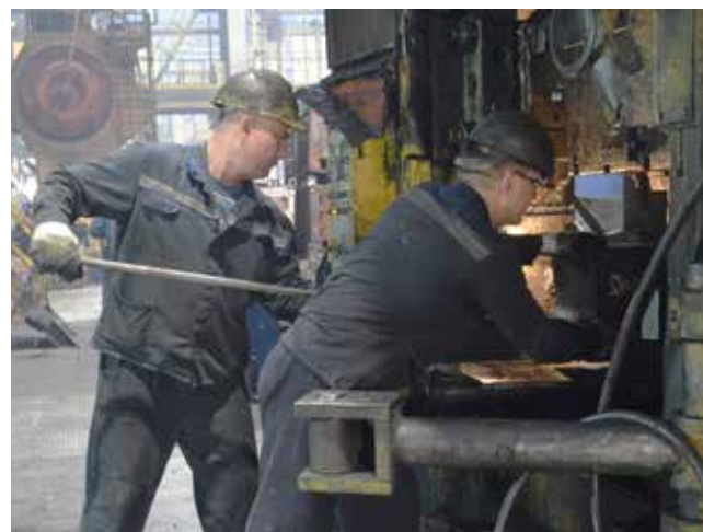
Участники конкурса — опытные наладчики с большим стажем работы на кузнечном заводе

— По чек-листу мы смотрели на время, затраченное на задания, навыки и каче-