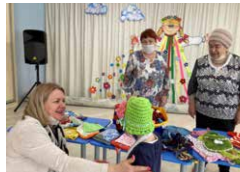
В подарок от бабушек — вязаная шляпка

Камазовские бабушки знают, сколько здесь воспитывается детей, их возраст. С любовью и заботой они отшили мальчикам ситцевые банданы, а девочкам — косынки. И каждому ребёнку досталась сумочка из ткани, она востребована всегда, ведь её удобно носить наперевес и складывать туда любимые мелочи, конфетки, носовой платочек. Также среди подарков вязанные изделия — панамки, платя, игрушки.