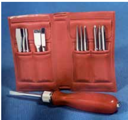
Такая «книжечка» с инструментом всегда выручит!

По словам заводчан, последние наборы «Любителя» были выпущены в начале 90-х. Но слава о нём жива и