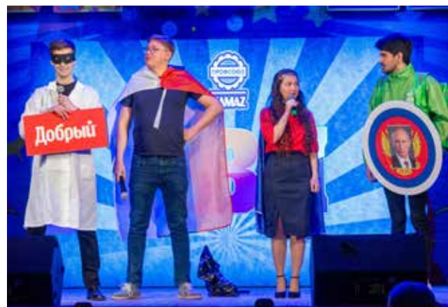
Бюджетные супергерои задержали доставщика роллов: — Что в сумке? — «Филадельфия», «Калифорния»... — Кто заказал? — Доктор Зло! Выходит Доктор Зло: — Да, это я! А ещё я ввёл на «КАМАЗе» систему контроля управления доступом и постоянно меняю раскладку на клавиатуре! — Хватит пакостить! Вот тебе удар импортозамещением — будешь Добрым! («Мы из центра»)