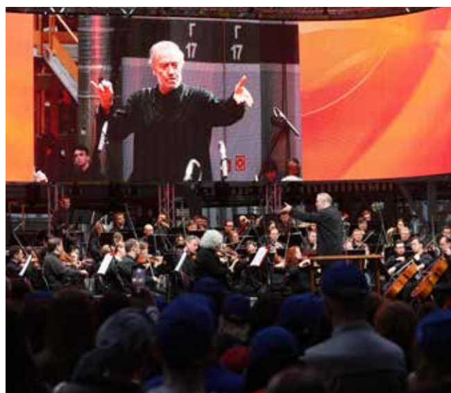
Маэстро Гергиев учит слышать настоящую музыку

Это был шестой визит коллектива. Расставаясь с ним, камазовцы сердечно благодарили оркестрантов за пережитые эмоции. До новых встреч, маэстро!