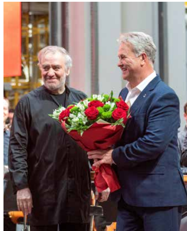
Радость встречи вдохновляет и артистов, и камазовцев

— Сегодня мы имели возможность слушать эту великолепную музыку в исполнении национальной гордости и достоинства России — симфонического оркестра Мариинского театра под вашим управлением. Огромное вам спасибо! Хочу пожелать вам дальнейших творческих успехов, а нашему коллек-