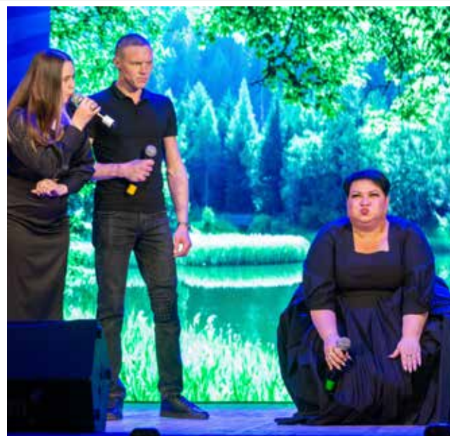
Миниатюра о надутой лягушке переносит зал в детство: — Ничего себе у тебя дышалка! — Так я тут при чём? Она из пруда такая вылезла. Я даже трубочкой её немного поддул... («Полный привод»)