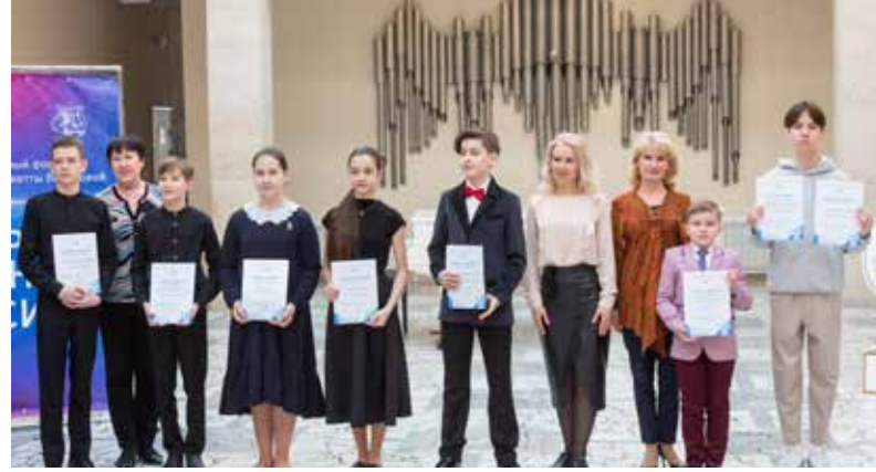
Семеро стипендиатов получили приглашение в XXXI Международную летнюю творческую школу «Новые имена» в Суздале