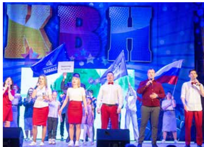
«ЧВК» посмеялись над клишированностью камазовских выступлений, где сплошные массовки в спецовках, флаги и речи директоров. Они спели песню «Не про «КАМАЗ», но оказалось, что без атрибутики и церемоний нет «КАМАЗа»