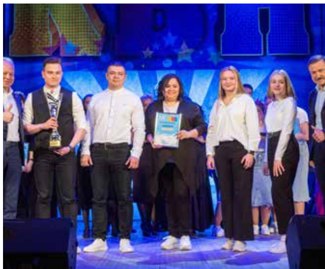
Для команды «Нелогичные» это первый Гран-при фестиваля КВН «КАМАЗа»