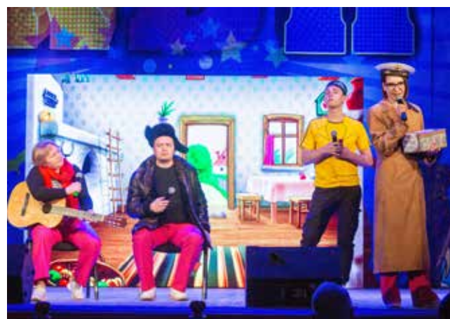
«Простоквашино» по-татарски. Дядя Фанур (дядя Фёдор): — Был на борбе куреш. Кинули меня... — А где баран? — Говорю же — кинули меня! («Нужные люди»)