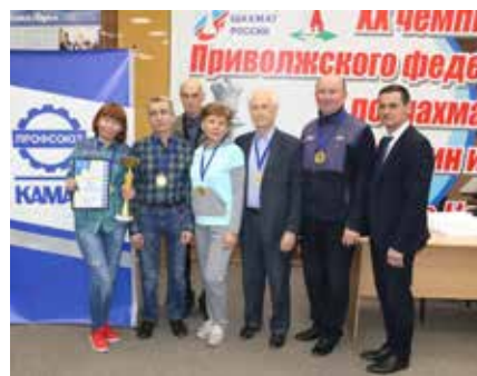
Дизелисты уже несколько лет входят в тройку сильнейших шахматистов «КАМАЗа»

Общекорпоративными усилиями шахматисты завода двигателей заработали 39 очков и заняли первое место. «Серебро» завоевали представители БЗГД — ДР (36 очков), сотрудники РИЗа замкнули тройку (34,5 очка). Отметим, что весь пьедестал заняли прошлогодние призёры, только порядок в 2022-м был