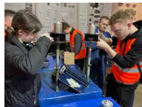
С заданием справятся и юноши, и девушки

Не обошли стороной и самый большой завод — автомобильный. Школьники прошли по ГСК, оценили сошедший с конвейера большегруз изнутри, побывав в