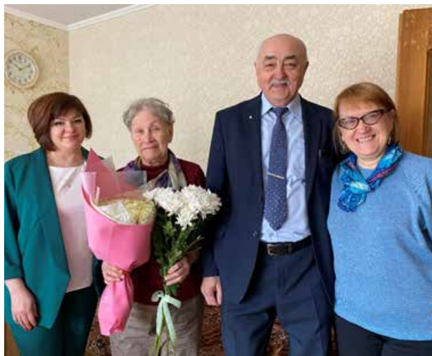
Видеть хорошо знакомых людей — лучший подарок

Поздравлять бывших работников с юбилейными датами — добрая традиция блока заместителя генерального директора по управлению персоналом, организационному развитию и корпоративному управлению.