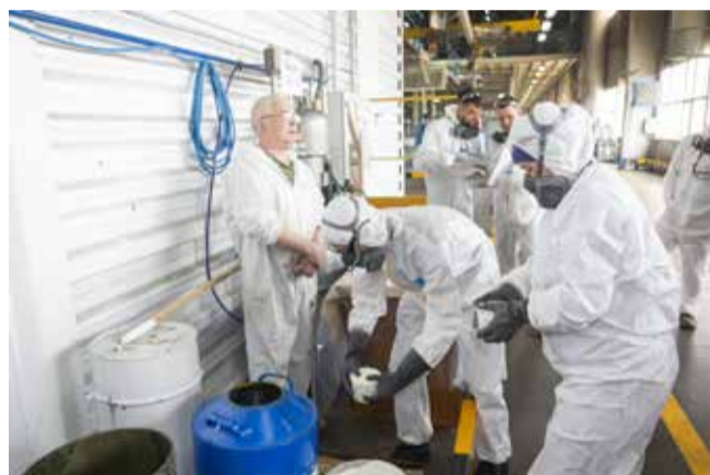
У маляров практика началась с приготовления эмали