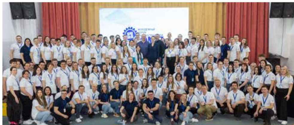
Форум помог молодым камазовцам получить новые знания, обрести знакомства и обменяться опытом