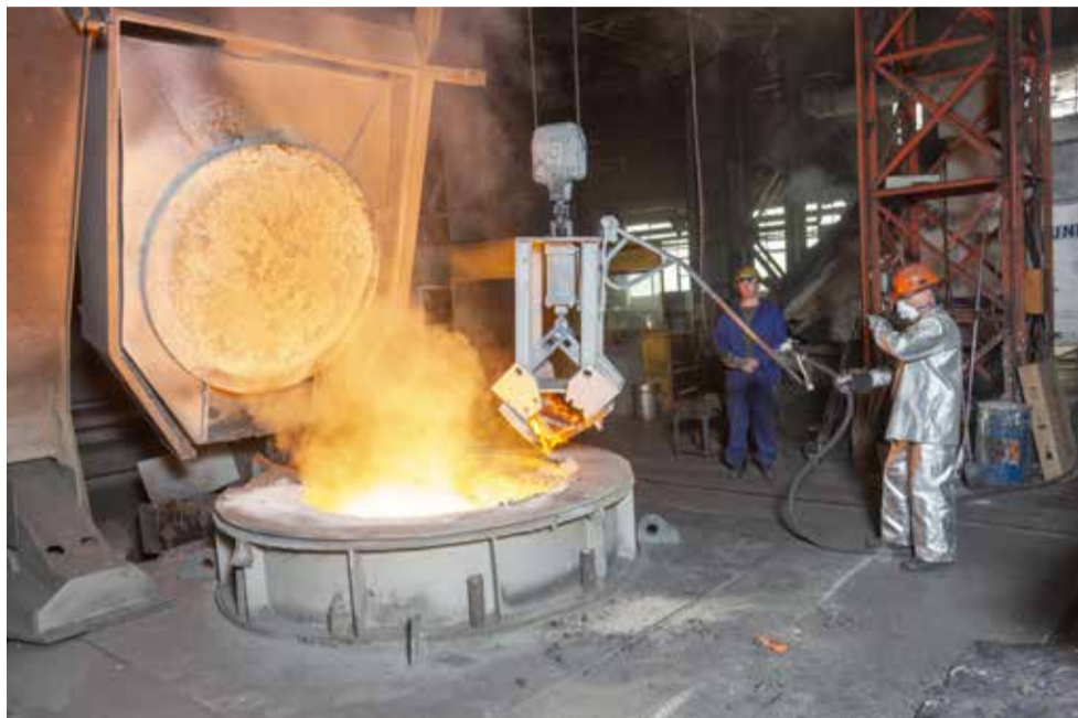
Охрана труда на литейном — вопрос первостепенный

Всемирный день охраны труда на литейном заводе отметили рабочим совещанием по одноименной тематике.