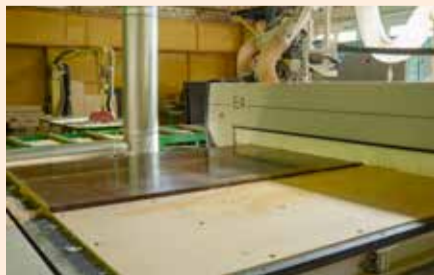
Обработка деталей на автобусы будет производиться с высокой скоростью

Установлен обрабатывающий центр на участке ремонта зданий и сооружений № 10. Оборудование закупили в рамках проекта «Развитие производственных мощностей по выпуску пассажирских автобусов в ПАО «НЕФАЗ» до 3000 единиц в год».