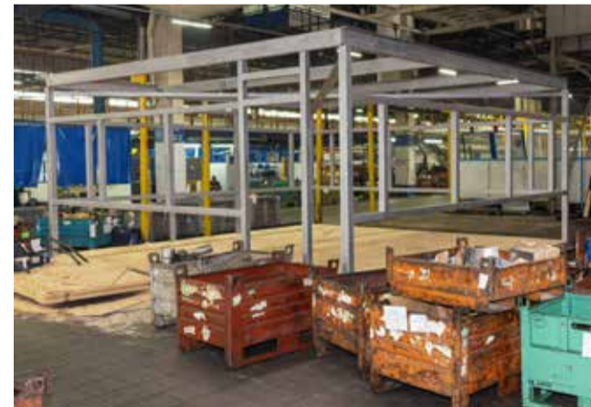
На участке начался монтаж бытового помещения для сварщиков