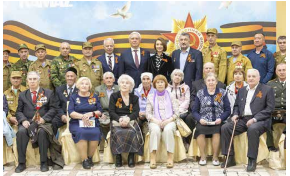
Памятное фото с ветеранами в канун 78-й годовщины Победы

— Мы передали частичку вечной памяти нашему городу. Сколько бы лет не