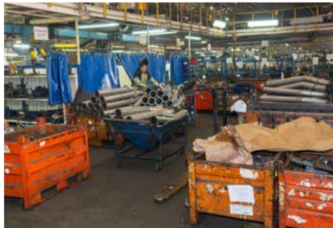
Здесь осваивается выпуск сотен новых образцов комплектующих изделий

Реализовать проект планируется до конца года. Предварительные итоги будут подведены накануне конференции мастеров в декабре. За созданием эталонного участка будут следить и «Вести КАМАЗа».