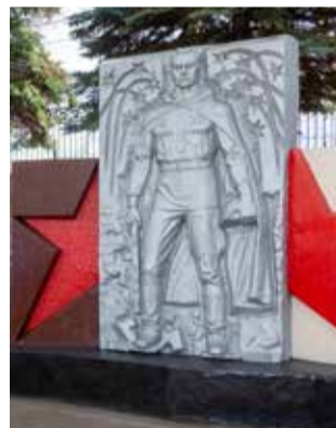
Цветы к памятнику солдату на ЛЗ возлагают 38 лет