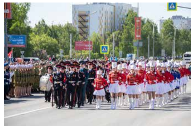
К парад в Челнах готовятся тщательно, и результат всегда впечатляет