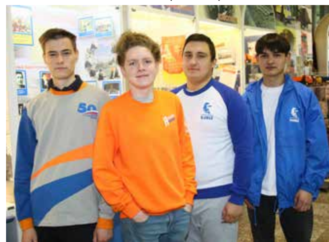
В такой одежде представлять «КАМАЗ» одно удовольствие