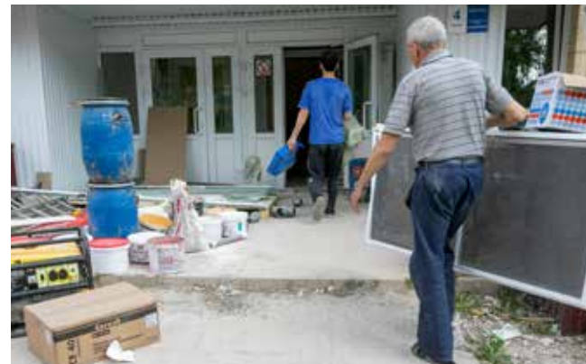
В 3-м корпусе «Солнечного» работы в разгаре, но к заезду ребят всё будет сделано

— Родительский день не вернётся, — напомнила она. — Это хорошая практика: во-первых, у детей вырабатывается самостоятельность, во-вторых, нет лишних продуктов питания, которые обычно привозят из дома: ягод, арбузов, чипсов. В «Саулыке» хорошо кормят, дети наедаются. Мы допускаем, что можно привозить воду в определённые дни и оставлять на КПП. Правила пребывания размещены на нашем сайте и в путёвках.