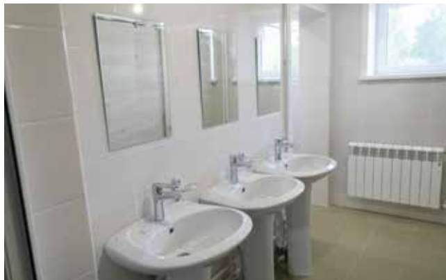
В 8-м корпусе «Крылатого» капитально отремонтировали санузлы

В 2023 году в лагерях ООК «Саулык» отдохнут 1614 детей камазовцев. Путёвки стоимостью 30618 рублей предоставляются им бесплатно. Первая смена начнётся 1 июня, вторая — 24 июня, третья — 17 июля и четвёртая — 9 августа.