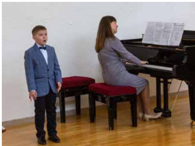
Девятилетний вокалист настроен победить!

Вокал у юного исполнителя занимает порядка двух-трёх часов ежедневно, в том числе и музицирование на фортепьяно. В целом репертуар учебного года составляет от 9 до 12 песен. Только