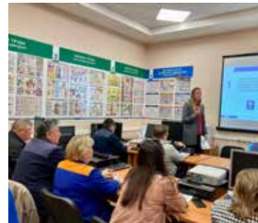
Новые знания помогут мастеру организовать работу на участке

В ЛЦ намерены до конца июня донести необходимые знания до всех действующих мастеров — их здесь 97. Также планируется подготовить отдельную программу для дальнейшего развития операторов логистических работ.