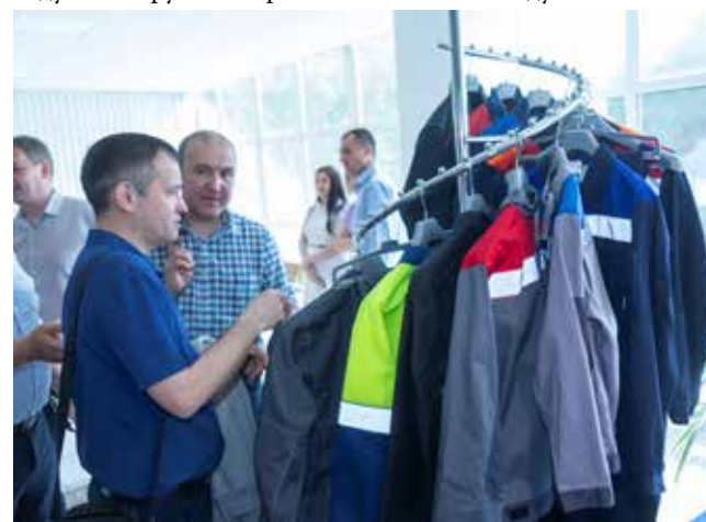
Качественная спецодежда? Дайте посмотреть!