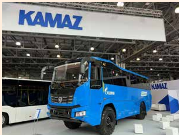
Камазовский вахтовый автобус отличается многофункциональностью

Конкурс «Лучший коммерческий автомобиль года в России» проводится в 22-й раз. Церемония награждения прошла 23 мая в Москве в рамках международной выставки коммерческого транспорта COMvex.