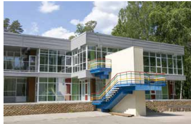
Такой обновлённой ребят встретит столовая лагеря «Звёздный»

— Желающих с каждым годом всё больше, причём приезжают со всей респу-