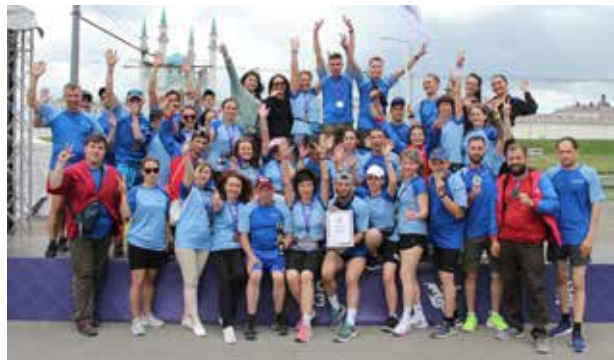
Команда «НЕФАЗа» показала очень достойный результат

А самое главное, что каждый участник этого корпоративного забега внёс вклад в общую победу команды. Нефазовцы заняли второе место, уступив бегунам «Газпрома».