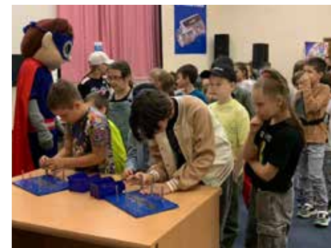
...а младшие готовы и гаечки крутить