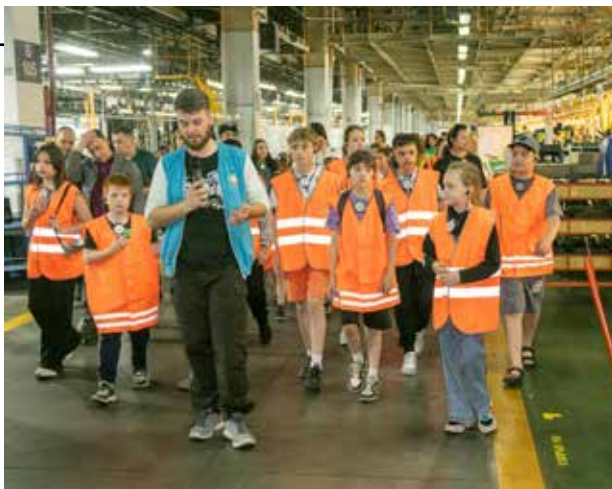
На конвейере много интересного, только успевай всё примечать!

На финише ребят ждали два красавца большегруза К5 и сладкие коржики. Наконец-то можно сделать фото за рулём, как заправский дальнбойщик, и, конечно, с родителями, создающими эту мощь и красоту.