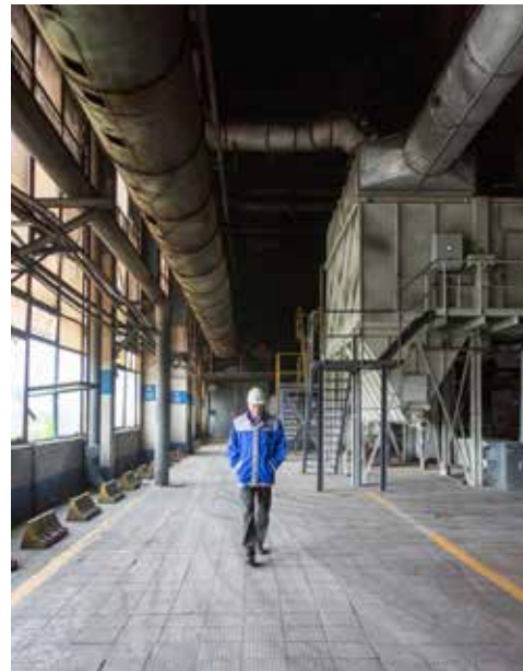
Одна из мощных газопылеулавливающих установок, система «Гарант-Фильтр», была смонтирована на ЛЗ в 2020 году. После её запуска значительно уменьшились выбросы, и воздух в производстве чугуна стал гораздо чище

— Важна и заинтересованность руководства литейного завода в снижении негативного воздействия на окружающую среду. Здесь удалось реализовать проек-