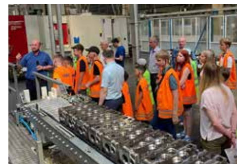
Старшим уже интересно производство...

После активного времяпрепровождения каждый ребёнок сумел побывать на рабочем месте родителя. Чуть позже дети вновь собрались все вместе на чаепитие, а затем отправились по домам. День защиты детей прошёл отлично — от скуки ребят на заводе защитили!