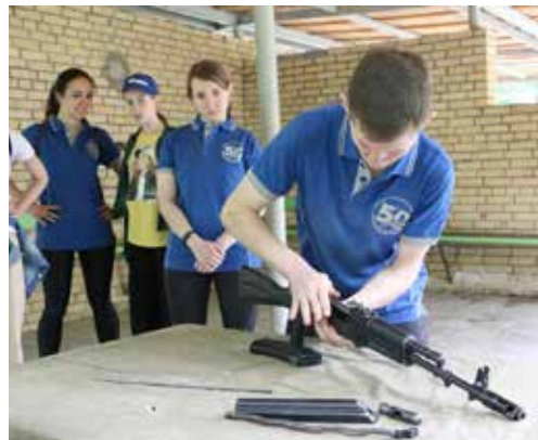
Разборка-сборка автомата — обязательное умение