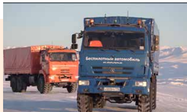
Восточная Мессояха — самое северное из нефтяных месторождений России, находящихся на суше. Диапазон температур в течение года здесь колеблется от +32 до -60 °С. Автомобили-роботы тут нужны особенно