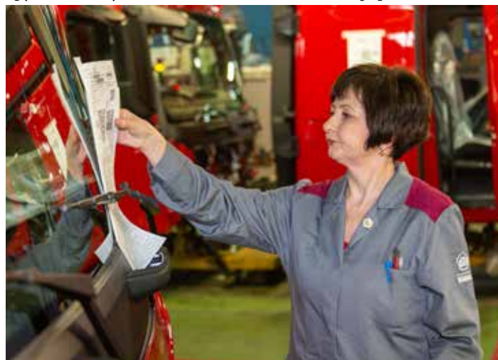
Контролёр несёт ответственность за качество сборки кабин