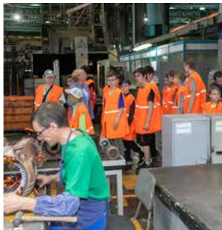
Из поля зрения ребятшек не ускользнуло ни одно движение рабочего