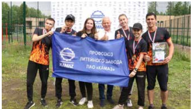
Литейщики до последнего момента не знали, что победят