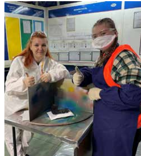
Покраска удалась на славу!

Самые внимательные и сообразительные выиграли призы на викторине. Своими впечатлениями делились за обедом, а потом удивлялись талантам заводчан, которые подготовили для них концертную программу.