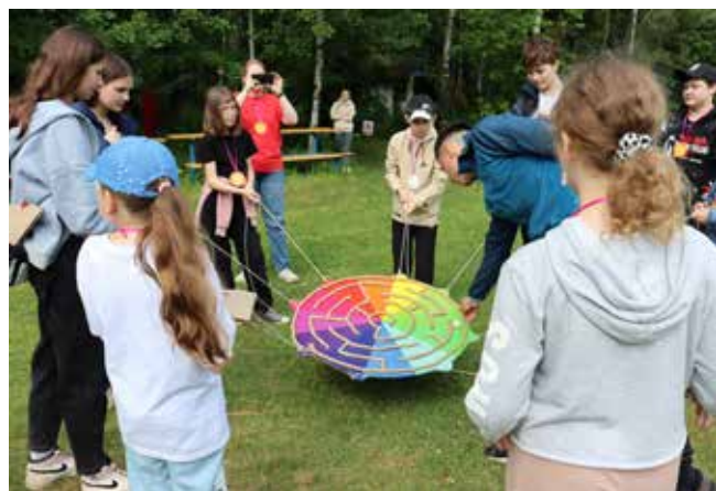
Лабиринт пройти всегда не просто, но поможет командный разум