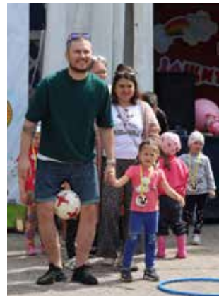
«Воробушки» ведут пап-мам за руку, а задача старших — не выронить мяч

В гости заглянул профессор химии. Любопытные эксперименты с сухим льдом