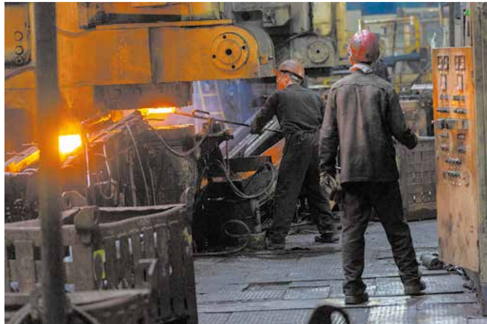
Использование СИЗ — одно из условий безопасности в условиях горячего производства

Не добившись результата, рабочие решили выкрутить регулировочные болты из упорных штанг и выдавить её в ручном режиме прессом. Один из них перевёл обрезной пресс в ручной режим наладки и начал нажимать кнопку на пульте управления, чтобы опустить, а затем поднять ползун. Двое других отошли на полтора метра и встали за его спиной. Неожиданно для кузнецов-штамповщиков правая передняя штанга отлетела от обрезного прессы и ударила одного из них по голове, мужчина упал на пол. На помощь поспешил начальник смены, вызвал фельдшера из здравпункта.