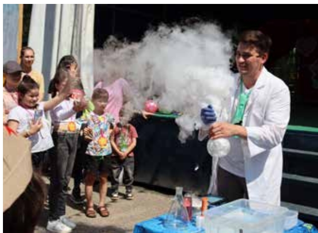
Сухой лёд + кипяток в колбе... Ой-ой, надымил, профессор!