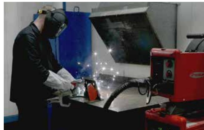
Слесарно-сварочный участок опытно-промышленного завода НТЦ получил статус эталонного