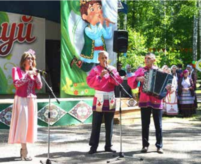
Этот инструментальный дуэт украсит любой праздник

— Мне по душе народные татарские песни, их напевность, лиричность. «Умырзая» («Подснежник»)