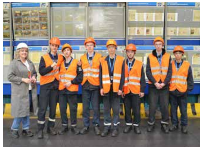
Эти ребята из Ульяновской области увезли с собой яркие впечатления о рабочих буднях «КАМАЗа»

Практикой ребята остались довольны. В свою очередь и специалисты ОРП отметили высокий уровень их ответственности, которой далеко не все практиканты могут похвастаться... На встрече за чашкой чая обсудили, насколько ре-