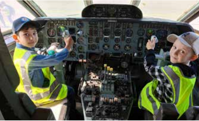
Лет через 20 на месте пилота будут они...

В завершение праздника юных гостей аэропорта угостили мороженым.