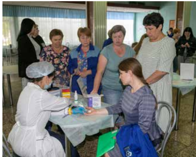
Заводчане охотно идут проверить здоровье

Участникам, успешно прошедшим итоговую аттестацию, вручили удостоверения о повышении квалификации. «КАМАЗ» приобрёл 16 новых тренеров. В ближайшее время все они приступят к обучению рабочего персонала своих подразделений.