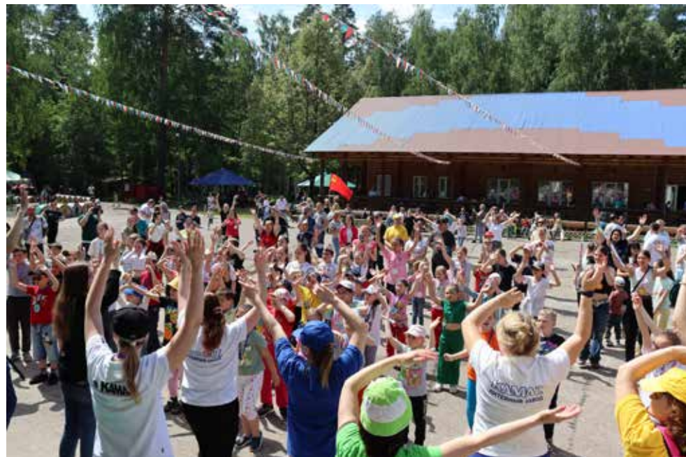
3 июня «Литейщик» гудел сотнями голосов и мелодий

Другая собственноручно изготовленная поделка — браслет из бусинок. Всё очень просто: продеваешь нитку в разноцветные горошинки, а их порядок уже определяешь сам. А вот и любимый всеми перекус — соки и печенье. Небольшая пауза — и на спортплощадку, вернее, на футбольное поле, где развернулись настоящие состязания.