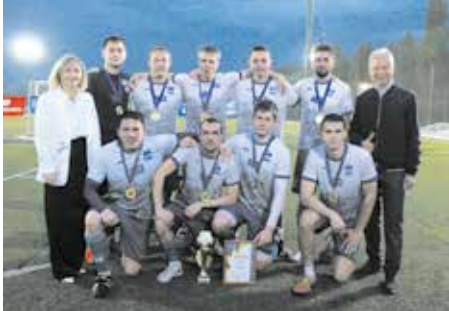
Футболисты АвЗ защитили прошлогодний титул победителей