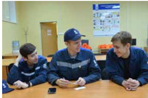
На кузнечном к учащимся отнеслись с теплотой, как к будущим коллегам

знакомились с российскими предприятиями. Среди участников были ребята из Барышского колледжа. Тогда они и решили поближе узнать кузнечный завод, «КАМАЗ» и приехали сюда в мае 2023-го на производственную практику.