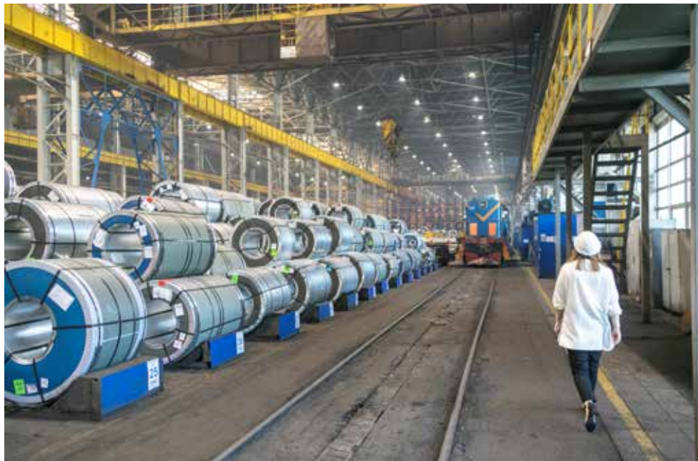
Этот металл со склада ЦВЛ теперь идёт в производство без лишних проволочек

В ЦВЛ намерены и дальше выстраивать процессы так, чтобы они шли гладко, а руководители и специалисты больше внимания уделяли не пояснениям нюансов поставок, а обсуждению их совершенствования и развития.