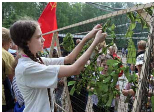
Важно крепко привязать ленту на будущую маскировочную сетку

Возвращались в город все уставшие, но в хорошем настроении, что до Сабантуя хватит.