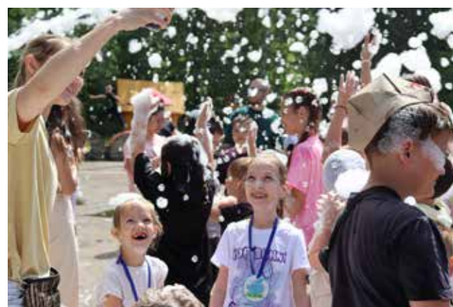
Пенная дискотека — это море радости

«Бег», «футбол», «вода» — детишки играют в ассоциации со словом «спорт» — это такая лёгкая разминка перед соревнованиями. А затем — «городки». Взрослые подбадривают промахнувшихся спортсменов: «Ты правильно бросила, только ниже целись», «Бросай слабее». Самые меткие участники