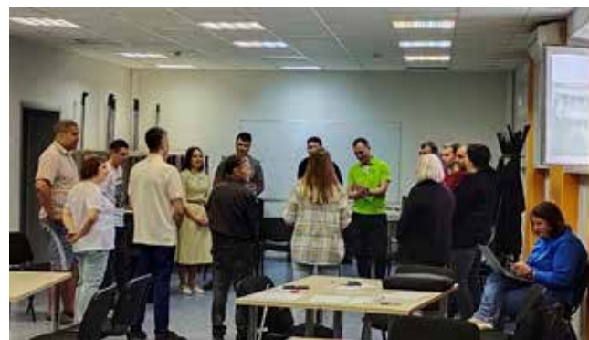
16 новых тренеров будут доступно рассказывать работникам о важности качества на производстве

Заводчане охотно идут проверить здоровье при поддержке профкома, администрации «КАМАЗа» и клиники-санатория «Набережные Челны».