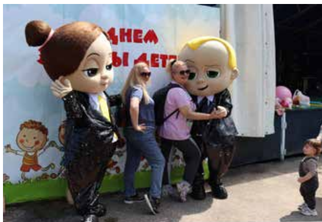
Взрослые не скушают — делают фото с боссами-молокососами