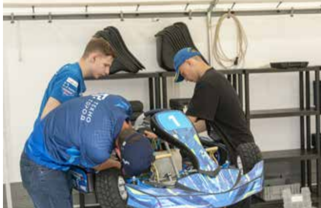
Любой, кто занимается в секции картинга, научится разбираться в устройстве техники

И поле для «автосражений» тоже, разумеется, предоставят. В год на площадках «Техногорода» проводится не менее десяти спортивных мероприятий всероссийского и республиканского уровня по картингу и автокроссу, городских любительских турниров по картингу и не менее восьми детских развлекательно-образовательных мероприятий.