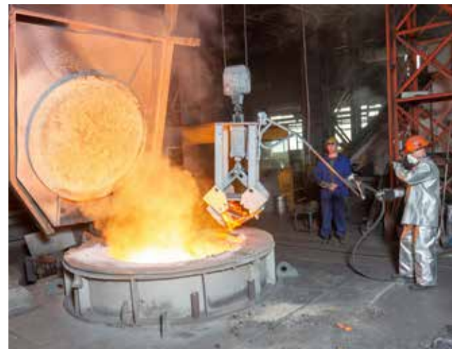
Многие поставщики уже не первый год плодотворно работают с литейным заводом и не понаслышке знают местное производство