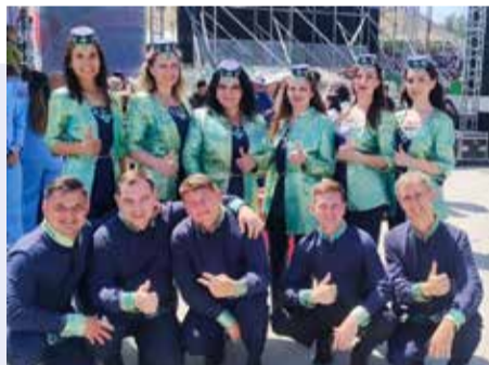
Прессоворамщики освежили традиционную песню рэпом

— Благодаря конкурсу я поняла, что должна гордиться традициями своего народа, сохранять и передавать их, ведь я — достойная его представительница, — признаётся «Сабантуй гузеле-2023».