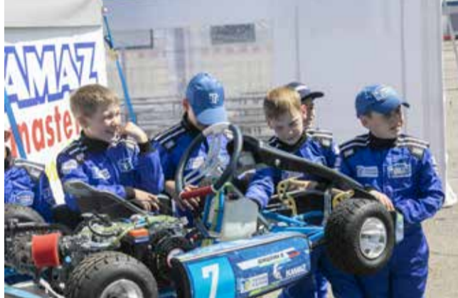
К каждому новому карту стоит очередь