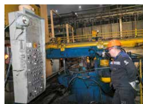
На этом оборудовании кузнецы работают уже 46 лет

В 2024 году инвестиционный проект «Модернизация кузнечного завода. Этап 2» должен вступить в активную стадию. На этот период в КПК-3 намечены строительно-монтажные работы, будет подведена инфраструктура. Затем последует закупка, подключение к действующей технологической цепочке и введение в эксплуатацию новой автоматизированной ковочной линии на базе прессы усилием до 14000 тс. По плану это должно произойти в 2026 году.