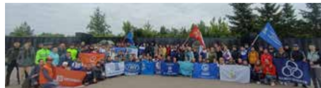
Многие из собравшихся уже не первый год участвуют в велопробеге

— В такие моменты я испытываю смешанные чувства: с одной стороны, безмерную благодарность и уважение к участникам войны. С другой, горечь от невосполнимых потерь в десятки миллионов человеческих жизней. Для меня велопробег — своего рода дань памяти жертвам Великой Отечественной.