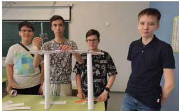
Эти школьники даже каникулы посвящают инженерным разработкам

Юные инженеры также участвуют во Всероссийском чемпионате движения «Профессионалы». А смена даёт им хорошую возможность прокачать необходимые для победы навыки, открыть и проработать свой проект. В конце смены каждый участник презентует свои наработки жюри, в составе которого будут и представители «КАМАЗа».