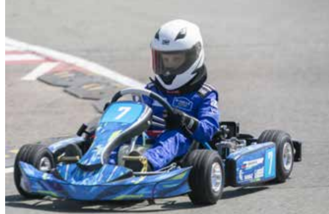
На деле «Микро 4Т КАМАЗ-мастер Юниор» показывает себя отлично