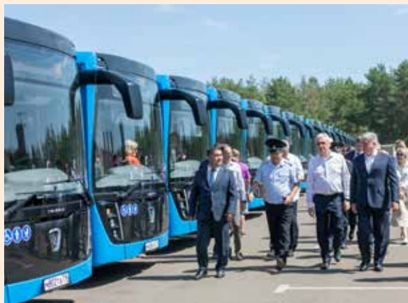
Уже в ближайшее время НЕФАЗы выйдут на улицы Челнов

Контракт на поставку партии автобусов был заключён между «КАМАЗом» и городом в апреле текущего года. Сумма контракта составила порядка 300 млн рублей.