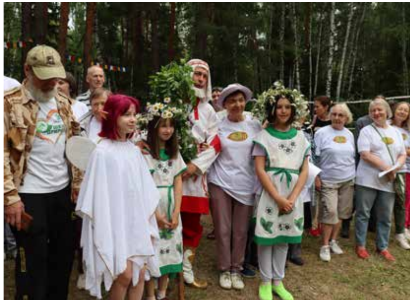
В царстве Берендея большой праздник

Гости праздника соревновались и в метании дротиков. «Целься выше «яблочка»,