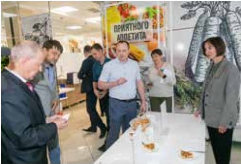
В дегустации важно прочувствовать вкус каждого блюда

Призёрам, занявшим третье место, были вручены сер-