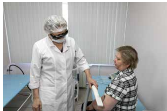
У клиники-санатория «Набережные Челны» богатый опыт реабилитации и широкие возможности

Также разработана процедура приобретения и выдачи путёвок на санаторное лечение, в детские лагеря для членов семьи работ-