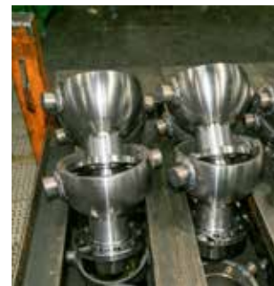
Новый проект изменит качество изготовления шаровой опоры

токи изготовления полуосей как для большегрузов К5, так и для К3.