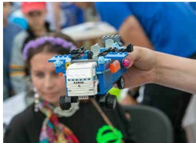
Полёт фантазии конструкторов не ограничивался стандартной компоновкой — можно и крылья установить на авто

с «КАМАЗом», который ему нравится. Я покажу ему буклеты, может быть, он что-то выберет».