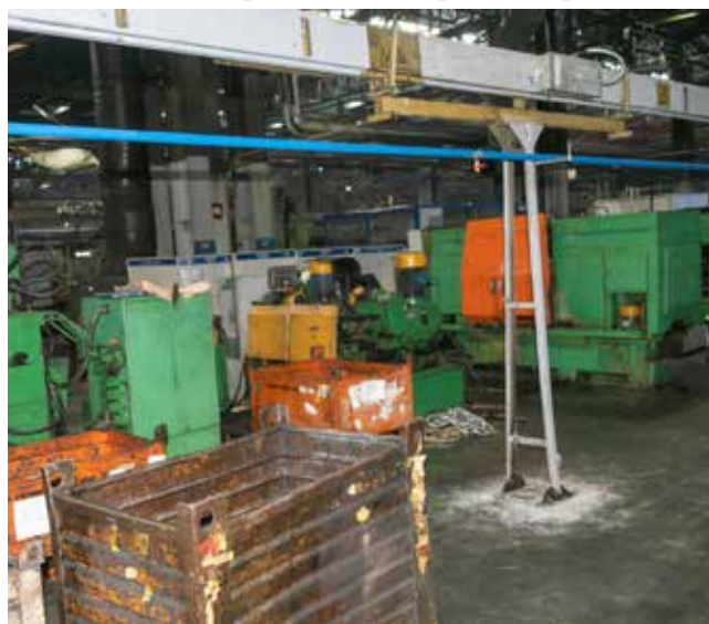
Этот участок по выпуску комплектующих уже перенесли из цеха картеров на новое место

Автоматическую линию поворотного кулака заменят шесть обрабатывающих центров. Выстроены и по-