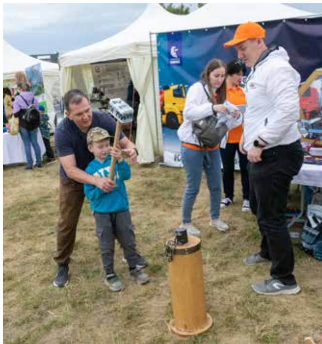
Чеканка монет требует сильного и точного удара