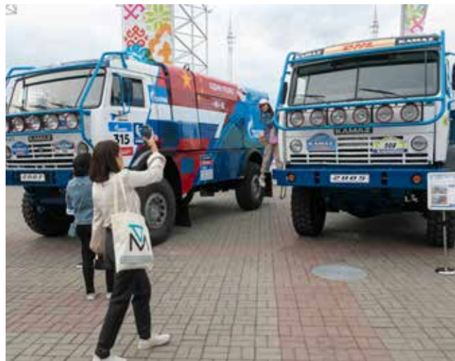
Гости праздника не упустили возможность сделать фото с легендарными гоночными болидами

Расходилась молодёжь уже поздно вечером после концертной программы и салюта с замечательным настроением и камазовскими призами.