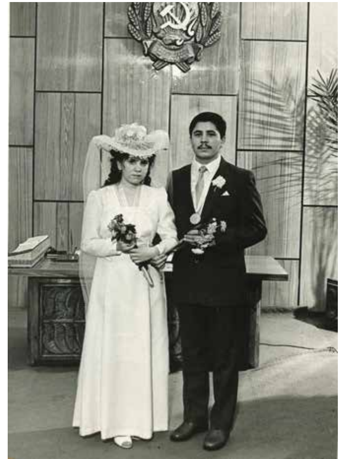
22 февраля 1985 года. С этого дня Загитовы пойдут по жизни вместе

прививали любовь к труду. Всему научил, что сам умею. Они помогали мне дом поднимать, — с гордостью говорит отец семейства.