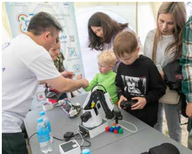
Робот-манипулятор поможет построить из кубиков и башню, и пирамиду