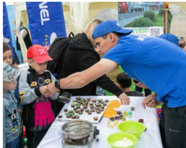
Литьё свечей настолько увлекало детей, что они не боялись обжечься горячим парафином