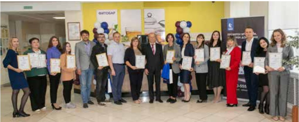
Вот они, авторы лучших рецептов конкурса