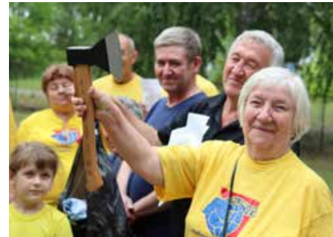
Подарок от клуба туристов «Гей» — необходимый в походах топор

Под конец дня туристы принялись исполнять бардовские песни под гитару. По домам именинники и гости разъехались очень поздно, а кто-то по старой памяти остался с ночёвкой.