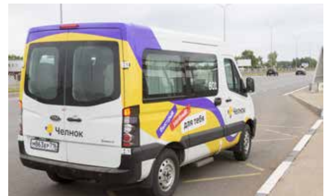
«Челнок» как нельзя лучше подходит для перевозки небольших групп

Так кузнечный завод стал первым среди камазовских подразделений, кто воспользовался новинкой от сервиса перевозок «Челнок». И теперь положительный опыт кузнецов может быть перенят и другими коллективами.