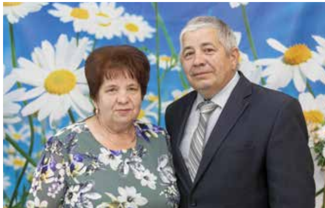
Супруги 38 лет живут в любви и согласии

— Из роддома меня забирал его двоюродный брат. Жили мы тогда у свекрови, она мне очень помогала, — с