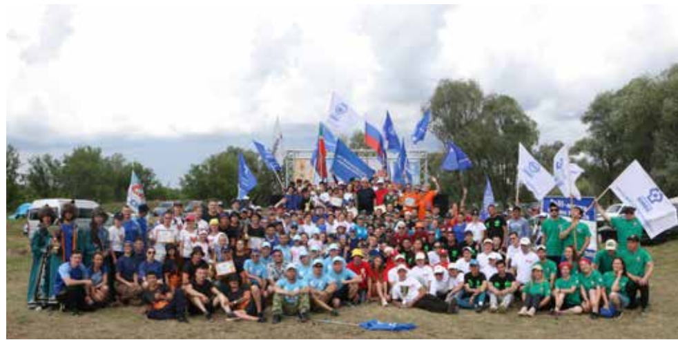
Число участников фестиваля в 2023 году побило все рекорды

— Турслёт оставил крайне положительные эмоции. Такие события обязательно нужно посещать, они стимулируют человека развиваться, идти вперёд. Наша команда тренировалась два раза в неделю, выезжала на базу. Отдельное внимание уделялось физподготовке, — поделился впечатлениями представитель НТЦ