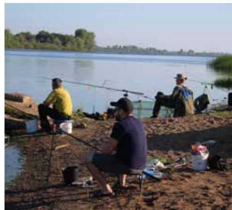
20 рыбаков вышли на состязание

Всем рыбакам вручили благодарности за участие и прикормку для рыбы, а победители получили ещё и сертификаты в специализированный магазин.