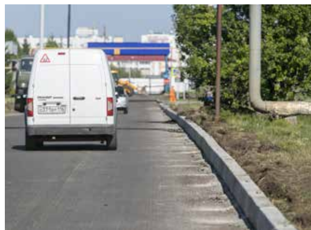
В этом году дороги АвЗ будут отремонтированы капитально. Уже срезан старый асфальт и частично заменены бордюры

Что касается капитального ремонта дорог, то в 2023 году он запланирован на территории автомобильного завода. Работы выполняются подрядной организацией ООО «РБР16» и ДСТиСАД. Уже проведён демонтаж старого бортового камня и срезка асфальтобетонного покрытия. Сейчас подрядчик устанавливает наливные бордюры, их протяжённость составит 1400 погонных метров. Затем работники ДСТиСАД произведут укладку асфальтобетонного покрытия, его площадь составит 9500 тыс. кв. м.