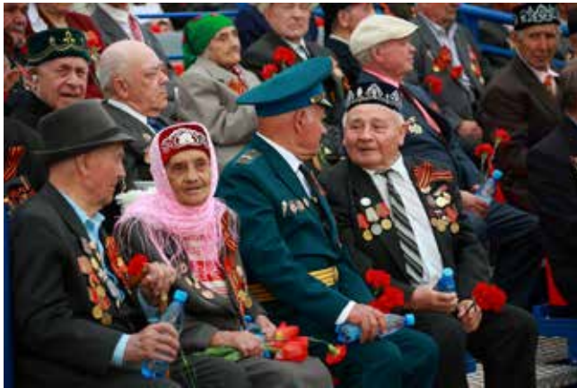
Ветераны Великой Отечественной — всегда в центре внимания