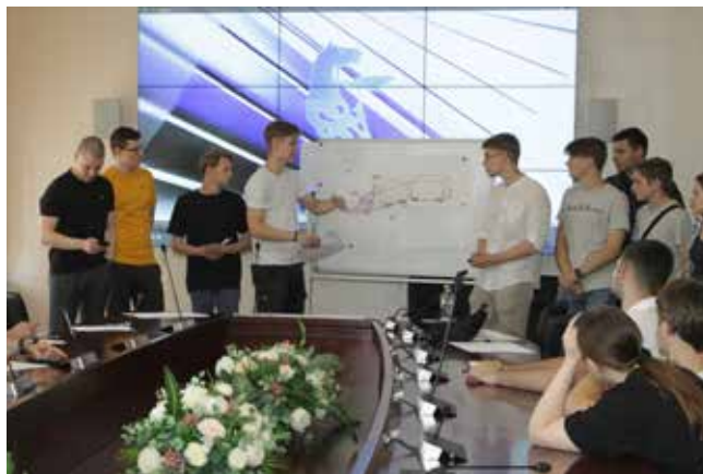
У молодёжи своё видение автомобиля будущего