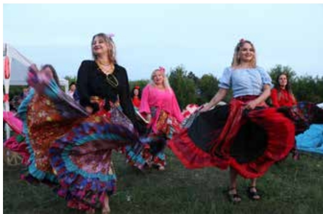
Цыганские танцы очаровали не только женихов, но и жюри