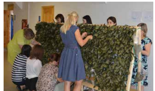
Сети изготавливают все желающие во время перерывов

Пока планируется изготовить 10 комплектов сетей, которые будут централизованно переданы для отправки в зону СВО. При необходимости количество может быть увеличено, для этого возможно обустройство дополнительных мест их изготовления.