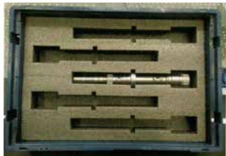
Теперь эту проблему решают поролоновые вкладки в тару

нической документации. Она предложила в атрибуте «ГОСТ, ТУ» прописать стандарты и технические описания этих материалов в соответствии с фактической поставкой. Годовой экономический эффект составляет 812 тыс. рублей.