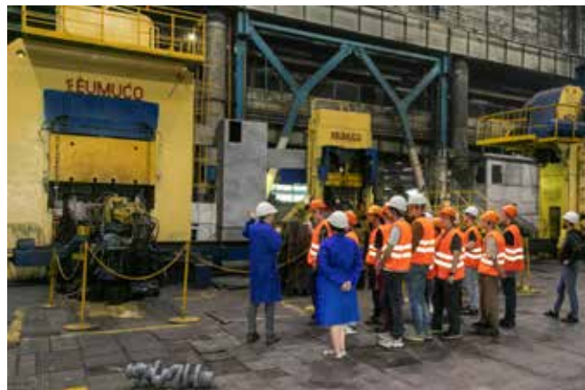
Сегодня ты студент, а завтра можешь здесь работать