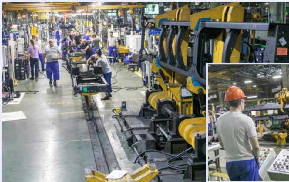
С укладки рамы на конвейер начинается сборка большегруза

Демонтаж старого оборудования и установку модернизированного укладчика рам вели работники цеха ремонта и обслуживания напольной техники и грузоподъёмных механизмов АвЗ вместе с коллегами с РИЗа, где и было изготовлено оборудование. Все возникающие вопросы решались совместно со специалистами технологического центра руководителями ремонтной службы. Испытания оборудования длились четыре дня, в том числе в режиме имитации хода сборочного конвейера и работы опускной секции ПТК.