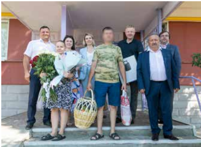
Поздравить Медного с рождением второго сына приехали руководители высокого ранга

Безусловно, эта встреча не единственная и не последняя. Предприятие с момента мобилизации главы семейства поддерживает контакт с его близкими и готово прийти на помощь по любому вопросу.