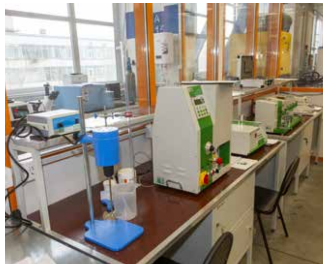
Овладение 23 профессиями — таков сегодняшний темп УТК