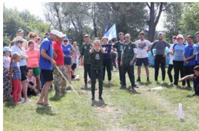
Прыжок в длину известен со времён античных олимпийских игр