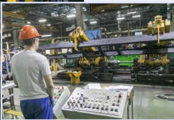
Модernизированный рамоукладчик держит железный каркас бережно и крепко

С 7 августа укладчик рам эксплуатируется в темпе работы ГСК-2, но пока в режиме пусконаладки, под пристальным контролем технологов и ремонтников.