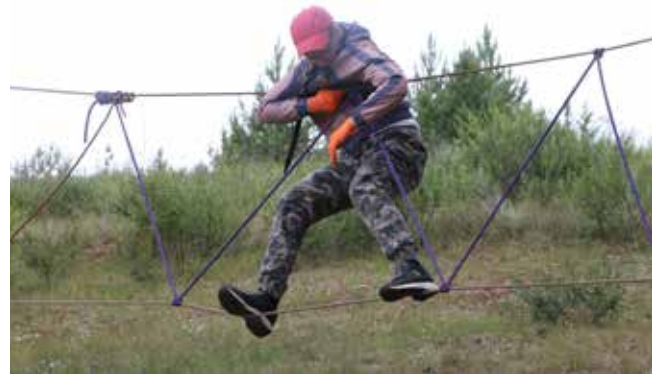
Держи равновесие на канатах!

А ещё камазовцам запомнятся весёлые дискотеки, зажигательный флешмоб, построение в цифру «55» — именно столько отметил в следующем году челнинский автогигант.