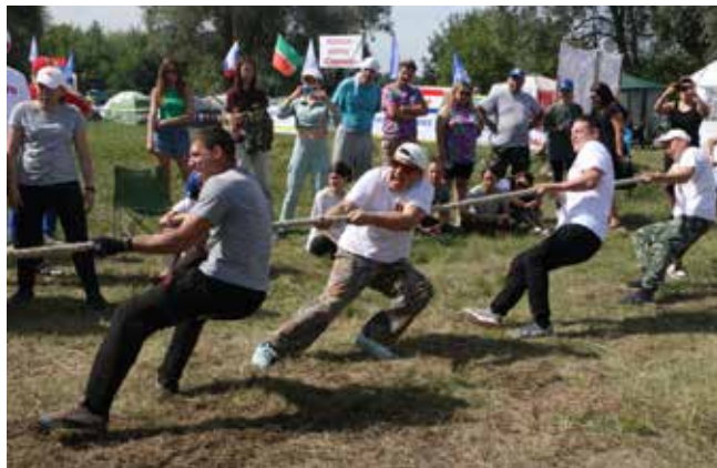
Рывок — и канатом перетягиваешь соперника на свою сторону