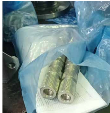
Такая транспортировка деталей АКП-2 грозила дефектами — сколами, царапинами, трещинами