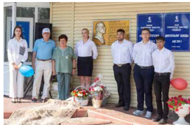
Память первого директора ЗД чтут и старшее, и молодое поколение дизелистов