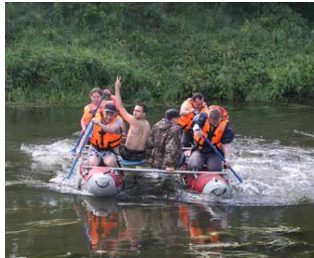
Лишь командной работой можно преодолеть сопротивление реки