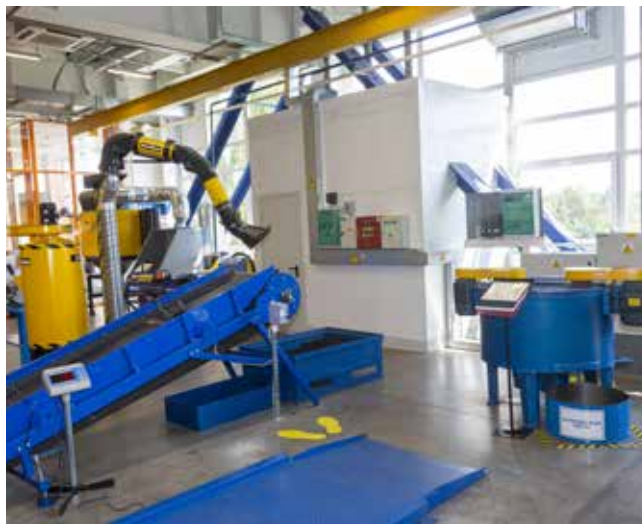
В оборудованном по последнему слову техники комплексе ежемесячно обучается 50 человек

лаборант, заточник и т.д. Кроме того, руководство чугунного корпуса намерено использовать комплекс как площадку для повышения квалификации действующего персонала. Есть свои идеи по взаимодействию с учебным пространством и у службы качества. В общем, работы хватит не только на следующий год.