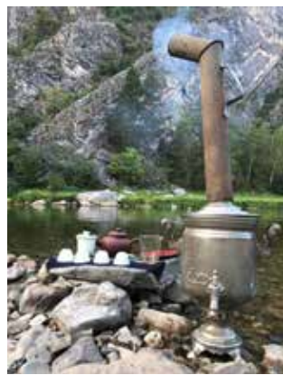
Китайский чай на берегу Белой — это и изысканный вкус, и радость созерцания