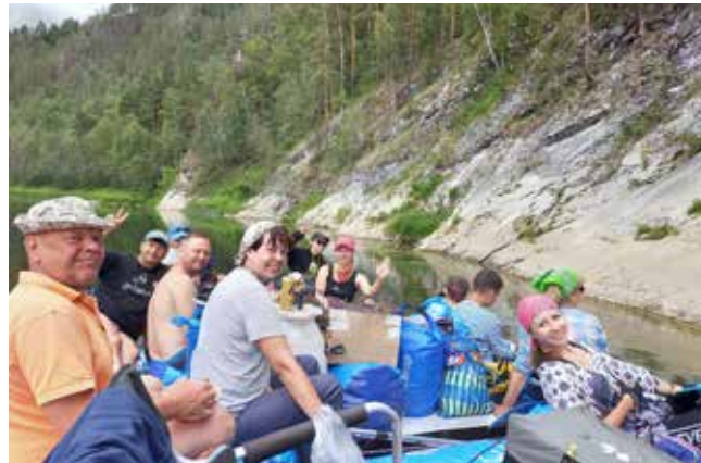
Этот вид путешествия подходит для людей активных