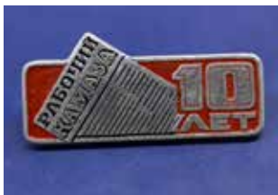
Этот значок был выпущен в 1983 году