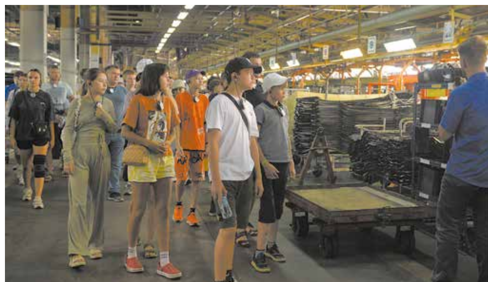
На главном сборочном конвейере всё продумано до мелочей