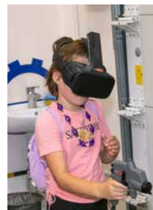
В мастерской МЦПК сначала учат красить на тренажёре. Попробуешь?

Очередной этап фестиваля «ПРОинтерес» стартует 4 сентября и продлится по 19 ноября. «КАМАЗ» остаётся партнёром фестиваля, а значит, активных участников и победителей ждут новые сюрпризы.