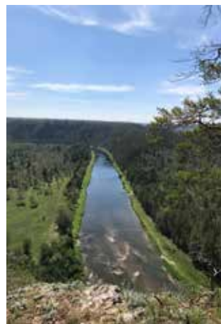
Речная гладь так и манит...