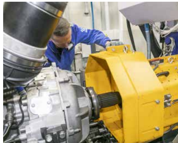
Испытание каждого Р6 занимает около 35 минут, 15 из которых уходит на установку

На обучение испытателя нужно минимум полгода — такой временной промежуток называет Владимир Баринов и поясняет: «При тестировании случаются отклонения от нор-