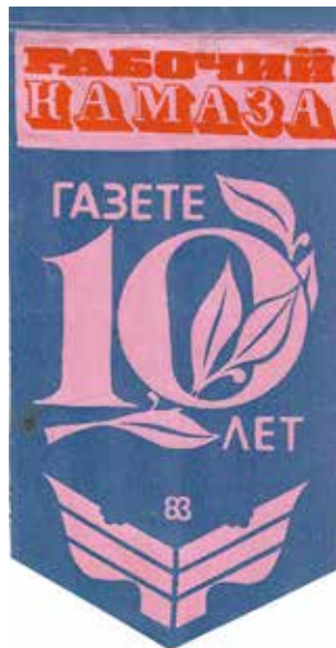
Возможно, такие памятные выпелы до сих пор хранятся в домашних архивах рабкоров — главных помощников редакции

Всё это время газета активно поддерживала рабочие инициативы, создание советов бригад, рассказывала об опыте победителей соцсоревнований, поднимала вопросы организационной и технологической подготовки производства, публиковала очерки и зарисовки о жизни заводчан, их поэтические строки. Для многих многотиражка стала другом, советчиком, помощником. Накануне десятилетия газеты камазовцы желали ей долголетия, новых творческих успехов и ждали, как и сейчас, выхода очередного номера.