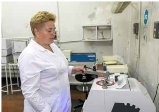
Через девять минут мелкая деталь будет надёжно запрессована в смоляной «футляр»

Есть и ещё одна полезная опция — станок может запомнить наиболее часто используемые процедуры резки, до 100 методик, а значит, времени на настройку придётся тратить меньше. Это очень важно, ведь об-