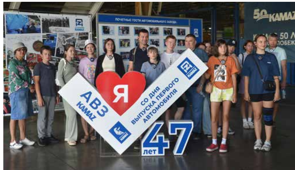
Этим гостям встречи на АвЗ запомнятся надолго

На конвейере ребята вместе с родителями впервые увидели, как устроено современное производство. Здесь всё продумано до мелочей и подчинено такту главного сборочного конвейера. Участников фестиваля удивила система логистики, плавный ход конвейера ка-