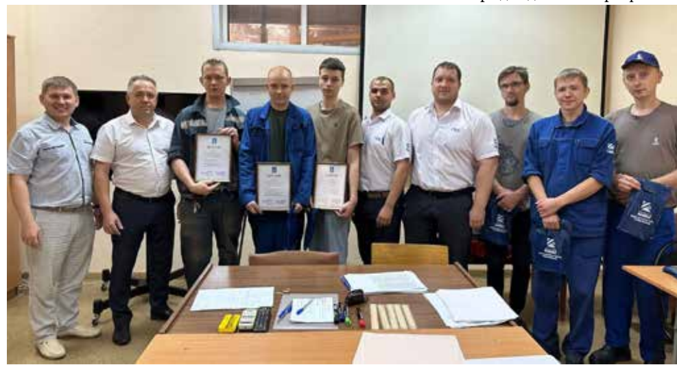
На конкурс заявили сильнейшие наладчики 33ЧиК

Администрация и профком завода запасных частей и компонентов организовали и провели конкурс профмастерства среди наладчиков станков и манипуляторов с программным управлением.