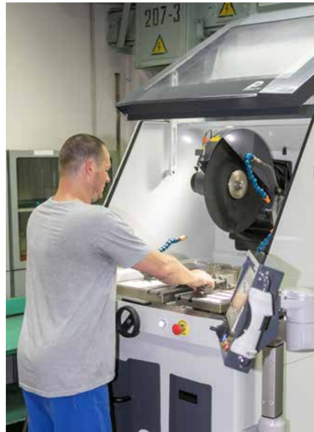
На новом отрезном станке есть всё необходимое для надёжной фиксации деталей

В лаборатории рады пополнению парка оборудования. Работники стараются выкроить минутку, чтобы лучше изучить функциональные возможности станков. А самое главное — такая высокотехнологичная подготовка обеспечит более точные результаты исследований.