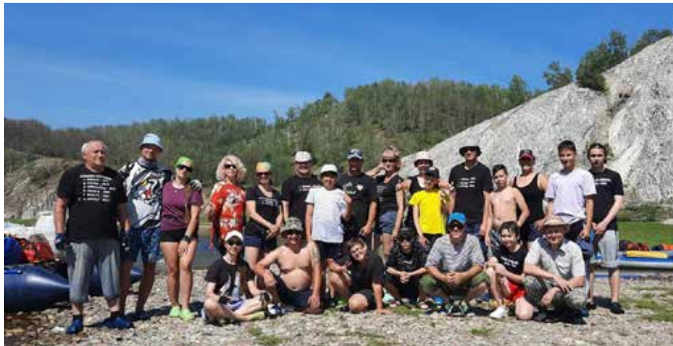
Команда «АвтоЗапчасти» к сплаву готова!

А ещё на сплаве все мечтают о бане. Инструкторы организовали такую парилку, в которой не требовалось нагревать камни на костре по шесть часов. Хотя она вмещала не более 10 человек, но за счёт печки-буржуйки позволяла на стоянках париться с утра и до вечера. Была возможность побаловать себя и чайком. В группе был лю-