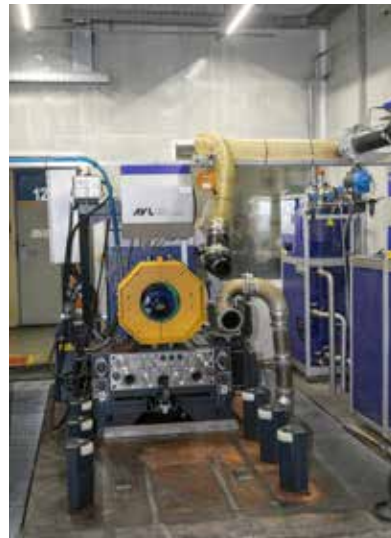
Стенд с помощью датчиков может определить недочёты в двигателе

мативных показателей — к примеру, температура не выдерживается, давление масла нестабильно. Причины всего этого специалист должен уметь находить. Позже в протоколе он укажет, какой конкретно узел мотора нужно перебрать».