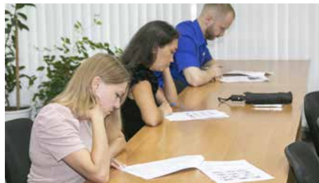
Чтобы ответить на вопросы по теории, требовалась предварительная подготовка

К решению вопроса расширения охраняемой парковки администрация и профком подходили неоднократно. После согласования с необходимыми службами силами отдела была перенесена забор, зелёная зона отсыпана гравием. В итоге после выхода из корпоративного отпуска более 70 работников получили возможность ставить свои авто на охраняемую стоянку.