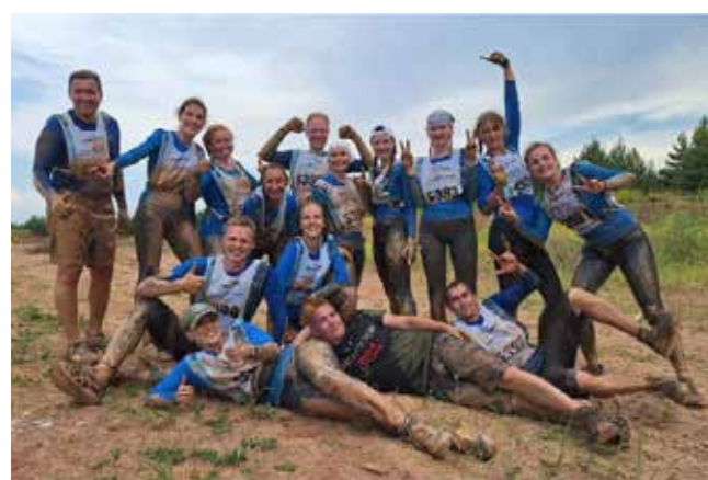
Команда «КАМАЗ-ЛИЗИНГ»: грязные, мокрые, уставшие, но абсолютно счастливые

Команда дружно, слаженно прошла все преграды и в полном составе добра-