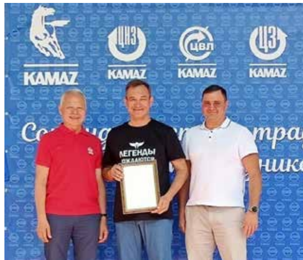
Какой праздник без чествования лучших?

Фирменным блюдом праздника стал плов, приготовленный на костре, которым все с удовольствием подкрепились. А потом была зажигательная дискотека, где вместе с родителями танцевали и маленькие участники праздника.