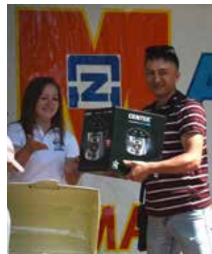
Удача в лотерее — ещё один повод для радости

Приятный сюрприз подготовил для мастеров и бригадиров профком завода.