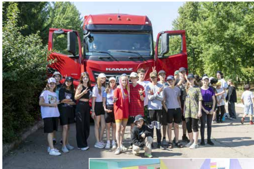
Такая фотография на фоне КАМАЗа нужна каждому

— Этим летом День «КАМАЗа» в «Саулыке» был организован для четы-