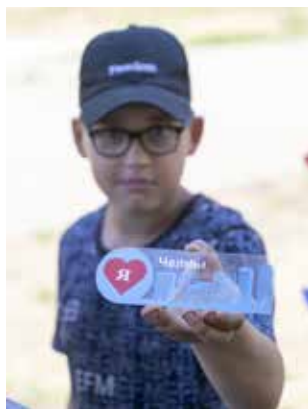
Закладки, сделанные на мастер-классе, дети получили в подарок

А ещё был квест с пятью станциями, а там задания совсем серьёзные: одно из них — разработать фирменный стиль «КАМАЗа». И