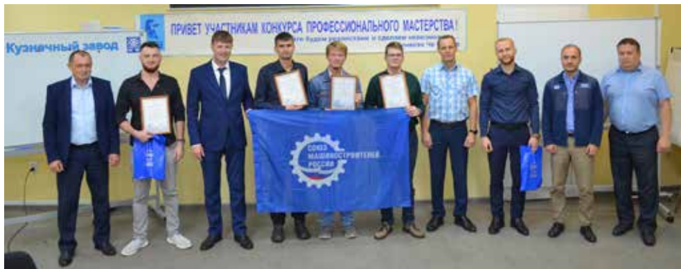
В конкурсе приняли участие девять технологов, и их смелость была вознаграждена