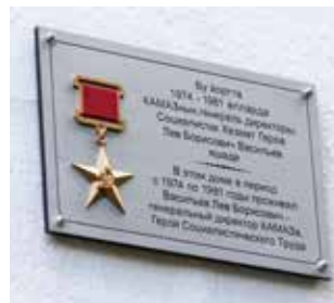
Памятная табличка на доме 9/01 установлена три года назад