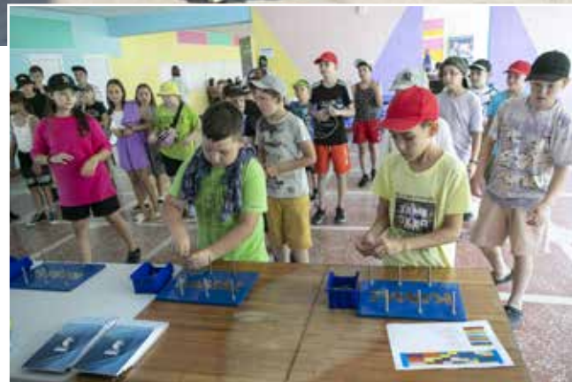
Даже чтобы гайку быстро закрутить, нужна ловкость

рёх смен. Всего было проведено восемь программ, в которых приняли участие около 6000 детей, — подвёл итоги главный специалист Корпоративного университета Станислав Рассказов. — В рамках праздника ребята не только познакомились с историей «КАМАЗа», участвовали в мастер-классах, квизах и квестах, но и в конкурсах фото и видеороликов «Мой День «КАМАЗа». В четвёртой смене мы предложили им подключиться к приложению Round, где есть челленджи, организованные при участии нашей компании, выигрывать в них призы, а самое главное, узнать много интересного о продукции автогиганта.