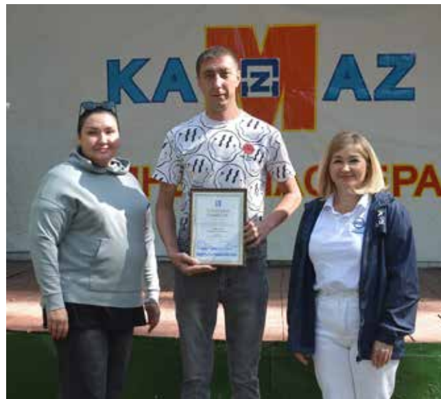
Успехи лучших мастеров отмечены наградами