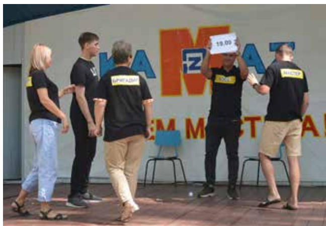
В этой миниатюре мастерам всё понятно без слов

Впечатлениями мастера и бригадиры обменивались уже за праздничным столом, смакуя ароматный, рассыпчатый плов. На следующий день они встретились на рабочих местах во время обсуждения производственных задач.