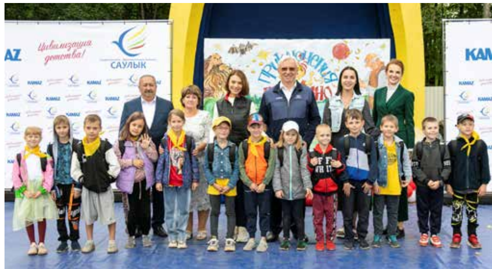
Отдыхающие зарядились хорошим настроением и получили массу эмоций