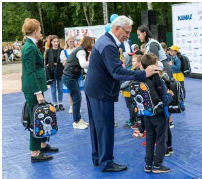
Космический подарок от гендиректора «КАМАЗа» на новый учебный год

Почётные гости подарили самым младшим школьникам из ЛНР необходимые принадлежности для нового учебного года. А затем публика увидела представление «Приключения Буратино». Интересующиеся техникой