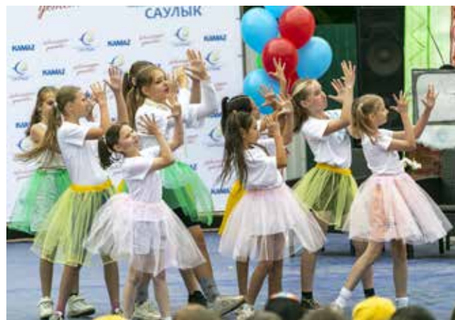
Ребят в этом возрасте занимают приключения Буратино