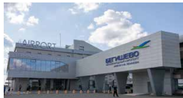
Новый терминал поможет справиться с возросшим пассажиропотоком

Подробнее о событии — на портале vestikamaza.ru