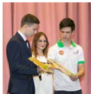
Старшие передают ключ от мастерства младшим

имеются. На «КАМАЗе» 400 востребованных профессий для тех, кто хочет создавать грузовики, которые ездят по дорогам нашей страны и обеспечивают транспортную безопасность. Проект «Профессионалитет» призван модернизировать систему среднего профессионального образования. И вам повезло, НПК — амбассадор этого проекта, созданного при поддержке «КАМАЗа». Что это даёт вам? У вас есть возможность уже во время учёбы не просто знакомиться с теми профессиями, которые есть на «КАМАЗе», но и полноценно работать, набираться опыта, быть самостоятельными. А если затем вы захотите развиваться дальше, учиться ещё, не останавливаясь на полученной в колледже профессии, у нас есть ещё один проект, реализуемый с поддержкой «КАМАЗа», — проект Передовой инженерной школы. Он даёт