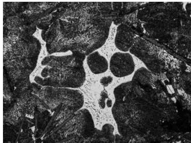
«Кентервильское привидение» проявилось при 200-кратном увеличении

С металловедами соревновалась и другая представительница литейного заво-