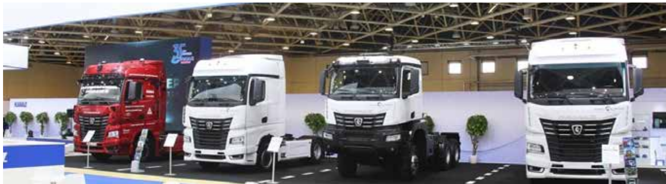
На стенде «КАМАЗа» — 30 образцов техники