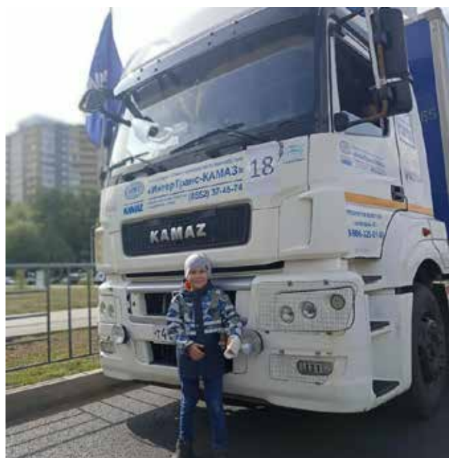
На фоне огромных фур сфотографироваться хотелось многим

26 августа в Набережных Челнах прошло зрелищное событие — XV конкурс профмастерства водителей магистральных автопоездов на Кубок мэра города. Челнинский автогигант представили два подразделения.