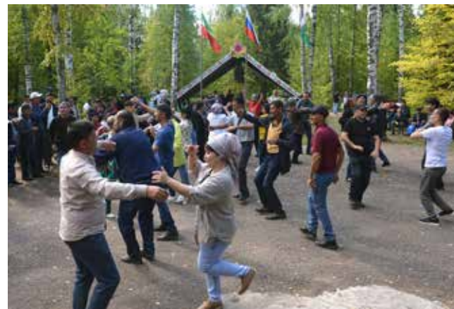
...под которые невозможно не пойти в пляс

Поздравления звучали от замдиректора предприятия