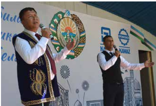
База «Иволга» наполнилась узбекскими мелодиями...

Кстати, автомобилисты продумали событие до мельчайших деталей. А само мероприятие проходило в том числе и на узбекском языке. «Байрам билан!» — поздравляли друг друга гости с праздником. Не забыли организаторы и про настоящий узбекский плов. Золотистое ароматное блюдо с чесноком, морковью и