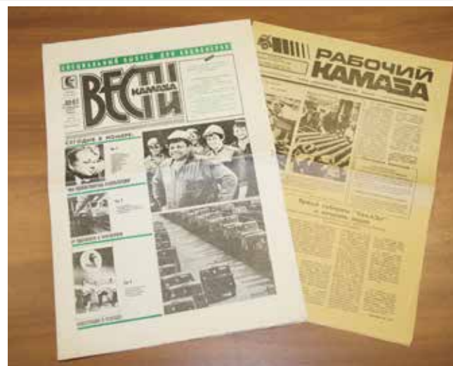
1992-й потребовал смены названия

Приказ о переименовании газеты акционерного общества и мерах по совершенствованию её деятельности в новых условиях вышел 11 февраля 1992 года, в нём было утверждено новое название «Вести КАМАЗа». Возможно, этот вариант родился после