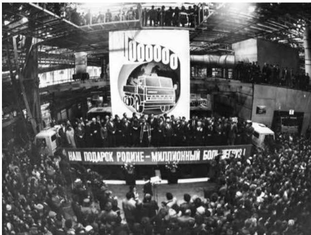
1988 год. «КАМАЗ» выпустил свой первый миллион грузовиков, на это ушло 12 лет. Второй миллион сошёл с конвейера спустя 24 года