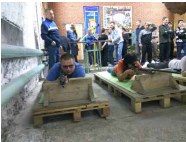
По мишеням пли!

По итогам соревнования в личном первенстве среди мужчин лучший