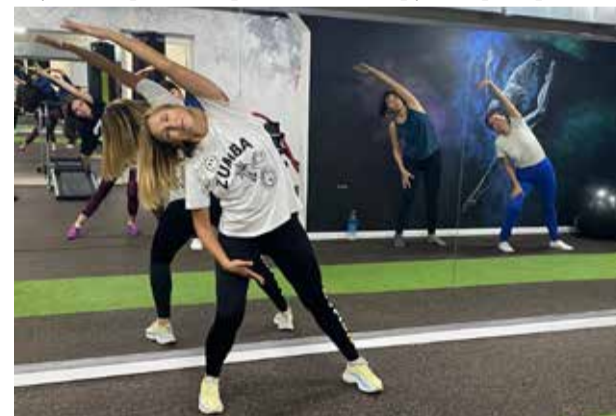
Такая разминка идёт на пользу и фигуре, и настроению

Для работниц — членов профсоюза АвЗ занятия будут бесплатными. Танцы будут устраиваться дважды в неделю, по вторникам и четвергам. Профком внимательно изучает варианты организации и других тренировок.