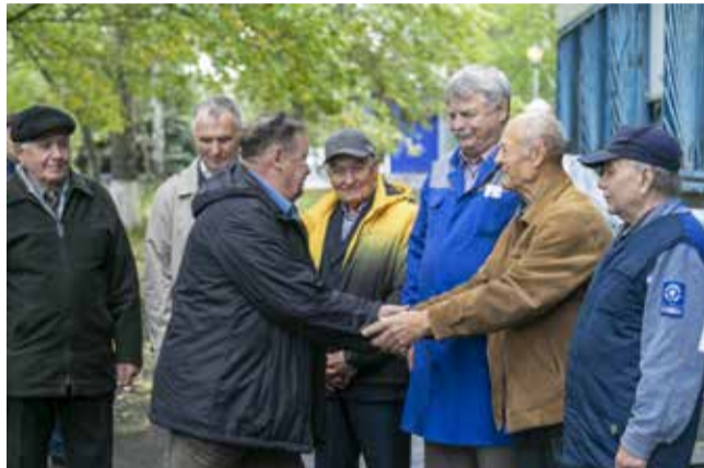
Участникам выпуска первой поковки есть что вспомнить