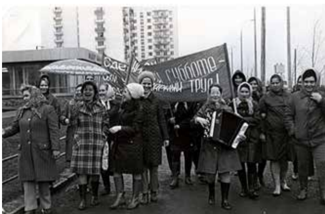
80-е годы. Даже субботник превращался в праздник