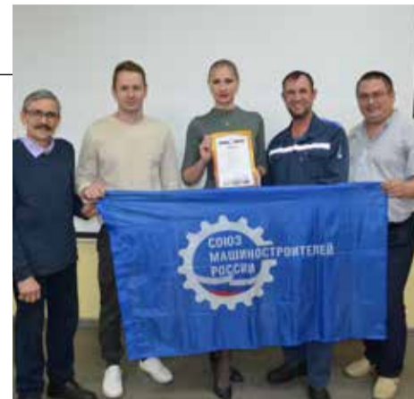
Команда ШИКа — победитель интеллектуальной игры

Игра проходила в форме ну-очень-не-простой-вопрос — ответ. Всего словесных задач было 15, разгадать их нужно было за 40 секунд. Спрашивали участников о животном мире (зачем крокодилы глотают камни? Для улучшения пищеварения и придания веса своему телу в воде), о том, зачем дуэлянты традиционному держали левую руку поднятой вверх, почему в Германии из интернета очень быстро были удалены все видео, связанные с падением Челябинского метеорита в 2013-м... Тематика, словом, отличалась разнообразием. А на один из вопросов (фальшивка, подделка, придуманная более 200 лет назад мужчинами, но используемая женщинами, причём и в наши дни), и вовсе не ответил