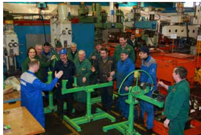
А в центре внимания газеты для рабочих был и остаётся сам рабочий

Параллельно с возведением корпусов «КАМАЗа» строились тысячи квадратных метров жилья, внутри комплексов — магазины, школы, детсады. Чтобы доставлять на производство многотысячный коллектив заводчан, «8 октября 1973 года краснобокие вагоны начали курсировать по маршруту