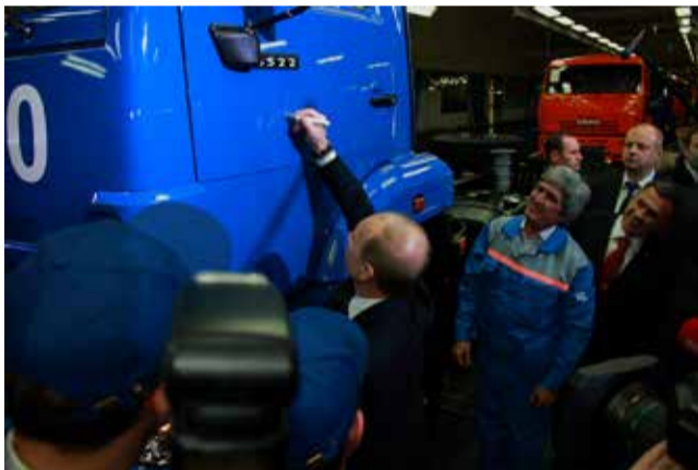
2012 год. Владимир Путин, тогда премьер-министр РФ, оставляет свой автограф на кабине двухмиллионника КАМАЗ-6522