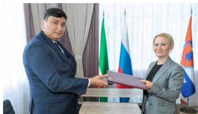
«КАМАЗ» и Ташкентский госуниверситет сотрудничать готовы

В завершение визита стороны подписали меморандум о сотрудничестве между «КАМАЗом» и Ташкентским госуниверситетом — предполагается организация и проведение стажировки преподавателей, практики студентов и трудоустройства выпускников.