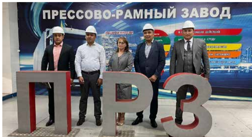
На ПРЗ представители Министерства высшего образования, науки и инноваций Узбекистана познакомились с технологическими процессами и рабочими местами, где трудятся их соотечественники

Гостям дали возможность ознакомиться с базовыми образовательными организациями «КАМАЗа» — проведены встречи в Набережночелнинском политехническом колледже, Техническом колледже, Камском государственном автомеханическом техникуме и Набережночелнинском институте КФУ. В Техничес-