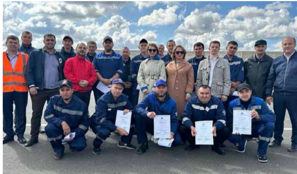
Все 10 конкурсантов состязанием довольны: и силы свои проверили, и поддержку получили

Все водители награждены дипломами различной степени: за участие или за призовое место. Кроме того, все конкурсанты получают денежные премии от профкома и руководства ТФК.