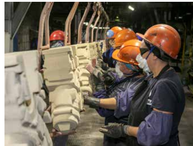
От того, как будут очищены стержни, зависит качество блока цилиндра

— Сложности, конечно, поначалу были, и в первую