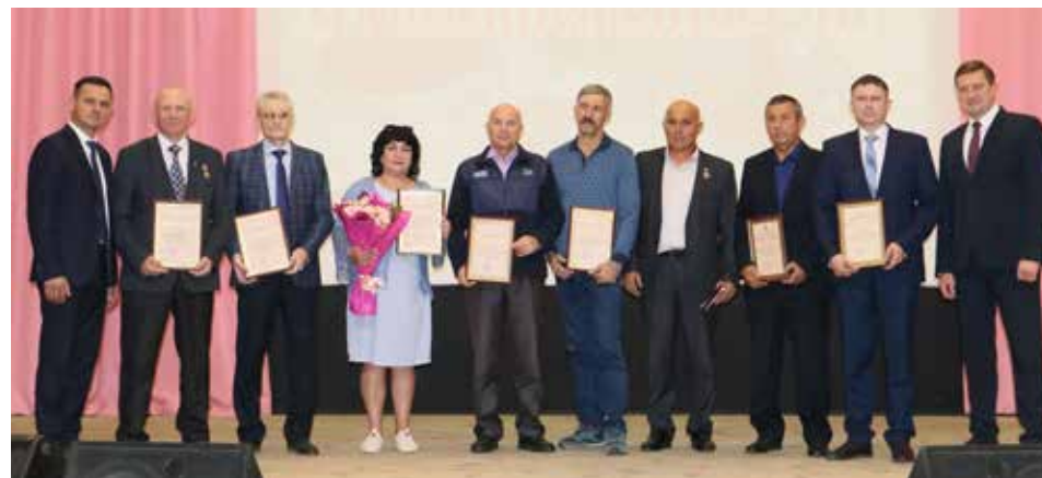
Лучшие работники — главные герои праздника