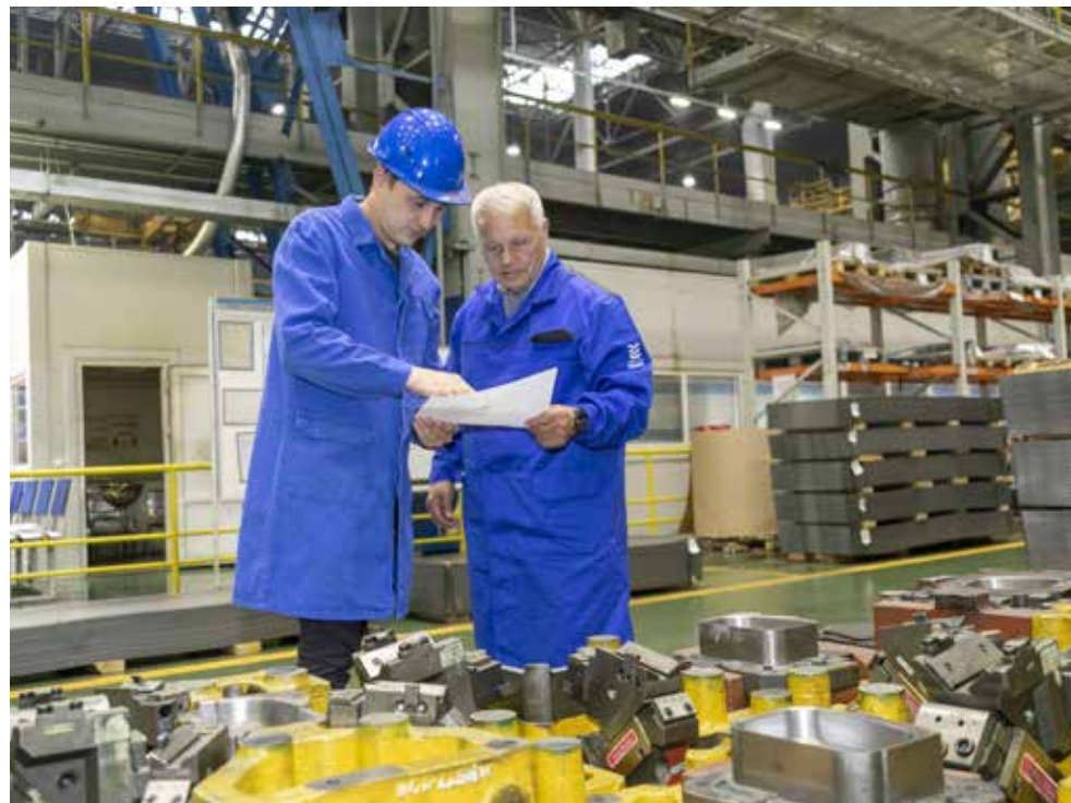
Молодым инженерам-технологам опытный наставник поможет разобраться с любой задачей

— Раскачиваться было некогда, планы перед