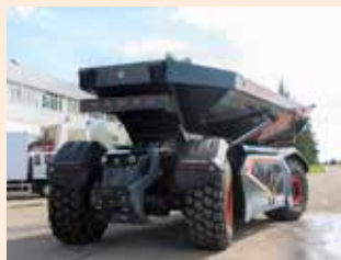
Такой беспилотник для горняков просто мечта

Карьерный самосвал «Юпитер 30» предназначен для автоматической транспортировки горной породы при разработке руды и способен перевозить до 27 тонн груза. Его отличительными особенностями являются челночный режим движения, гибридная силовая установка, полный привод и управляемость всех мостов.