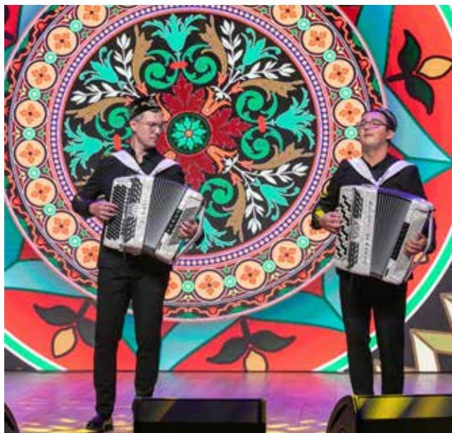
Татарские и русские народные песни на аккордеонах пришлись по сердцу зрителям