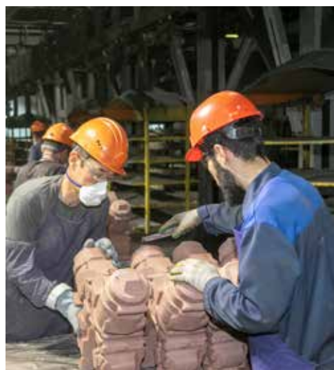
Покрывание стержней антипригарной краской — не менее ответственный момент