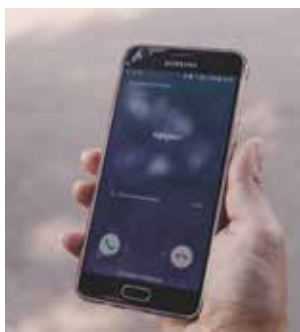
Диагностика телефона? Спасибо, не надо!

Такие схемы относятся к гибридным сценариям мошенничества, при которых злоумышленники атакуют телефон, переводят клиентов на фишинговые сайты и приложения. В случае установки такого приложения или подключения услуги клиент рискует потерять контроль над онлайн-банком и своим мобильным устройством,