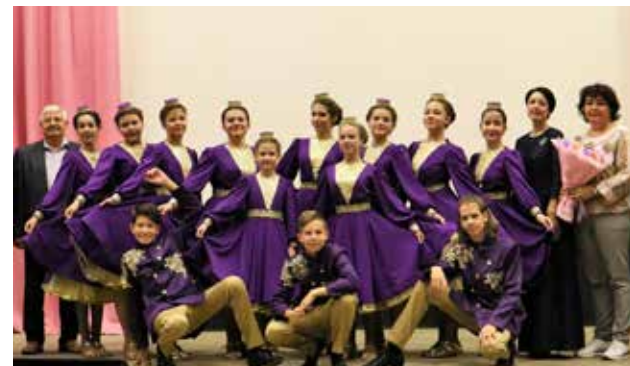
Артисты филармонии порадовали дизелистов своим выступлением

Выдающихся специалистов отметили наградами федерального, республиканского, городского и корпоративного значения. За добросовестный труд и высокий профессионализм 16 заводчан наградили почётными грамотами и благодарственными письмами ПАО «КАМАЗ», 20 лучших работников занесены на заводскую Доску почёта, 40 человек