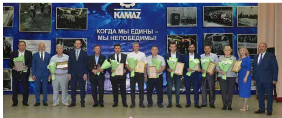
Награды — высокая оценка работы заводчан

После официальной части настал черёд выступлений артистов. Своим искусством заводчан порадовали творческие коллективы Набережночелнинской филармонии. Своими яркими номерами они украсили этот праздничный день.