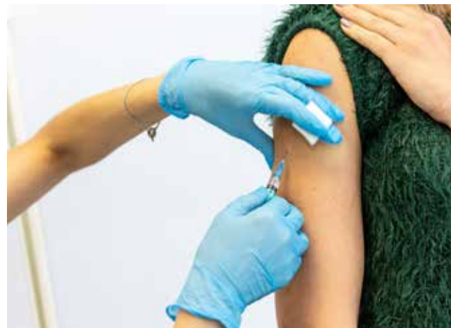
Зиму надо пережить без гриппа

— Мы применяем комбинированную вакцину «Совигрипп», она защищает от штаммов гриппа А и В, которые ожидаются в предстоящем сезоне. Пик эпидемии