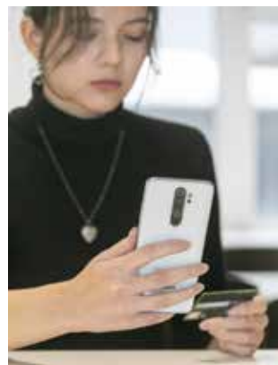
Не будьте равнодушны, если кто-то на ваших глазах поведётся на уловки мошенников

6. Ограничьте доступ к возможности получения звонков, просмотра фотографий и сведений о пользователе, включая контактную информацию.