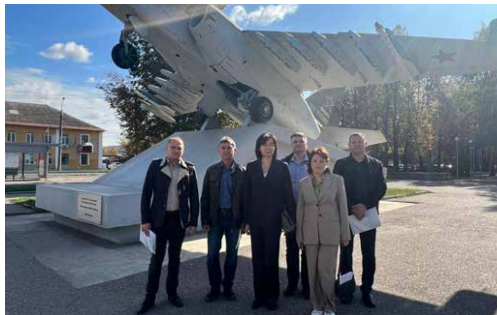
В Уфе камазовцы узнали, как готовят кадры для производства двигателей самолётов