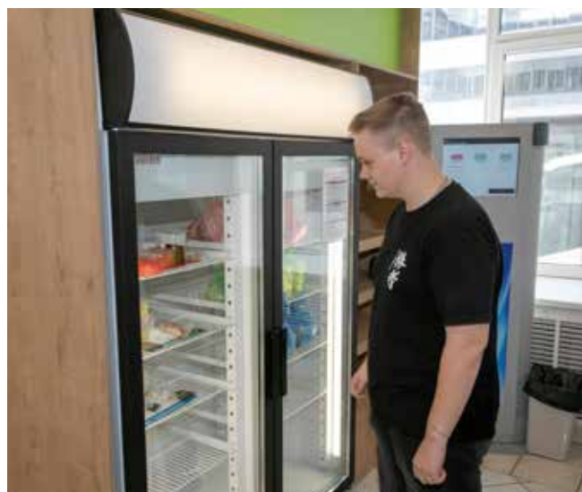
Комплексный обед можно взять и в холодильнике

В столовой генеральной дирекции стартовал пилотный проект «Холодильник на доверии». Его организаторы — департамент трудовых отношений и iFCM group — решили таким образом обеспечить полноценным питанием тех, кто не успел в столовую к обеду или задерживается на работе.