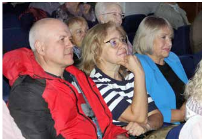
Зрители внимают каждому слову со сцены