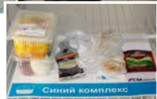
Разогревайте и... приятного аппетита!

Меню «Холодильника на доверии» обозначено цветовыми категориями: красный комплекс стоит 110 рублей; зелёный — 150 рублей; синий — 170 рублей. В состав комплексов входят салат, второе блюдо и гарнир, хлебобулочные изделия, чай,