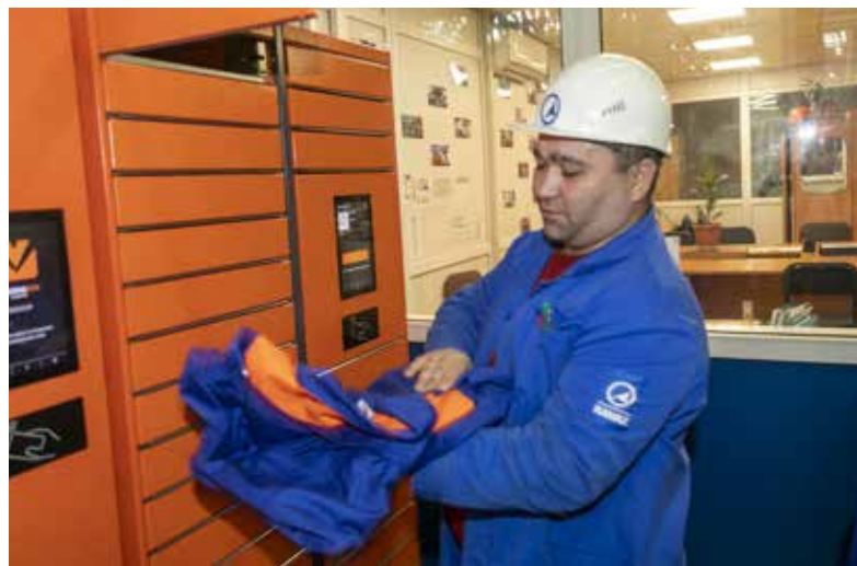
Получите чистую спецовку!

Свой опыт реализации проекта руководители логистического центра предлагают внедрить во всех подразделениях «КАМАЗа». Здесь уверены: автоматизированная выдача СИЗ придётся по душе работникам и снизит нагрузку на службы охраны труда.