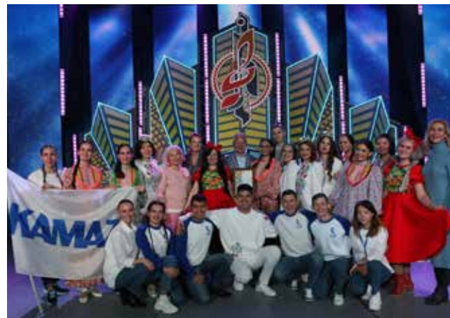
Камазовской команде — успеха и в финале фестиваля!

Все эти четыре номера отобраны для участия в финале фестиваля «Наше время — Безнен заман», который пройдёт с 17 по 20 ноября в Казани. Призовой фонд составит 4 млн рублей. Обладатель Гран-при получит денежный приз в размере 500 тысяч рублей, также учреждён спецприз «Герой нашего времени» — 350 тысяч рублей. К слову, в прошлом году наша команда была удостоена звания «Герой нашего времени».