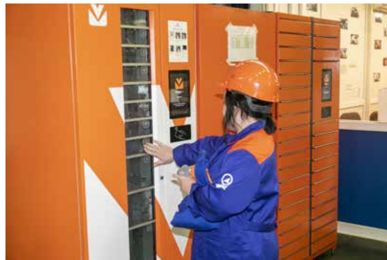
Перчатки теперь выдаёт автомат