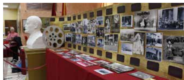
Фотовыставка — это возможность перенестись в свою юность

Концерт был организован администрацией при поддержке профкома завода.