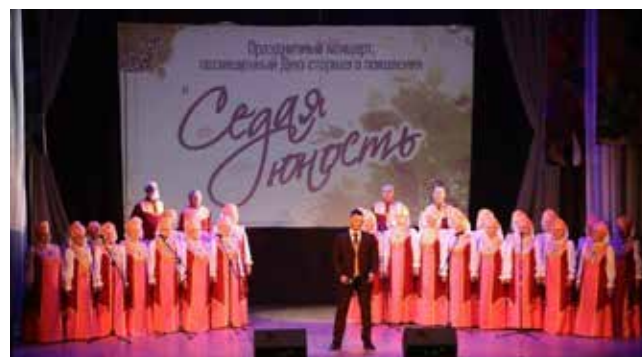
Какой праздник без хорошей песни?