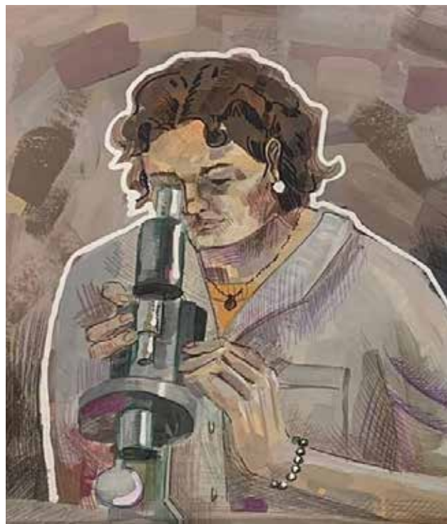
Работа «Лаборант» выполнена уже опытной рукой