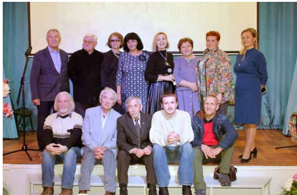
Самые активные участники встречи

На вечере памяти присутствовали и родные Инны Лимоновой: невест-