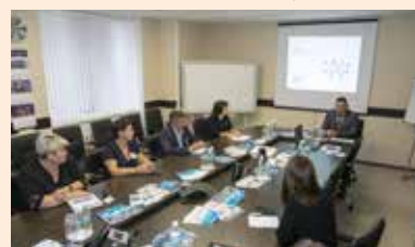
Коррупции можно противодействовать только сообща

Подобный подход позволит выстроить единую систему на всём автогиганте, в который входит огромное количество дочерних организаций. «КАМАЗ» ведёт свою деятельность в соответствии с требованиями и нормами применимого законодательства, а также правилами, кодексами и стандартами, принципами деловой этики, регламентированными нормативными документами.