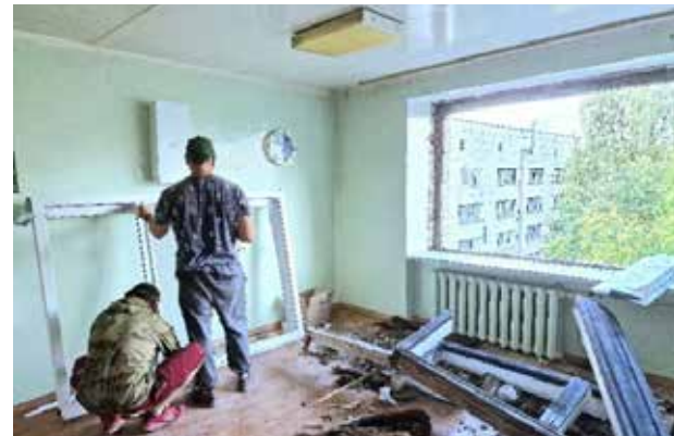
Замена окон в разгаре

По словам представителя больницы, около 93% всех работ по замене окон уже выполнены. Всего будет смонтировано 320 стеклопакетов. Делается это в рамках масштабного ремонта здания — в настоящее время в нём, помимо окон, меняются инженерные коммуникации и ремонтируются палаты.