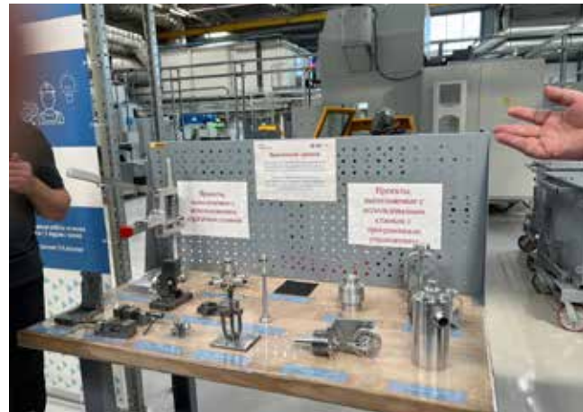
Такие проектные работы выполняют учащиеся ПУЦ

Роль куратора-ментора на производстве чаще всего берут на себя начальники цехов или их заместители. Они про-