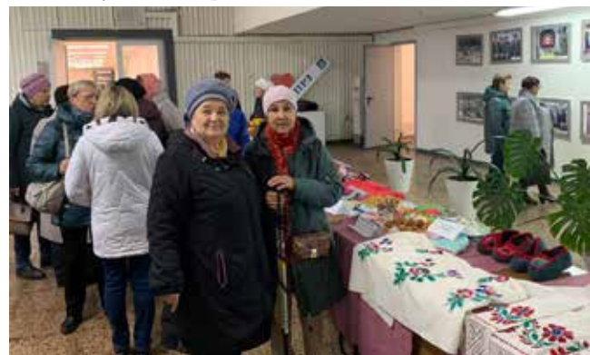
Более 300 пенсионеров согрела встреча на ПРЗ

вущих в Набережных Челнах и работающих на «КАМАЗе». Гости аплодировали танцам и песням чувашей, марийцев,