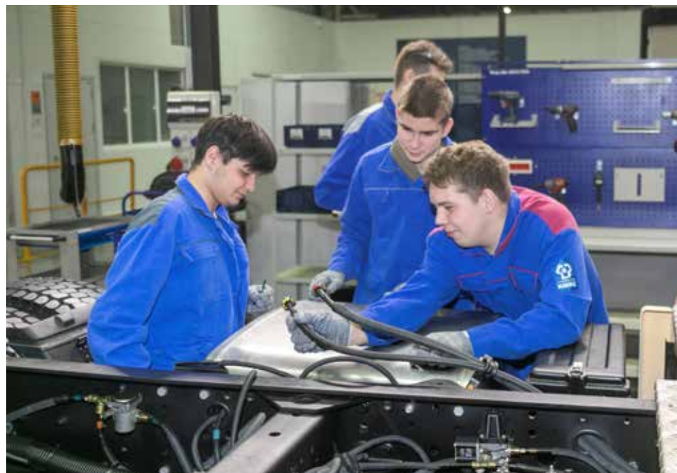
Студенты КГАМТ действуют почти как опытные автомеханики

ми, возникает ощущение, что многие из них уверены в собственных силах и полны решимости стать автомеханиками. Кто-то даже лелеет мысль открыть собственную автомастерскую в будущем. Но все сходятся во мнении: практика в УТК «КАМАЗа», несомненно, обогатит их знания.