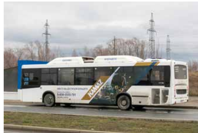
«Вместе мы достигаем большего» — слоган, который мотивирует влиться в команду

Иллюстрации украсили вахты разных габаритов