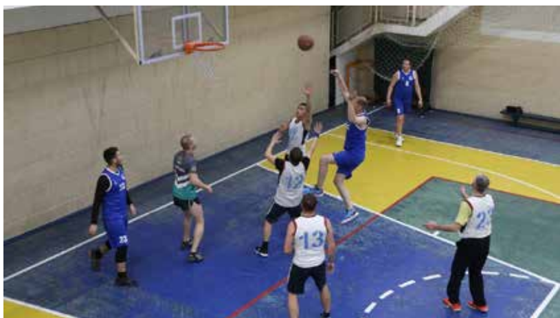
Команды продемонстрировали зрелищный баскетбол

К слову, спортсмены «ЧВК» выиграли и в апрельских соревнованиях, обыграв в завершающей встрече турнира ПРЗ.