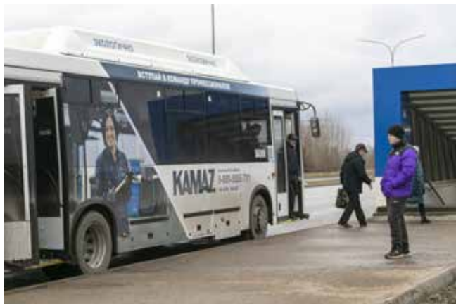
Такие яркие автобусы не заметить невозможно

Больше 50 брендированных автобусов для работников «КАМАЗа» выехали на дороги города. Теперь вахту не пропустишь — своих видно издалека.