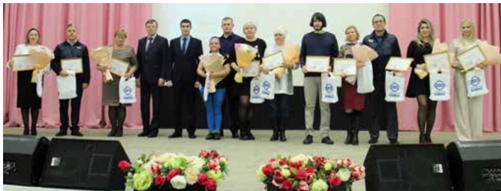
В свой профессиональный праздник специалисты по качеству заслуженно получили награды