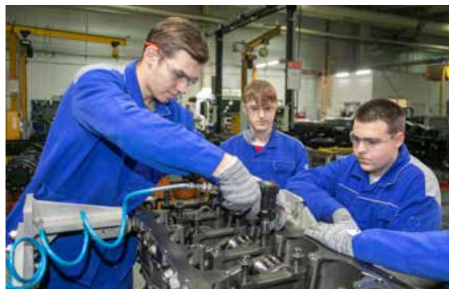
Болты нужно закрутить так, чтобы не было ни недотяга, ни перетяга