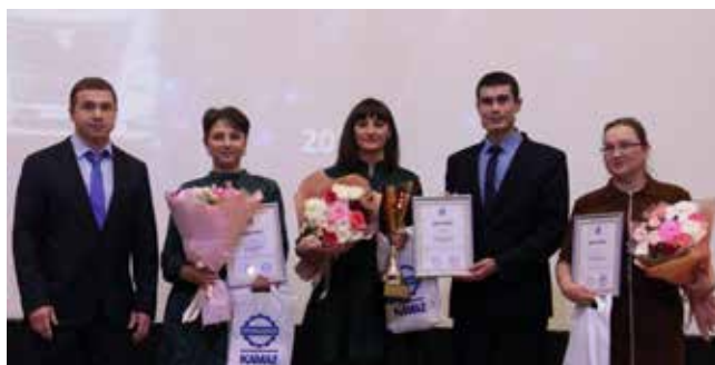
Новинкой года стал конкурс профмастерства среди контролёров ОТК. Первая тройка лучших

С 2011 года департамент качества проводит конкурс «Лучший менеджер по качеству», который позволяет выявить профессионалов своего дела. По итогам 2023 года список лучших менеджеров по качеству в первой номинации дополнили: на-