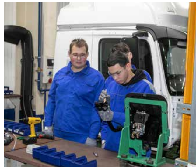
Свободный ход педали можно проверить с помощью специального щупа