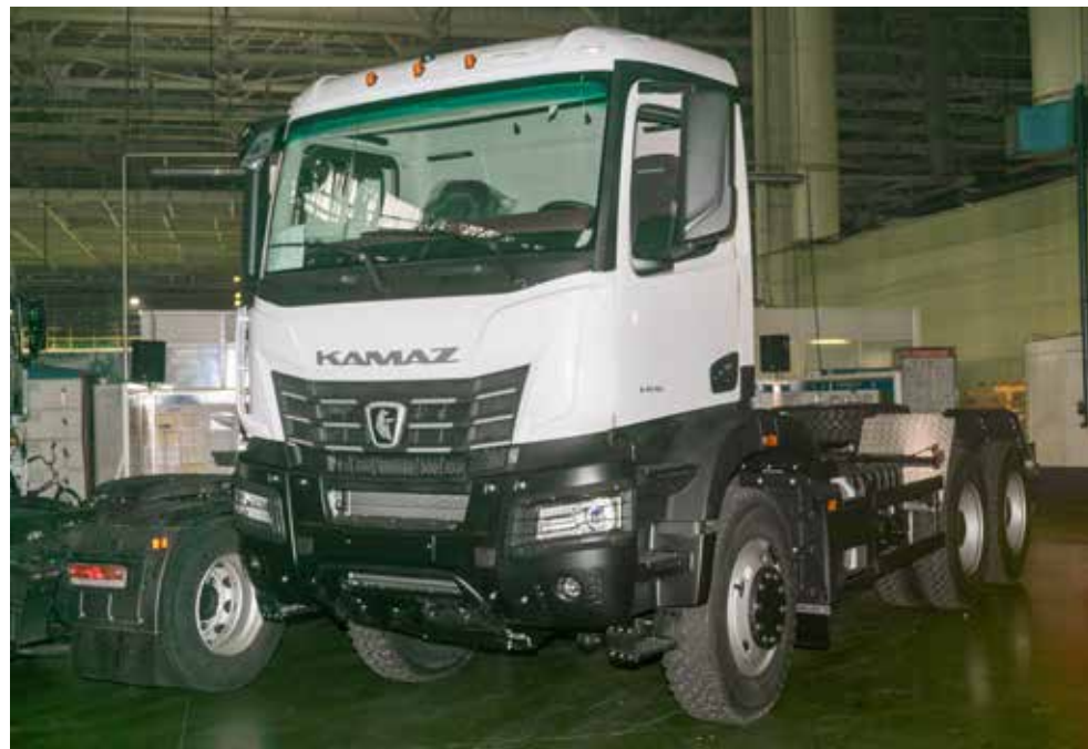
Обновлённый самосвал поколения К5 ждёт отправки на испытания

А на автомобильном уже заложили ещё один КАМАЗ-6595, на подходе два обновлённых тяжёлых четырёхосных большегруза 65951. Пойдут самосвалы по трассам, на стройки, в карьеры!