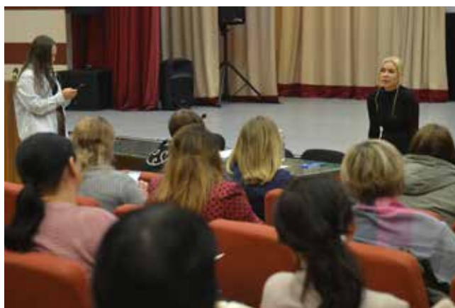
Разговор с психологом получился откровенным, доверительным

Следующий шаг в самопознании — уровень взаимоотношений с супругом. Участницы по 10-балльной шкале оценивали такие важные сферы как уважение, доверие, чувство собственного достоинства, совместное времяпровождение, общие интересы,