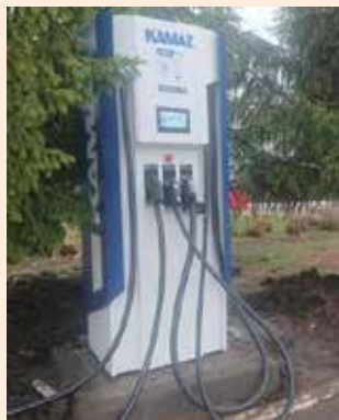
Заправка у гендирекции

Под брендом Non-Stop Power работает казанский производитель зарядных станций для электрокаров. Компания уже установила 450 станций в России и странах СНГ, около 100 из них смонтированы в Татарстане.