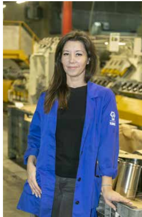
Мастера Графинкову заставить сидящей невозможно. Но «ВК» сумели остановить мгновение

— До того ни разу не участвовала, только в общекамазовском, там командный зачёт был. А тут зашла в приёмную начальника