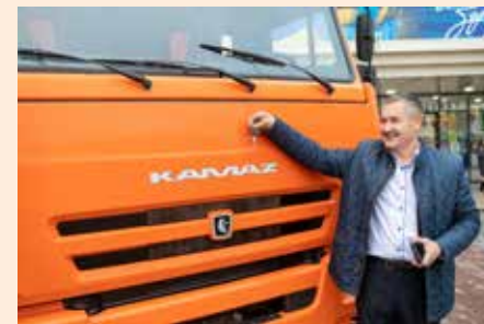
Грузовик КАМАЗ-65115 — очень нужный для техникума подарок

Автомеханический техникум был создан в 1973 году для подготовки квалифицированных кадров под потребности «КАМАЗа». И по сей день он обеспечивает «КАМАЗ» квалифицированными кадрами и обучает специалистов по широкому списку востребованных рабочих специальностей.