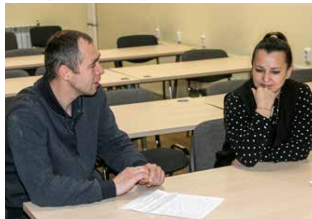
Искусством убеждения должен владеть каждый мастер