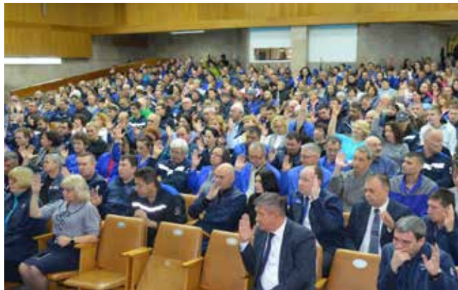
Работники поддерживают курс администрации и профкома завода