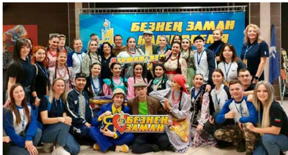
Все пять камазовских номеров, представленные на фестивале, отмечены наградами