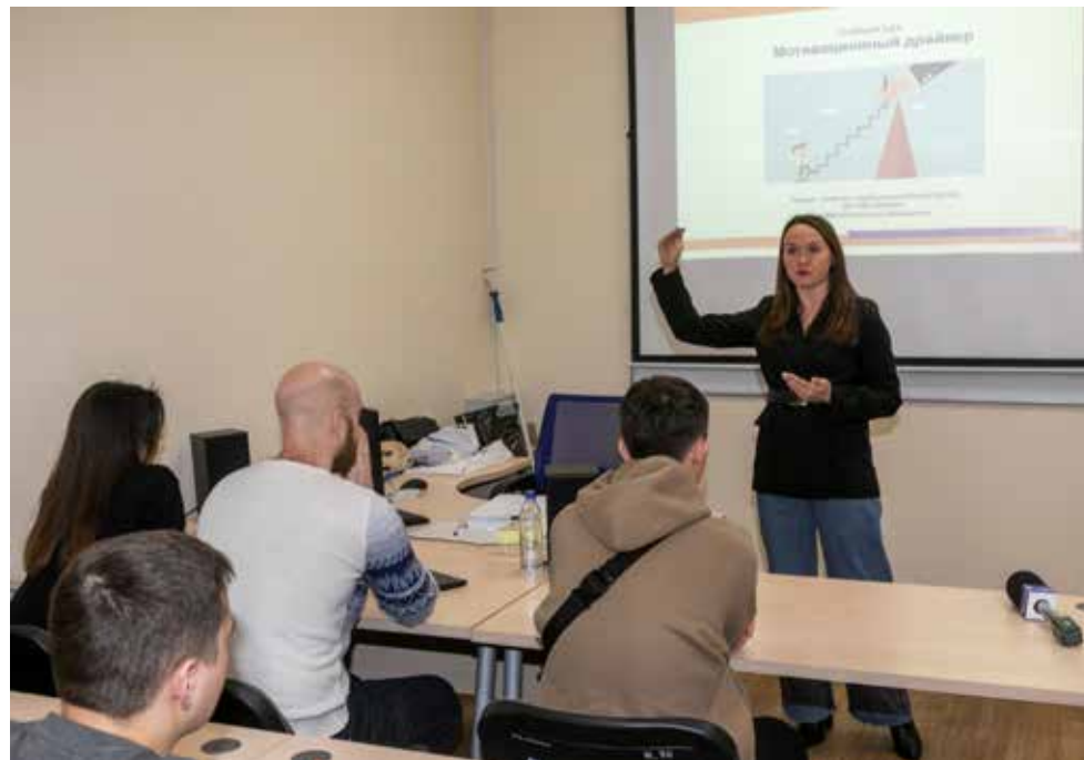
Тренинг «Мотивационный драйвер» стал отличным прологом к конкурсу

Во втором и третьем этапах мастерам требовалось