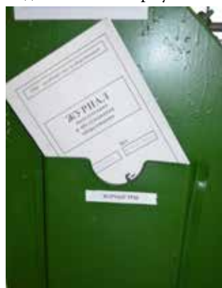
Фрагменты визуализации и организации рабочего пространства на участке холодной резки заготовок