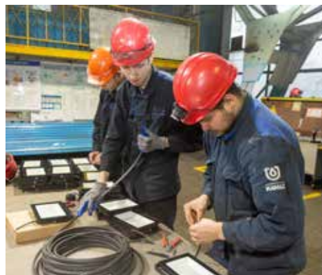
Практиканты ловко справляются с проводами для светильников

После выступления Дмитрия Староскольского слово взяли камазовские учителя практикантов. Они отметили добросовестное отношение подопечных к поручениям, желание трудиться и в целом хорошую дисциплину, завершив речи приглашением: «После ссуза ждём в бригаду». В свою очередь, студенты-электромонтёры поблагодарили своих наставников. Далее ребята заполнили анкету (обратная связь по организации практики) и отправились по своим рабочим местам.