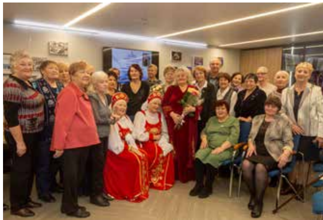
Прекрасный вечер завершился совместным фото с любимой певицей