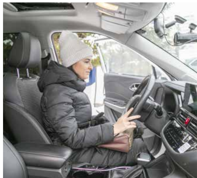
...и изучить каждую деталь авто