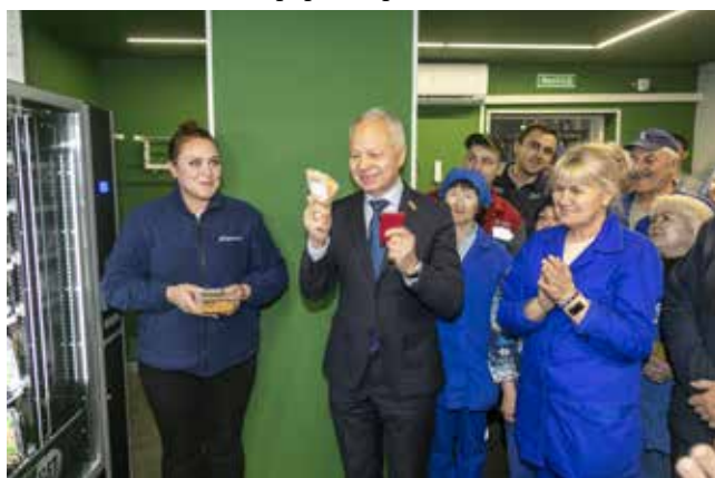
В вендинговом аппарате можно найти перекус на любой вкус