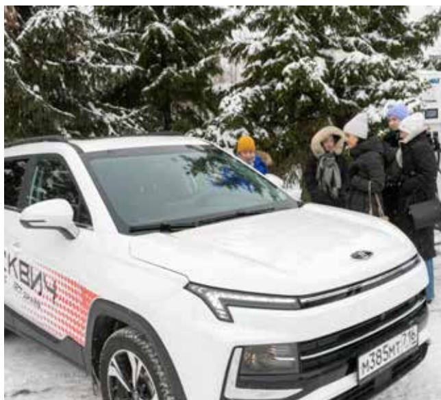
У камазовцев появилась возможность поближе познакомиться с возрождённым «Москвичом»...