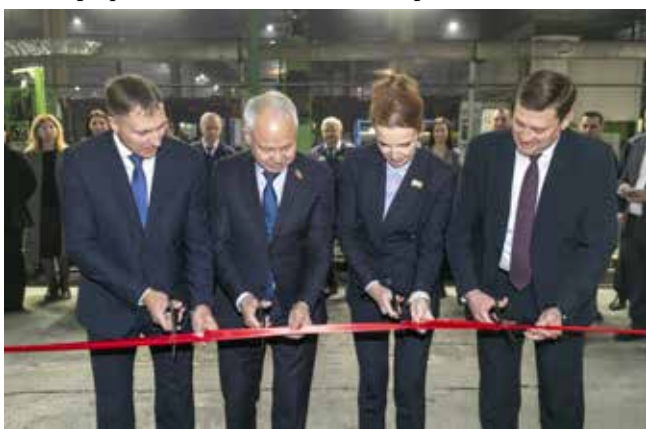
На «движках» 24 ноября открыли сразу две комнаты отдыха

Комнаты психологической разгрузки создаются для заводчан в рамках выполнения обязательств коллективного договора «КАМАЗа». В этих помещениях сотрудник может расслабиться и набраться сил во время перерыва, быстро и эффективно снять физическое и эмоциональное напряжение и восстановить работоспособность.