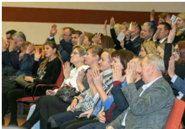
Отчёт профсоюзного комитета утверждён единогласно