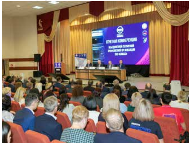
Отчётная профсоюзная конференция впервые утвердила стратегию развития

Сейчас в рядах нашей организации 40 тыс. работающих (это 81% профсоюзного членства) и 25 тыс. пенсионеров.