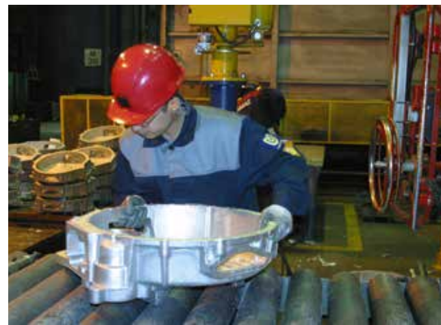
За качество отливок в ответе в первую очередь начальник ПЦЛ