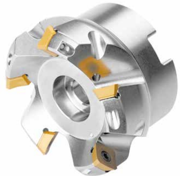
Твердосплавные пластины «Микробор» для торцевой фрезы превосходили по стойкости в 33 раза базовые