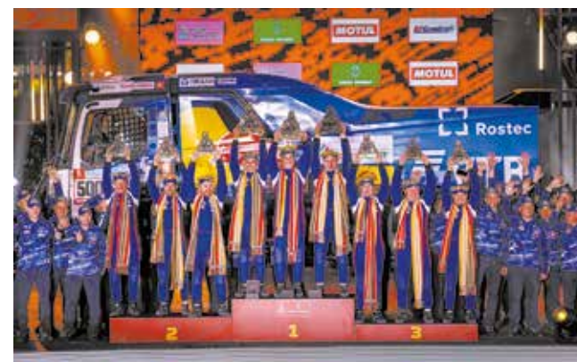
Триумфальные победы «КАМАЗ-мастера» незабываемы