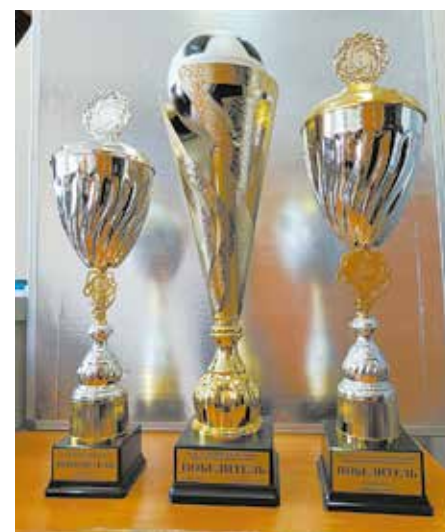
Выигранные за один год кубки по баскетболу, футболу и волейболу — уникальное достижение для «Челныводоканала»

Параллельно с самыми зрелищными и популярными видами спорта «Челныводоканал» делает упор на лыжи, лёгкую атле-