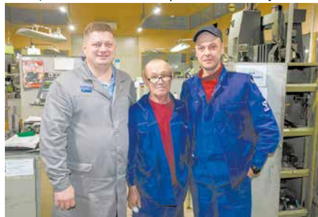
Качество — работа командная: рабочие понимают начальника с полуслова, а он доверяет им