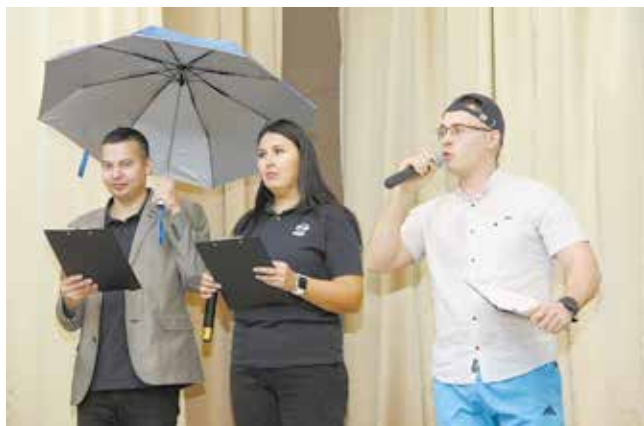
Молодёжь «КАМАЗа» оригинально представила деятельность профкома автогиганта в прогнозе погоды

В столицу отправилась команда, сформированная из работников АвЗ, ПРЗ, ЛЦ, БЗГД — ДР, БЗГД по УПиОР, ЦПО, а также «ПЖДТ-Сервис». На конкурсе сборная «КАМАЗа» попала в первую группу, где выступали производственные предприятия. Участники привезли с собой визитку, обыгранную в виде прогноза погоды: