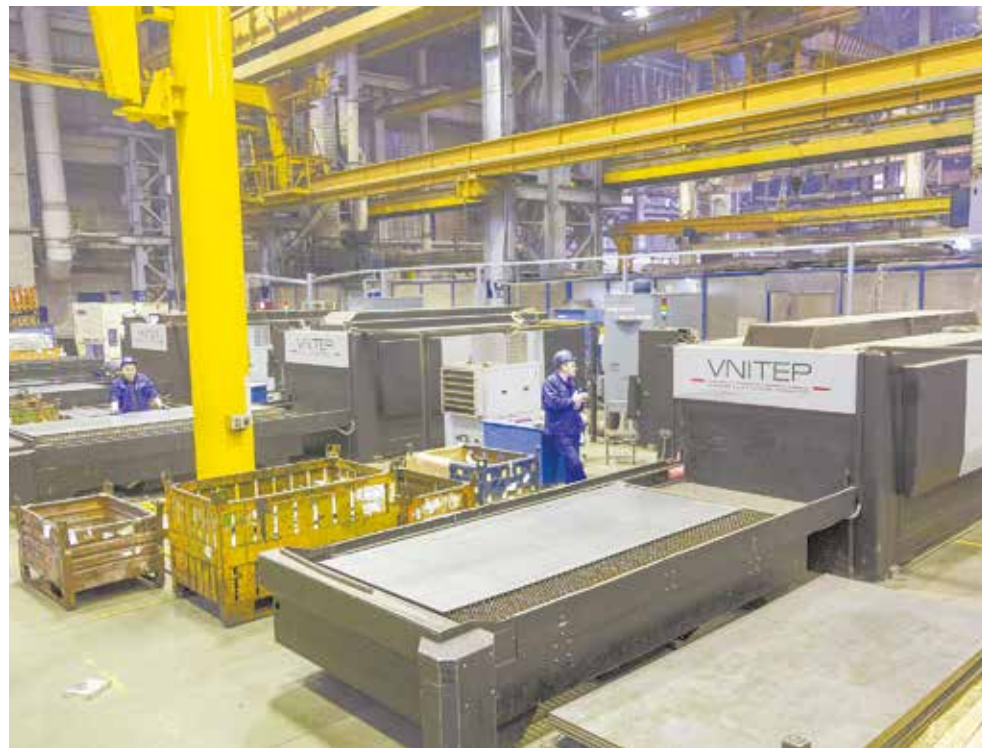
Когда работа организована правильно, риск получить травму сведён к минимуму

В тот роковой вечер слесарь-ремонтник, чтобы провести строповку нужного блока, встал на индуктор, расположенный на полу, затем застропил установленный третьим ярусом индуктор и с помощью кран-балки поднял его на высоту более двух метров, чтобы переместить к электрокару. Стоя на индукторе с пультом управ-