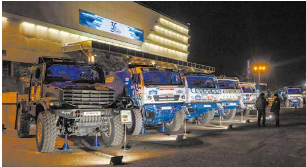
Эти гоночные болиды знает весь мир