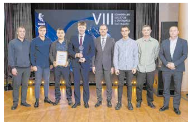
Команда кузнецов вновь завоевала главный кубок соревнований

— Установка нового оборудования накладывает на мастеров дополнительные обязательства по его эксплуатации: необходимо обеспе-