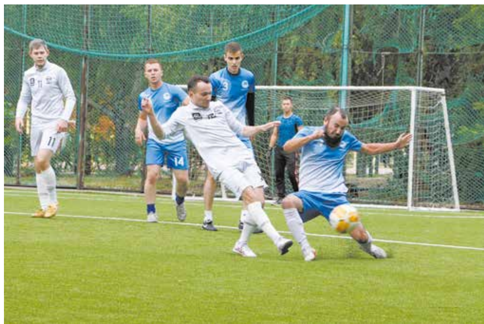
Все футбольные состязания «ЧВК» и АвЗ в этом году выдались зрелищными и упорными