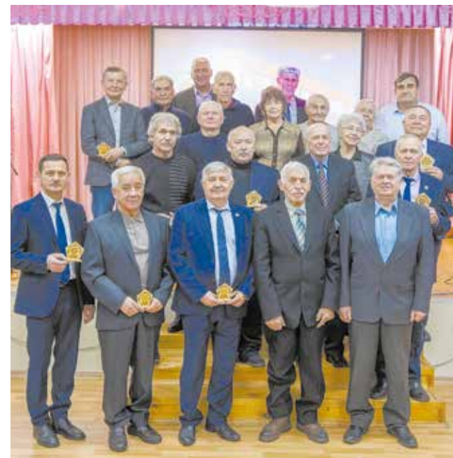
4 декабря для ветеранов «движков» — день особенный

Первопроходцы от души поблагодарили студентов за подарки. Они были искренне тронуты вниманием молодёжи. В завершение гости праздника сделали общую фотографию на память.