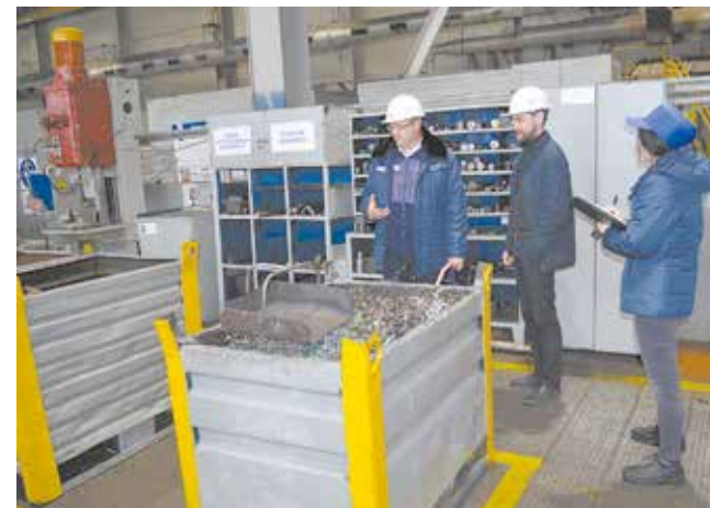
На участке семь тар под стружку, каждая на своём месте, как и оборудование, покрашена в серый цвет. Рядом — для удобства токарей — специальные стеллажи и ячейки под заготовки

Плюсом к улучшениям на территории участка стала возобновлённая разметка, обычные лампы освещения заменили на диодные, в том числе и у обдирочно-шлифовального станка. Кроме того, у рабочих появилась мотивация поддерживать