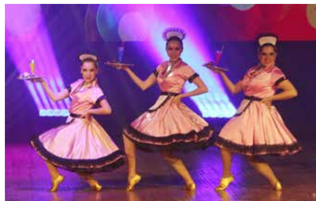
Официантки из «Safe «Фирменный стиль» очаровательны