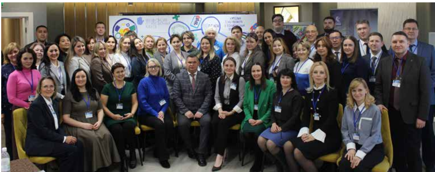
Камазовская комплаенс-конференция прошла в третий раз. Перенять опыт борьбы с коррупцией приехали и представители татарстанских предприятий