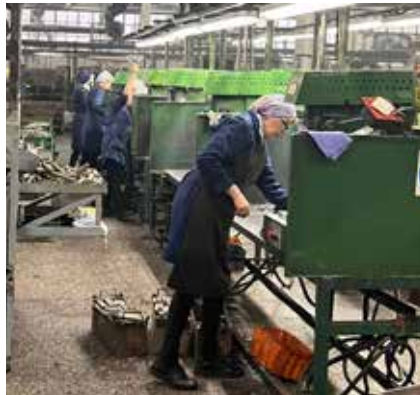
В косынке работать удобнее!

Отчёты об опыте в области охраны труда «дочки» из Башкортостана переданы руководству компании, представители ДПБиЭ рассказывают о них и на встречах с коллективами подразделений в рамках трёхмесячника. Их участники ещё раз убедились: чтобы уберечься от травм, надо всем соблюдать правила охраны труда и осторожность, и делать это каждый день.