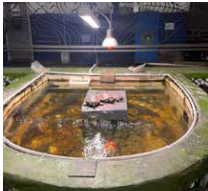
Микроклимат в «Автономали» по душе даже черепашкам

Порадовала директора ДПБиЭ «КАМАЗа» и производственная дисциплина. Заводчане трудятся в спецодежде, в головных уборах, применяют средства индивидуальной защиты. К ведению документации по охране труда у представителей «КАМАЗа» тоже вопросов не было.