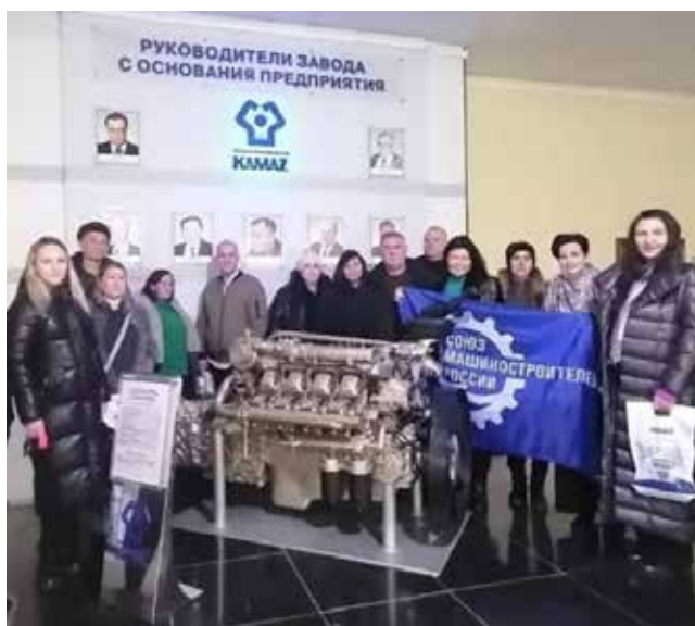
Всех этих людей объединяет то, что их дети готовятся стать дизелистами

Родителям показали рабочие места, где в скором будущем их дети-студенты будут проходить производственную практику. По окончании мероприятия родителям вручили небольшие памятные подарки. Ну и без общего фото, конечно же, никуда!