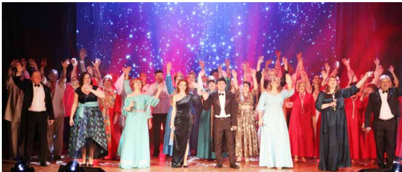
Этот вечер завершился под звёздным небом