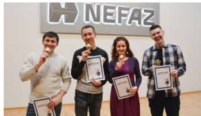
Первые нефазовские стендаперы получили в подарок миниатюрные микрофоны. Это напоминание о том, что зритель ждёт новых историй