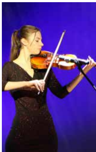
Исполнение мелодии «Город, которого нет» на скрипке заворожало публику

В завершение события все камазовские артисты вышли на сцену и исполнили песню «Вместе» на татарском языке под медленно опускающийся занавес. «А голоса какие сильные!», «А как они танцевали!», «Таланты!» — слышалось тут и там от расходящихся по домам зрителей.