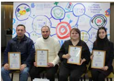
Четвёрка победителей конкурса «Словом по коррупции»