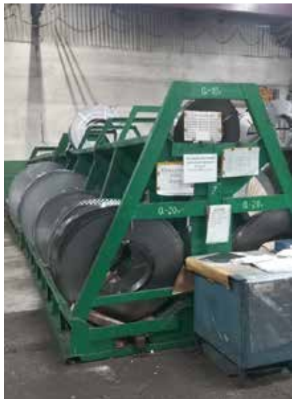
Металлические рулоны хранятся в специальной таре на стеллажах

За пять лет работы на этом предприятии не было зафиксировано ни одного смертельного случая. Последнюю травму с тяжёлыми последствиями для здоровья работник получил в 2018 году, лёгких за пятилетку было 13, в этом году произошёл всего один такой случай. Меж тем на заводе трудится 2680 человек, есть термическая, гальваническая и механическая обработки, холодная и горячая объёмные штамповки. Его продукция — крепёжные изделия и пружины для автомобильной промышленности, а также металлорежущего инструмента.