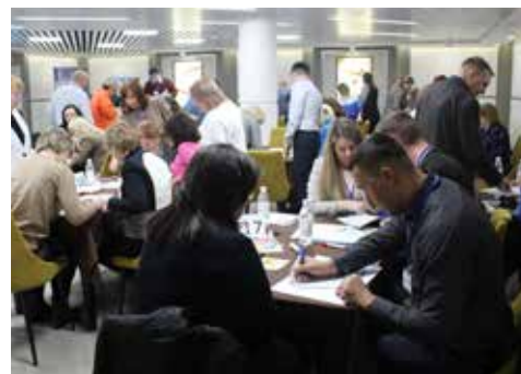
Игра Team Picture в разгаре