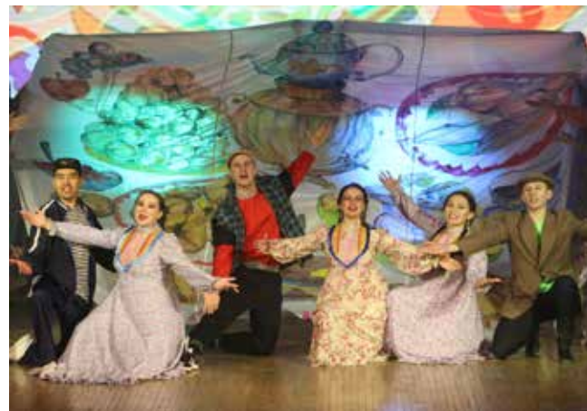
Яркий танец молодёжи автогиганта «Собирайтесь, гости» сорвал аплодисменты

В официальной части на сцену вышел зампреда-