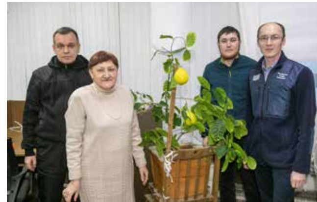
Урожай-2023 — два увесистых лимона — демонстрирует отдел главного конструктора штамповой оснастки ПРЗ

Если в вашем коллективе есть свои традиции, расскажите о них корреспондентам «ВК». А они позаботятся о том, чтобы о них узнали во всех подразделениях «КАМАЗа».