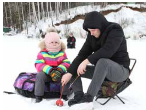
В ожидании рыбки

Зимняя рыбалка начинается с бурения лунки, поэтому оно стало первым