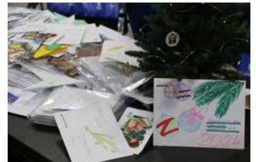
Защитники очень ждут этих посланий