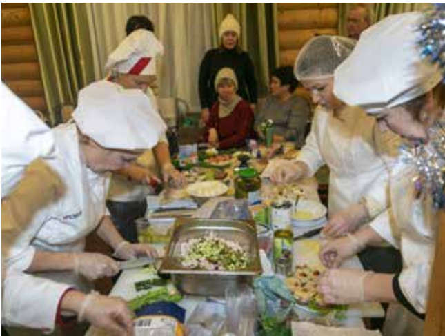
Вот она, командная работа: каждый на своей позиции режет, чистит, украшает

Не знаю, как Пушкин, но когда накрытые столы были представлены взору жюри и гостей, им тут же захотелось всё попробовать! Повара успели воплотить