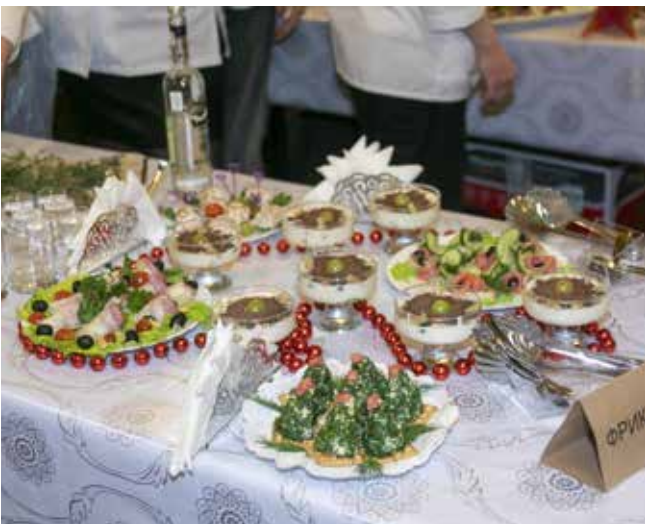
Это угощение от «Фрикаделек» покорило сердца судей

Три десятка работников РИЗа отправились на базу отдыха «Сосновая роща», где отметили День мастера и бригадира. Событие выдалось насыщенным.