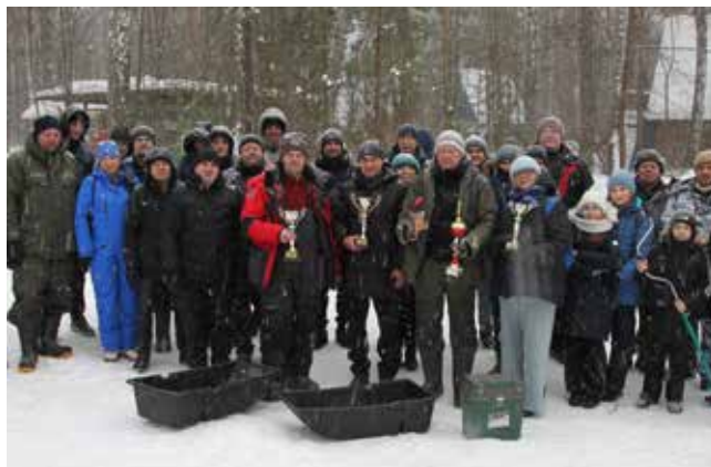
Все победители получили на память кубки и очень нужные подарки: термос, ледянки, ледобур, удочки, фляжки, ящик для зимней рыбалки

испытанием — кто быстрее. Второй ключевой момент — общий вес улова, третий — чья рыбка крупнее. Все эти результаты учитывались в определении трёх призёров.