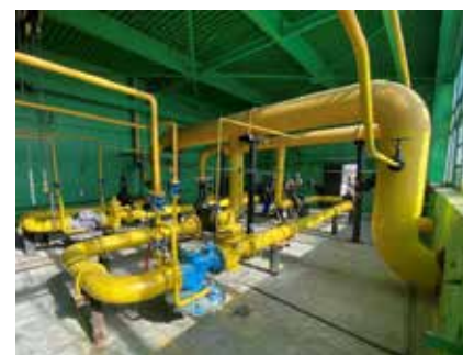
Через главный газорегуляторный пункт подразделения «КАМАЗа» получают необходимый для производства природный газ

— На «КАМАЗе» продолжают работу по реинжинирингу автопроизводства. Будет ли меняться энерге-