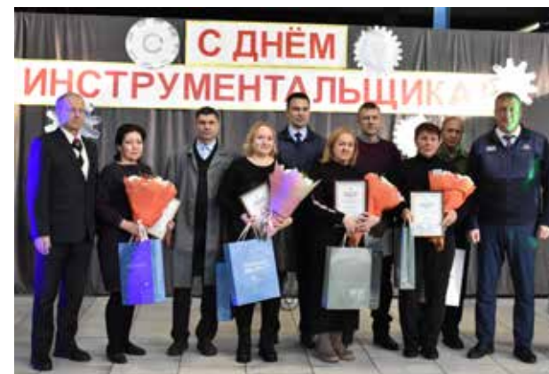
Камазовские инструментальщики всегда готовятся к своему профпразднику

В этот день 20 заводчанам вручили почётные грамоты и благодарственные письма. А за повышение профессиональных компетенций в области управления качеством была отмечена команда из четырёх человек. Награждённым подарили мягкие пледы.