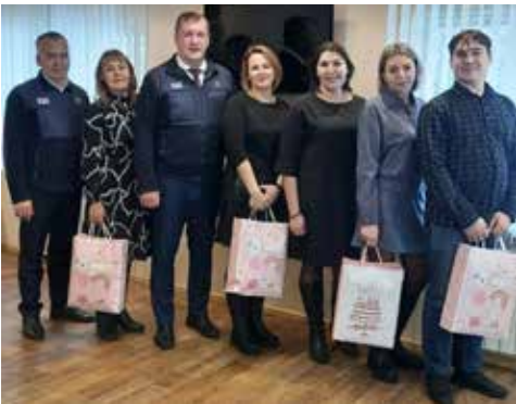
Подарки в этот день вручали лучшим мастерам

Дополнило программу праздника командообразование: инструментальщики пробовали писать левой рукой, пытались договориться друг с другом с помощью воздушных шаров, учились поддерживать своих товарищей в сложных ситуациях.