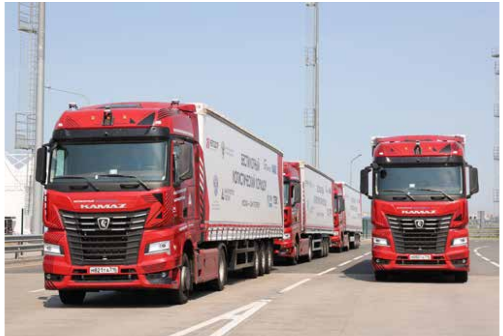
Подготовила Эльвира Галлямова.

Разработаны программы поддержки семей мобилизованных. С большой радостью руководство автогиганта встречает каждого малыша, рождённого у наших бойцов. Не упускаем из виду и детей, приехавших к нам в поисках защиты с Донбасса — для них в спортивно-оздоровительном комплексе «Саулык» были летом организованы лагерные смены.