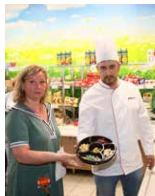
Работники впервые начали предлагать столовым готовить по их вкусу

Нельзя забыть и ещё об одной солидной дате: 29 сентября полувековой юбилей отметила газета «Вести КАМАЗа». Снабжаем информацией с самого рождения автогиганта!