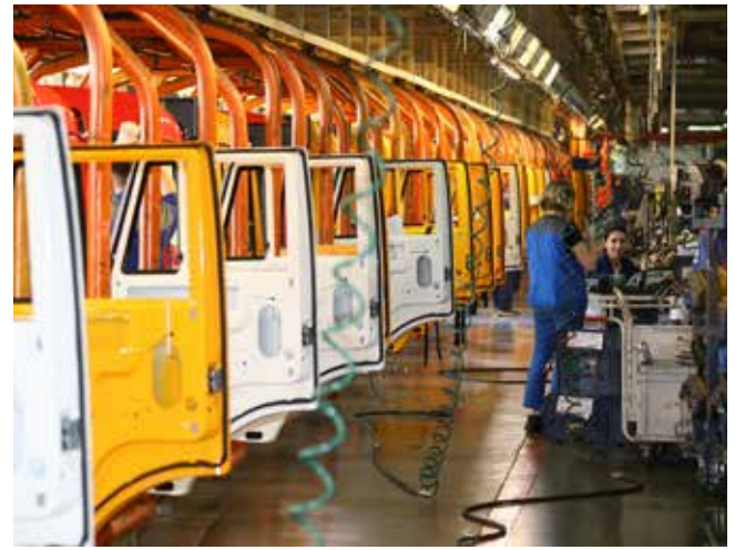
Камазовский конвейер в 2023-м работал на полную мощь