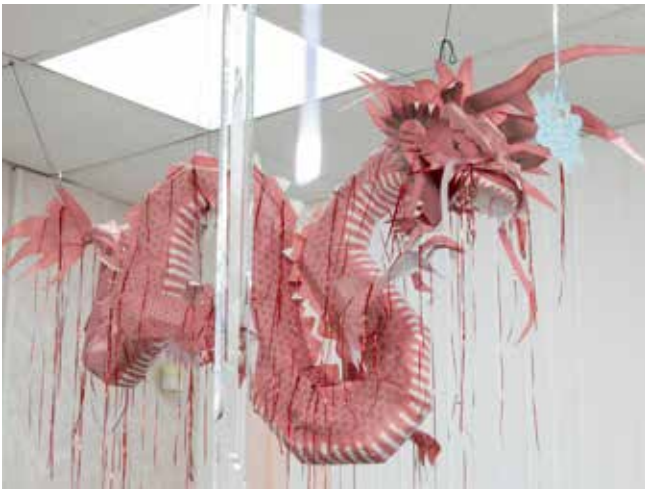
Лиана Гараева вдохновила коллег на изготовление бумажного дракона

— Конечно, эти вещи мы делаем в обеденное время, по 10-15 минут. Подготовил два варианта дракона. Того, что из дерева, недели три