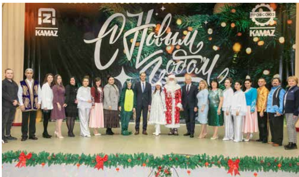
Руководство и артисты постарались, чтобы достойно проводить год 2023-й и встретить новый

на праздник с мешком подарков за спиной, но... без Снегурочки. Она из-за санкций застряла где-то на Гаити, так что волшебнику надо было срочно найти временную замену.