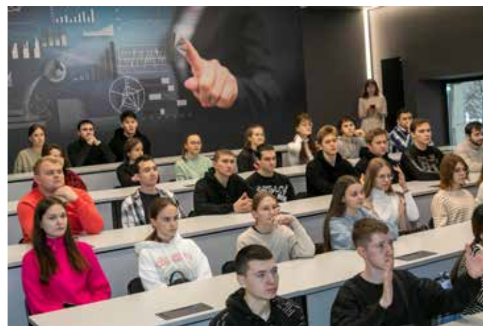
Новая аудитория даст студентам-экономистам хороший старт в развитии

Открытие аудитории стало очередным шагом в рам-