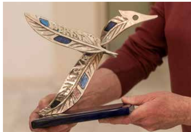
«Перо Синей птицы» залетело и в Набережные Челны

Закрытие фестиваля «Серенада уходящему году» состоится 28 декабря. Ещё есть возможность попасть на концерт, который настроит на правильную встречу самого чудесного праздника.