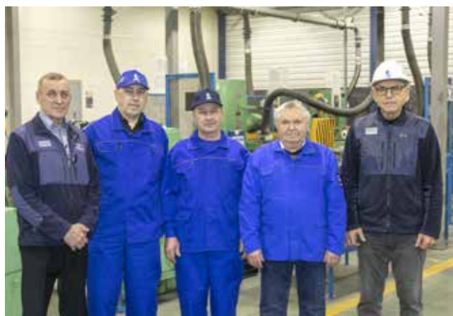
Работники ИО-5 победили в пяти из 10 номинаций в конкурсе «Лидер PSK» за третий квартал