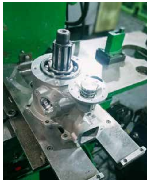
...и изобрённый им выдвижной стол позволяет работать быстро и качественно

Статус «Лучший эталонный офисный участок» в первой группе получил кабинет технологического отдела обработки металла давлением кузнечного завода (№ 305 АБК-209), в третьей группе — кабинет