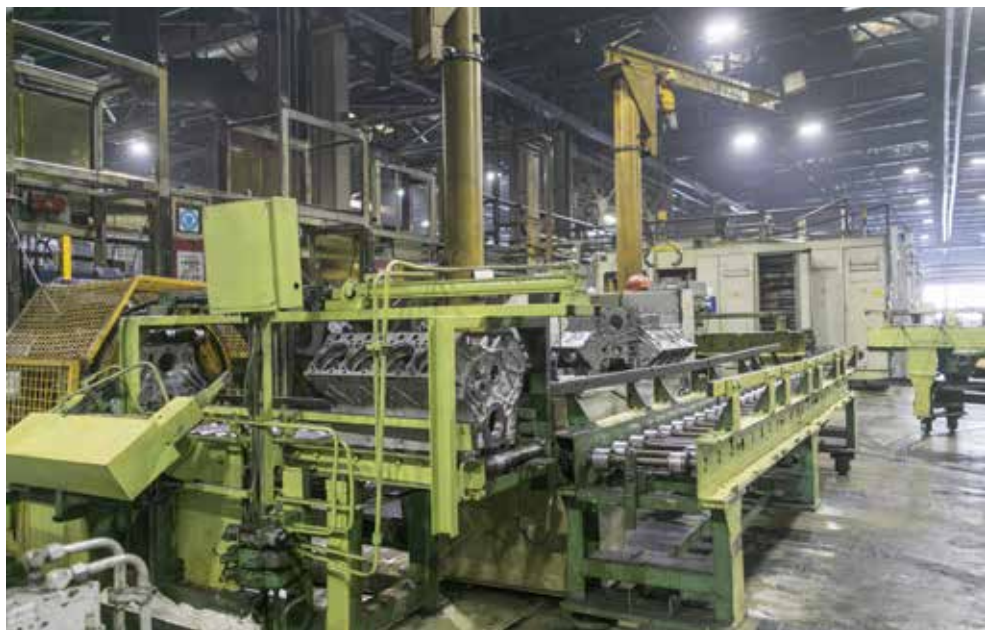
Ритмичность обработки блока цилиндра во многом зависит от функционирования транспортной системы