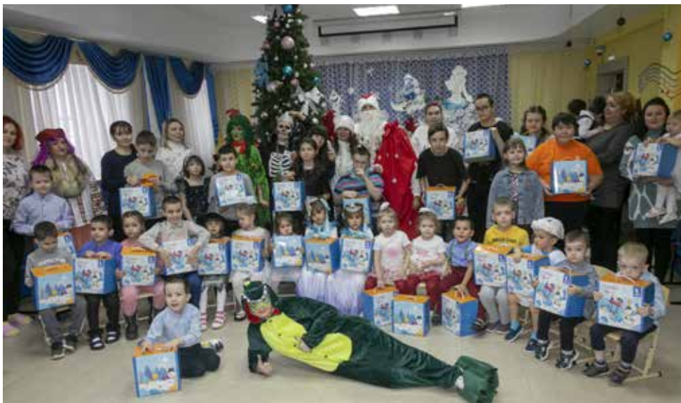
Сказочные персонажи с удовольствием фотографировались с главными виновниками торжества

Сейчас в реакцентре «Солнышко» для детей и подростков с ограниченными возможностями проходят реабилитацию больше 50 де-