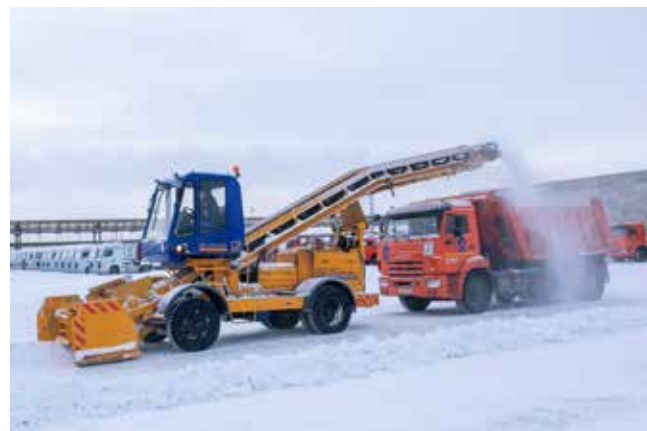
В этом сезоне вывезено уже 15 тыс. кубов снега

Всё будет готово к февралю 2024 года — тогда же и КИМ приедет с завода-изготовителя. А на освободившейся машине в цехе 103 будут измерять детали для двигателя V8. Сплошные плюсы от обновки, как ни крути!