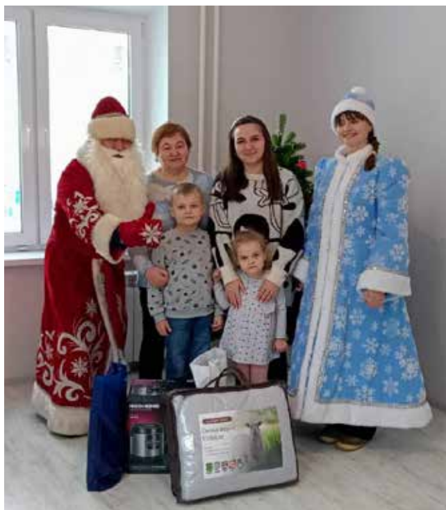
Дед Мороз и Снегурочка оказались щедры и приветливы к людям, приехавшим издалека