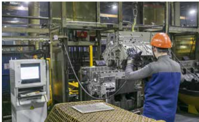
Оператор загружает узел в грузоподъёмную систему HECKERT

Отладка обновлённого оборудования началась 7 января, и с начала рабочей недели транспортная система работает без сбоев.