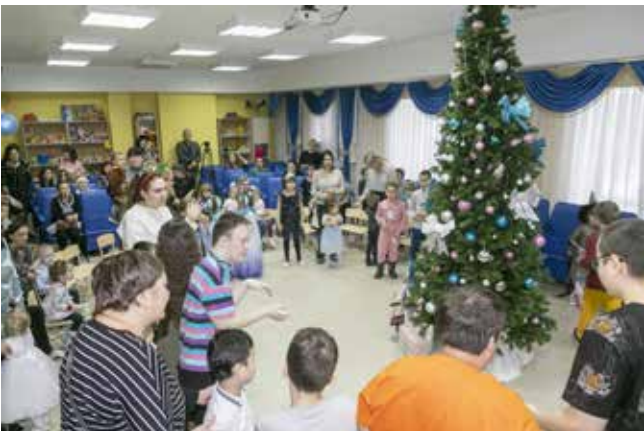
Воспитанники «Солнышка» водили весёлые хороводы вокруг наряженной ёлочки

Самые нетерпеливые детишки открывали коробочки на месте. Они делились сладостями со своими родителями и окружающими. Помимо конфет, воспитанники «Солнышка» обнаружили мягкую подушку-подголовник в виде дракончика и интеллектуальную викторину «Правда — ложь».