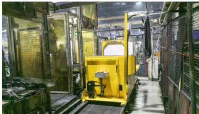
На новой тележке основная деталь двигателя будет вовремя доставлена на каждый из пяти обрабатывающих центров