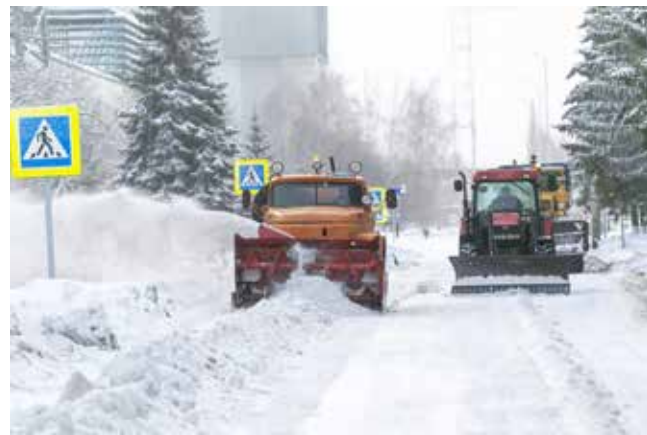
Ноу-хау нынешнего сезона — уборка снега методом перегона

— Для вывоза снега организовано две свалки: одна находится внутри автопроизводства и согласована с