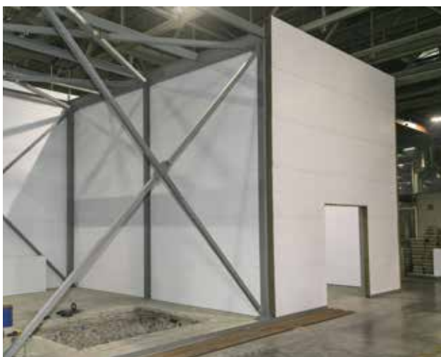
Вскоре здесь появится новая контрольно-измерительная машина

Напоследок интересно, нет ли нареканий по содержанию дорог, на что Рамиль Азизов ответил, что они работают по графику на опережение, а если вдруг поступает заявка, реагируют оперативно, спецтехники достаточно.