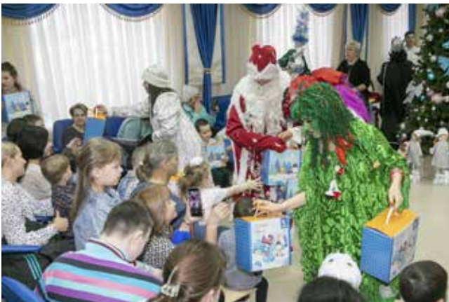
Модная Кикимора прихватила с собой телефон, чтобы поселиться с детишками