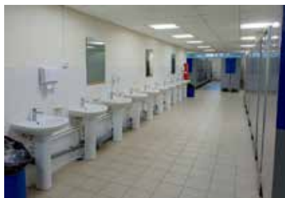
В отремонтированной раздевалке чистота и порядок

Нашлось место в раздевалке и для аккуратных столиков, цветов, создающих атмосферу уюта, есть фены для сушки волос. А на зеркале, в которое дамы смотрят перед выходом в производственный корпус, напоминание: «Безопасность начинается с меня».