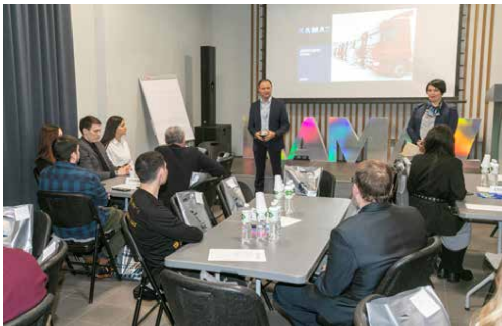
Долгожданная встреча активистов из разных подразделений компании. Вот и познакомились!