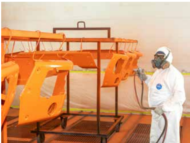
В новой камере детали каркаса и красят, и сушат

Систему управления новой камеры после обучения у заместителя начальника цеха по технической части быстро освоили и маляры, и дефектовщики, работающие в ней.