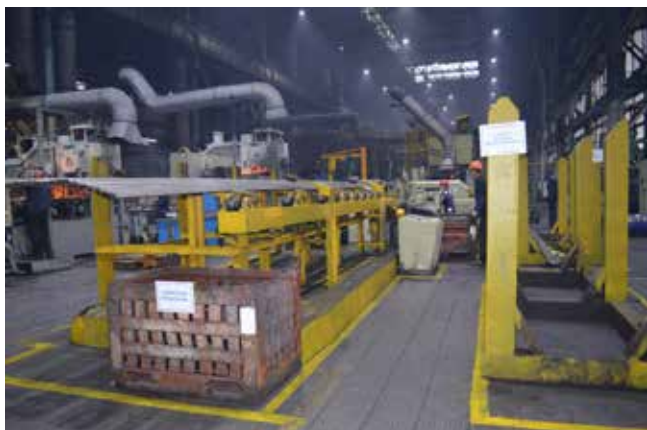
Участок линии малой стремянки. Здесь убрано всё лишнее, устранены подтёки на оборудовании, верстаки приведены в порядок, определено и околтурено место для хранения штамповой оснастки

Наиболее популярными оказались вопросы о субсидии Минпромторга РФ, а также наличии автотехники КАМАЗ и стоимости грузовиков. Кроме того, лизингополучатели уточняли условия покупки техники с пробегом. В период с января по ноябрь пользовались спросом магистральные тягачи КАМАЗ-54901, автомобили КАМАЗ «Компас», прицепы, седельные тягачи КАМАЗ-5490 и среднетоннажные грузовики КАМАЗ-4308.