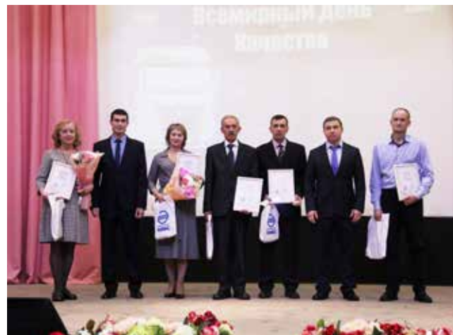
Первые обладатели новой награды «Отличник качества»

Есть объективные показатели, которые измеряются в цифрах. Например, по сравнению с 2022 годом, количество рекламационных дефектов на 100 автомобилей по результатам трёх месяцев эксплуатации снизилось: по автобусам на 74,8%, по электробусам — на 60,3%, по автомобилям серии К3 — на 10,4%. В рамках улучшения качества производства автомобилей коэффициент