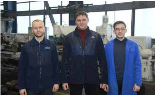
Участникам молодёжного проекта удалось решить проблему, из-за которой производство несколько лет несло потери

В команду проекта были включены инженеры технологического, конструкторского отделов, отдела моделирования технологий, руководители, специалисты и работники КПК-3 (именно там производится полуось), имеющие необходимый опыт для реализации про-