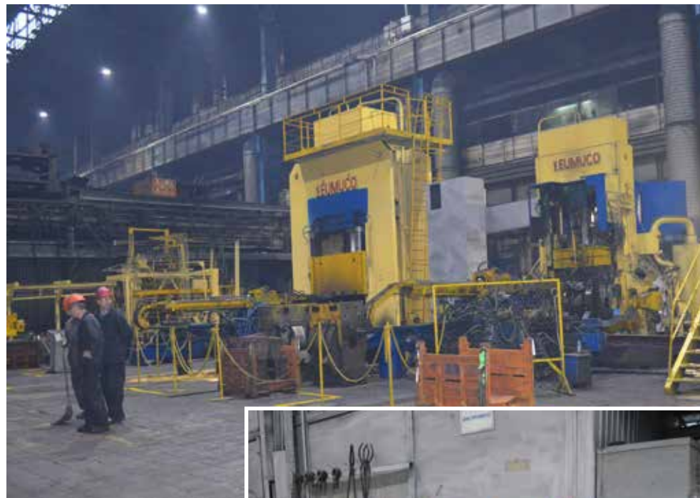
Порядок на участке № 1 виден невооружённым глазом: в этом заслуга всех, кто трудится здесь

— Самое тяжёлое, конечно, было привести в должный вид оборудование, — рассказывает Артур Каримгулов. — Подтёки мы устраняли совместно с ЦРиООК-3, наводили порядок. По нашей заявке были закуплены стеллажи, в них мы разложили инструменты по системе 5S,