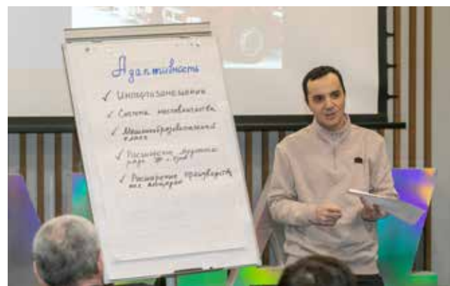
В каждой камазовской ценности всегда можно найти что-то своё