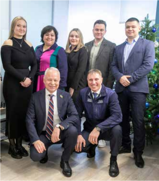
Получив напутствие от Владимира Курганова и Ильдара Шамилова, «Нелогичные» пообещали достойно выступить в Сочи

Зимний КиВиН традиционно разыгрывается в Сочи и имеет статус международ-