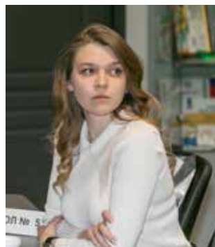
Активные, вовлечённые и харизматичные — такие люди украшают камазовские баннеры