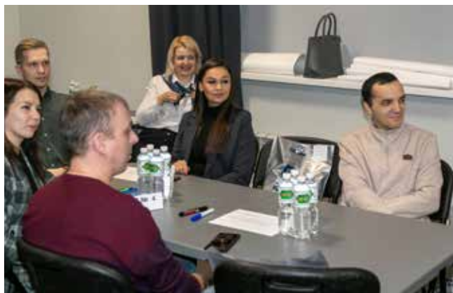
Будущий проект «Амбассадоры компании» очень заинтересовал слушателей

После такого информативного выступления активисты поговорили о корпоративных ценностях и преимуществах «КАМАЗа» — в командах они расписывали, что значит для них каждая ценность, как её применить на рабочих местах. Встреча прошла продуктивно!