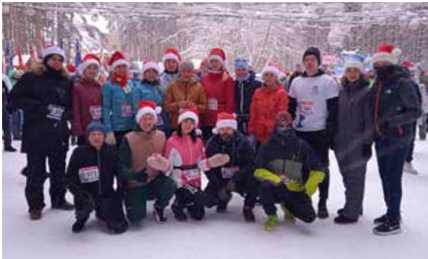
«Железный Варяг» окрыляет!

Но для всех участников самая главная победа — открыть в себе новый навык и зарядиться на успех! «Очень крутой старт получился», «Клёво, что трасса перенеслась в лес», «Холмистая трасса не даёт заскучать и быстро пробегается», — отзывались участники.