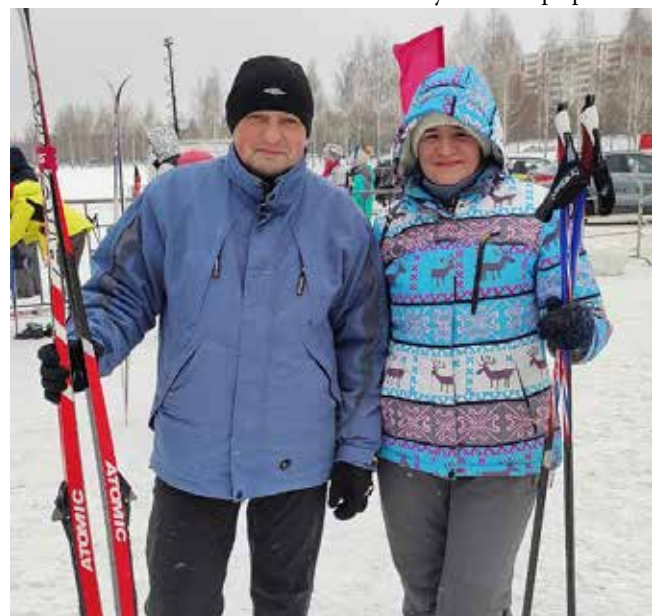
Председатель профкома КЗ и сам активно участвует в соревнованиях