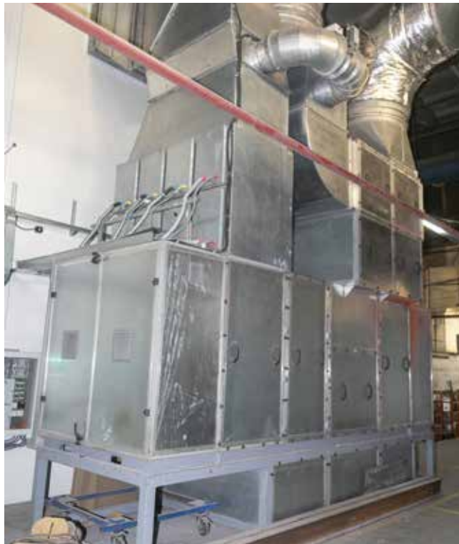
Мощная вентиляция эффективно очищает воздух

Ежедневно с октября здесь окрашиваются порядка 40-60 позиций деталей оперения, платформы. Оборудование работает безупречно. Со временем загрузка этого агрегата будет увеличиваться.