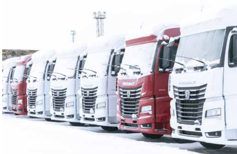
Задача на 2024 год — обеспечить качество перспективных автомобилей К5

Как показал анализ, основными причинами низкого уровня реализации отдельных целей в области качества являются нестабильное качество комплектующих изделий, низкая эффективность взаимодействия подразделений на функциональном уровне, низкая вовлечённость персонала в деятельность по повышению качества выпускаемой продукции. Поэтому в программе дальнейшего совершенствования качества продукции и услуг в 2024 году предстоит решать задачи с приоритетом в отношении перспективных автомобилей К5, отвечающих требованиям потребителей.