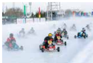
Ни лёд, ни снег им не помеха

«КАМАЗа» и республики — это инвестиции не только в спорт, но и в безопасность дорожного движения.