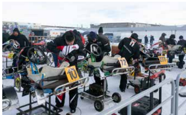
Грамотная подготовка болида к старту — один из факторов успеха

поддерживали и переживали за своих любимчиков: «Газу, газу!», «Аккуратнее на поворотах», «Поднажми!», «Руль крепче держи», — доносились с трибун подсказки. В гуле движков над картодромом расслышать что-то было невозможно, но спортсмены знали своё дело. Глядя на них, понимаешь: профи!