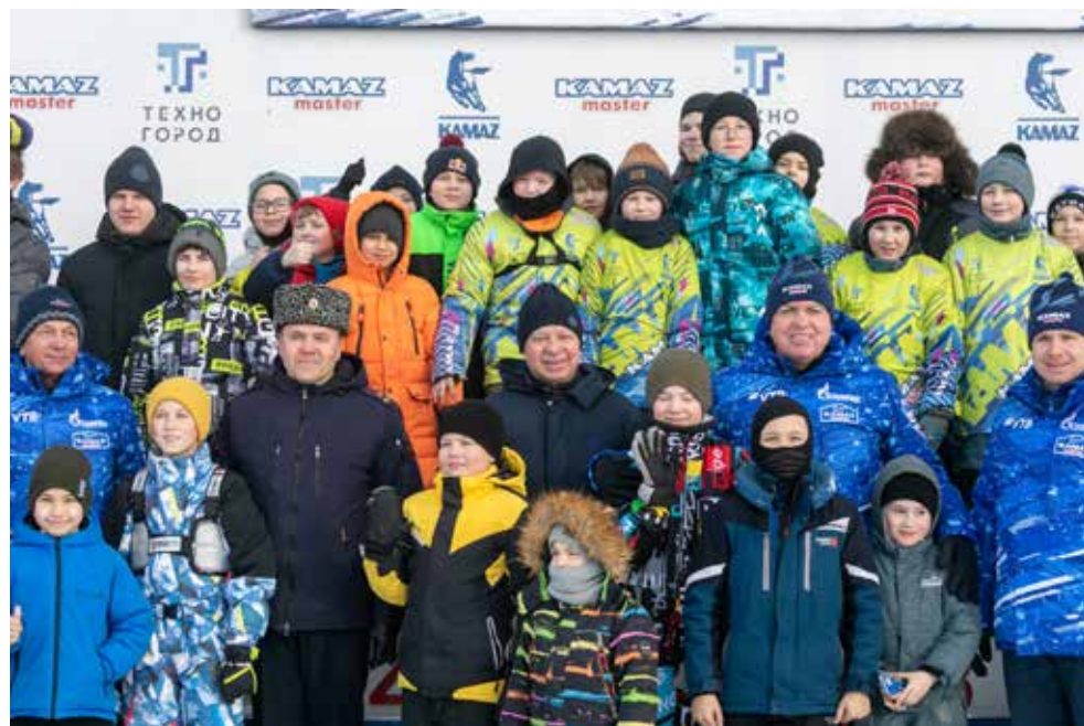
Перед стартом картингисты сделали фото с почётными гостями

— Сейчас вы мастерски управляете маленькими автомобилями, а когда вырастаете, получите водительские права. Благодаря вашим навыкам на дорогах страны будет безопаснее. Поэтому такое внимание со стороны