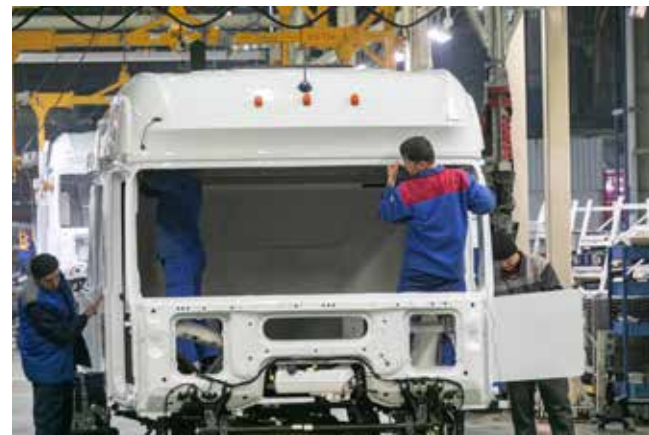
На конвейере есть всё необходимое для сборки кабины

— Один из критериев отбора поставщиков — обязательная способность обеспечения всех наших заказов. Резервов хватает.