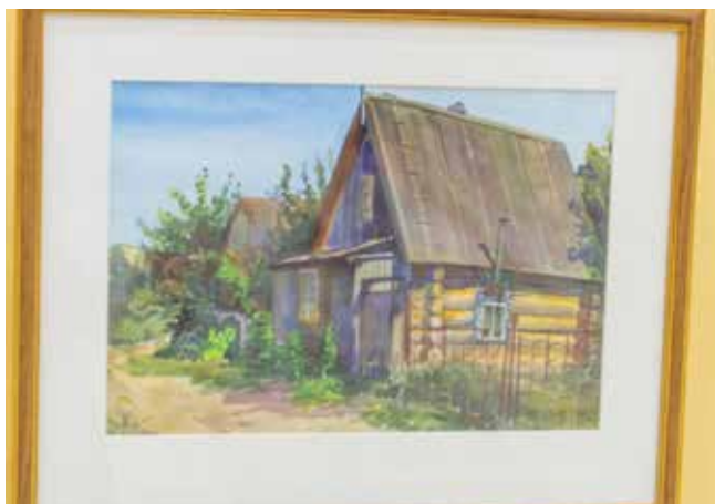
Работа «Дом нашего дедушки» находит отклик в душе каждого

Ну а если хочется познакомиться с художницей поближе, приходите на официальное открытие 8 февраля в 14.00.