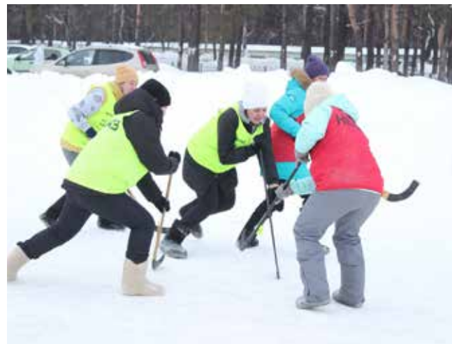
Накал страстей и азарт борьбы в валенках ничуть не меньше

Сменив коньки на валенки, ледовый корт на снежный, а шайбу на мяч для игры в большой теннис, клюшки скрестили семь женских команд и восемь мужских. Игры проходили по олимпийской системе. В итоге среди мужчин в лидеры вышли работники цеха № 35, на втором месте оказался цех № 36, на третьем — цех № 6. Среди женщин победили сотрудницы ООТиЗ, им уступили «хоккеистки» из службы главного инженера и цеха № 7. Отдельной на-