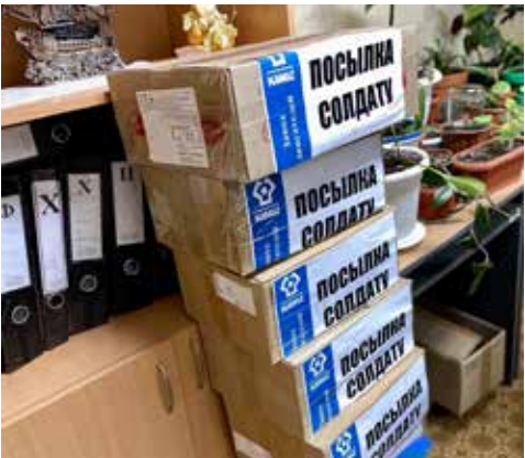
Накануне праздника эти посылки получат наши ребята в зоне СВО

Свой привет отправили в зону СВО сотрудники АвЗ. При поддержке профкома заводчане и их дети приняли участие в традиционной акции «Восточка надежды», за два дня они написали 105 писем. В каждой строке — слова поддержки, благодарности и признательности за преданность и смелость. А ещё детские рисунки с пожеланиями здоровья и поздравлениями с Днём защитника Отечества.