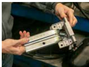
Петля дверцы вещевого ящика кажется простой только на первый взгляд

— Наша группа должна была обеспечить поставку на конвейер 135 комплектующих изделий, и сделать это