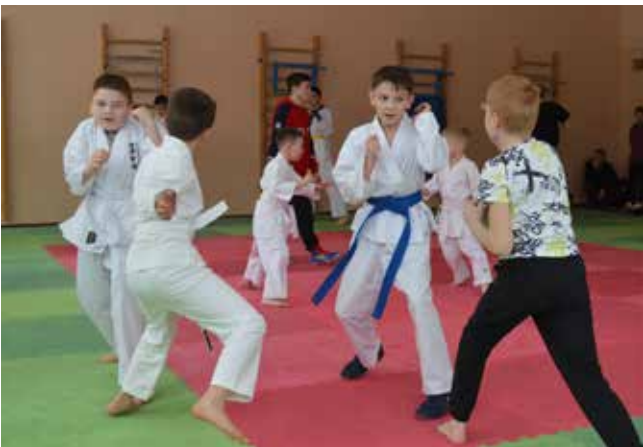
В спаррингах оттачивается мастерство

* Кобудо — одна из методик тренировки в карате-до, японской системе самозащиты. Она учит, как противостоять одному или нескольким вооружённым противникам с помощью различных видов холодного оружия или без него.