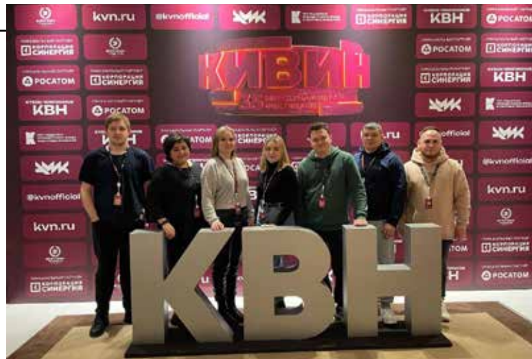
Кавээнщики из логистического центра были заряжены на победу

Повышенный рейтинг позволяет участвовать на официальном