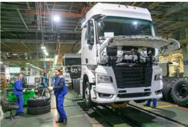
На АвЗ многое делается для того, чтобы сборка большегрузов шла быстрее

Работа по расшивке узких мест ведётся и на автосборочном производстве. Ещё недавно ход ГСК-2 тормозила установка кабины на автомобили поколения К5. Сократить длительность операции в четыре раза удалось за счёт доработки стоек конвейера, приспособлений для центрирования рамы, внедрения заходной фаски и специального рычага.