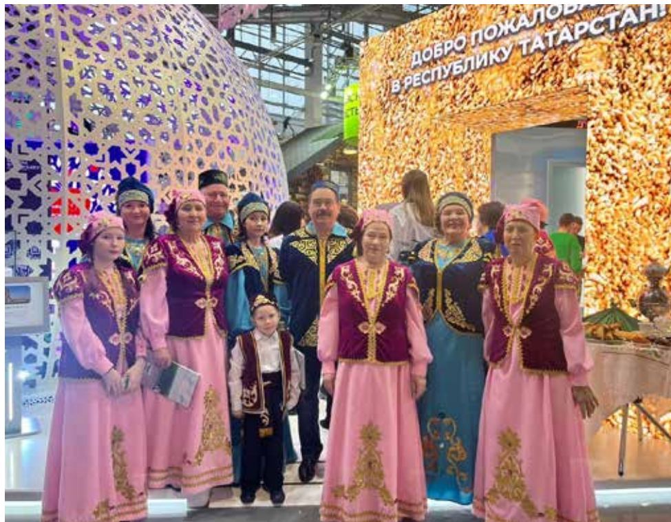
Камазовская династия — одна из немногих семей, кто предстал на форуме в национальных костюмах

— Организаторы форума составили команды из семей, в нашей было четыре. Соответственно, мы больше общались с семьями внутри команды. Каждый день с