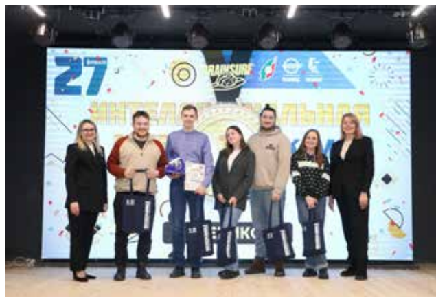
Команда «Феникс» не теряет марки — открыла победой череду игр, посвящённых 55-летию «КАМАЗа»

Как обещают организаторы, впереди ещё несколько не менее интересных квиз-игр, посвящённых 55-летию «КАМАЗа».