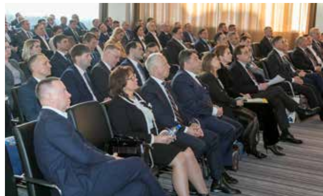
Бизнес-сессии топ-менеджмента «КАМАЗа» станут регулярными