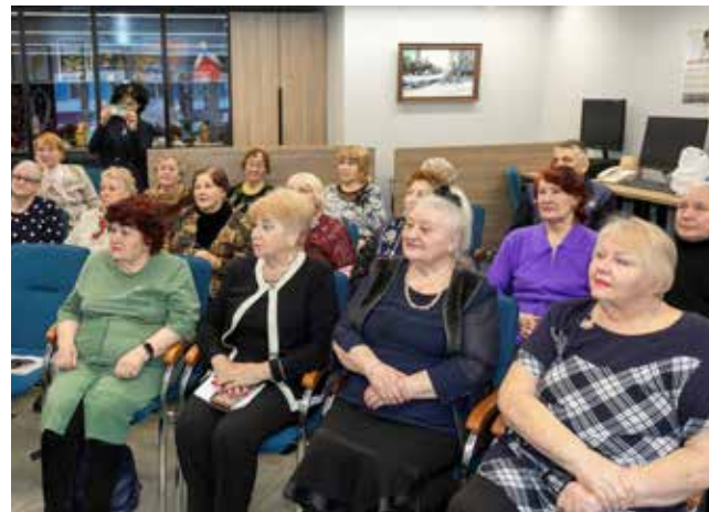
Рассказы бойца СВО с позывным «Болгарин» впечатлили публику и укрепили веру в победу