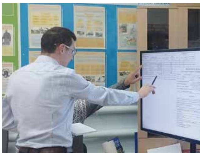
Уполномоченный по охране труда должен уметь предупреждать нарушения и работать с документацией

ния требований ОТ регламентирована для каждого работника.