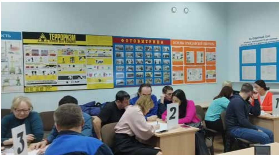
Участникам тренинга предоставили возможность самим оценить свою работу

— Дайте оценку проведённому тренингу. Был ли он полезен для участников?