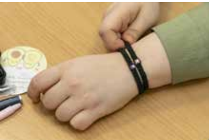
Её рукам подвластна и игра на гитаре, и плетение браслетиков