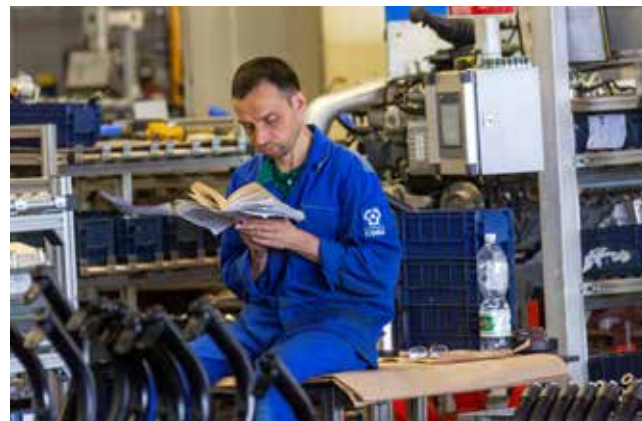
Повысить финансовую грамотность можно и между делом — поможет специализированная литература