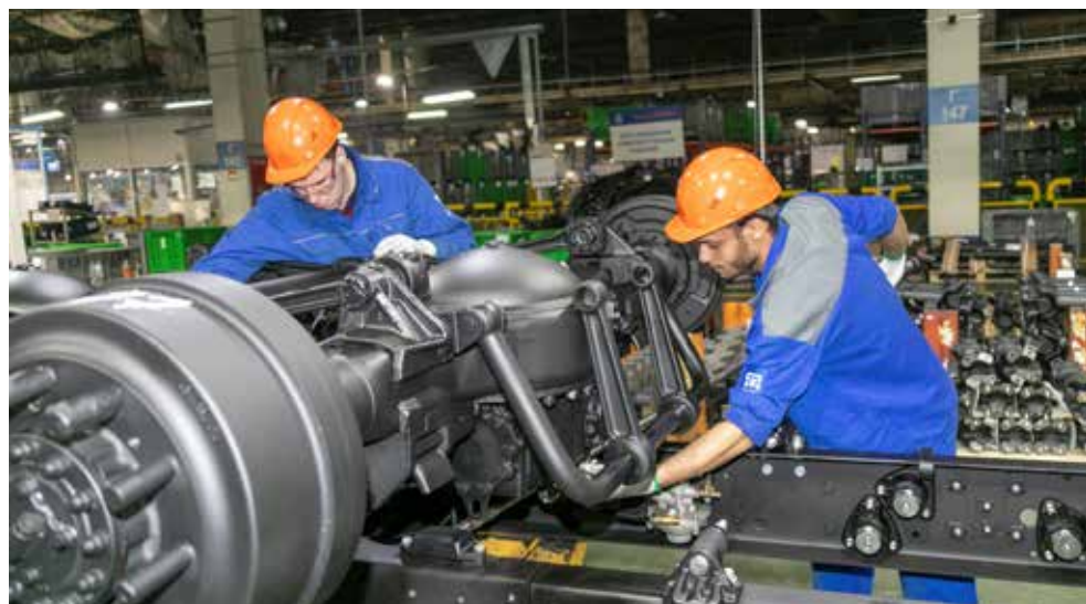
Молодой человек, работая на конвейере, ловко управляется с установкой балансирной подвески

— Создание семьи — дело серьёзное, торопиться тут нельзя. Но если встречу хорошую девушку, сделаю предложение. Национальность значения не имеет, главное — понимать друг друга, жить в согласии, — рассуждает молодой человек. — Постепенно всё образуется, было бы желание идти вперёд. Так здесь говорят.