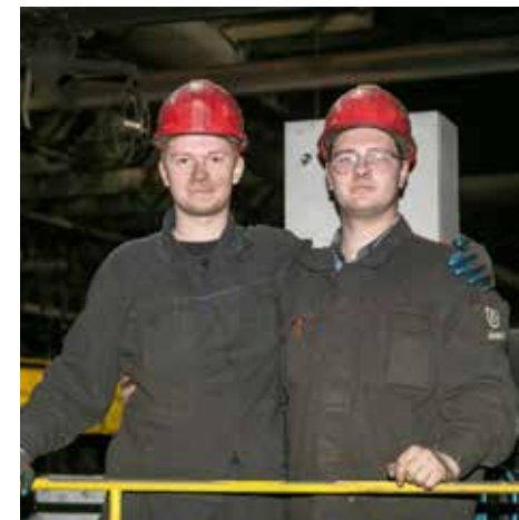
Молодые электромонтёры считают литейный завод подходящим местом для практики

Особых трудностей поставленные перед практикантами цели у них не вы-