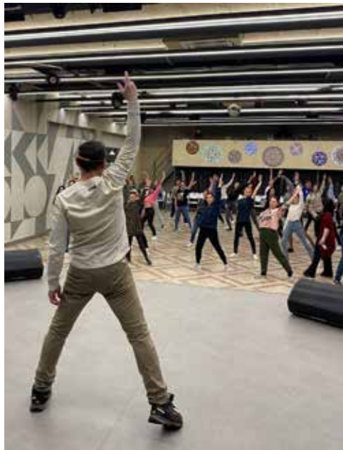
Камазовцы старательно повторяли каждое движение за хореографом

Кастинг продлился два часа. По словам Лидии, на этом отбор не заканчивается, ведь ещё осталась вторая половина заявившихся.