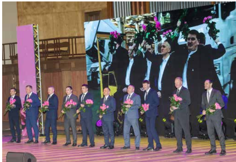
Когда счастья желают ТАКИЕ мужчины, трудно не растаять

Но даже если цветочная волна до кого-то и не дотянулась, не беда: ведь впереди ещё приятные моменты и награждения. С тёплыми словами перед камазовскими дамами выступили первый зам гендиректора