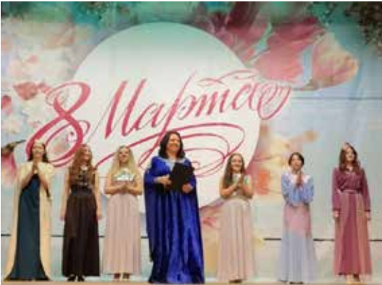
Женщина дарит тепло, заботу, а к празднику ещё и любимые песни

Конечно же, концерт состоялся, и в нём на радость зрителям любимые песни исполнили и солисты, и солистки. Ведь когда мы вместе, мы сильнее!