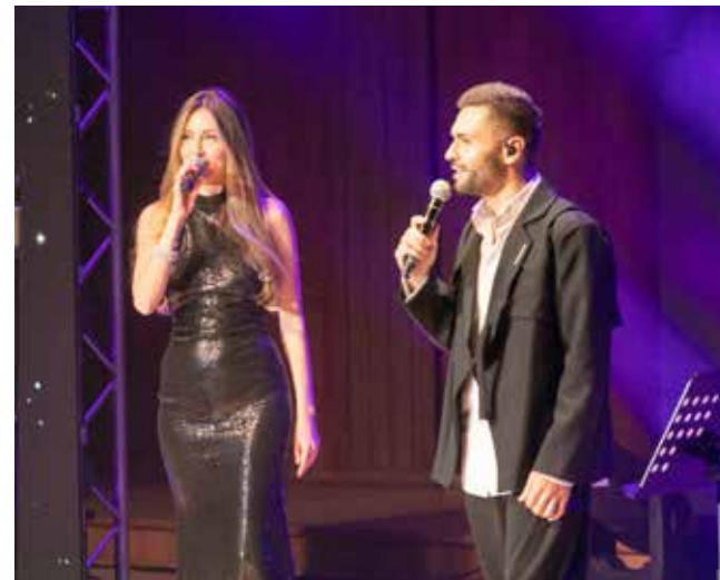
Красивые молодые артисты, страстные песни о любви... Весна началась!