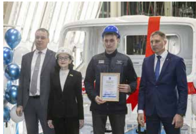
Вручение наград на митинге — событие особенное