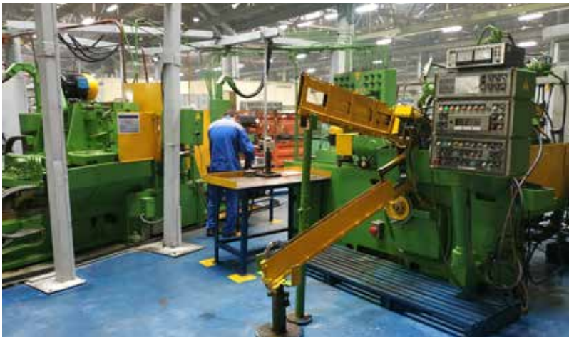
Получение статуса эталона теперь разбито на этапы

— В этом году мы планируем применить его пока только к производственным участкам, рассчитываем на 60 эталонных участков. В дальнейшем будем тиражировать на офисы, цеха и заводы.