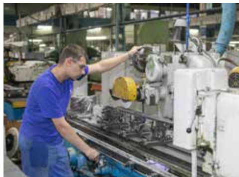
Все потребности «КАМАЗа» в инструменте старается обеспечить РИЗ

По итогу обхода подразделение набрало 33 балла — это второй результат после ЗЗЧИК.