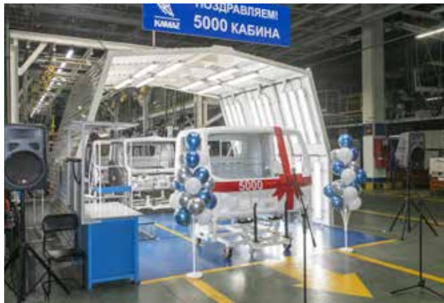
Вот он, юбилейный каркас кабины «Компас»!

Памятная фотография, сделанная на площадке в день митинга, наверняка станет для участников этого события семейной реликвией. А впереди у заводчан новые задачи в реализации проектов по освоению выпуска новой продукции.