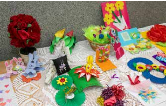
Яркие поделки и красочные открытки очаровали литейщиц

Творческий коллектив литейного завода подарил песни «Как много девушек хороших» Леонида Утёсова, «Шопен» Елены Ваенги, «Очарована, околдована»