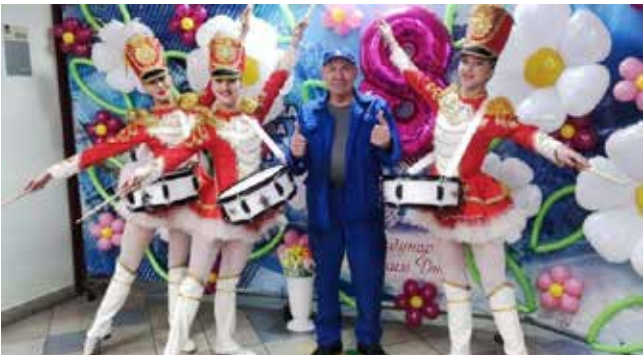
Девушки, словно с плаката, зарядили заводчан радостью на целый день

А в обед всех заводчан ждали в столовой, где для них подготовили угощение: блинчики со стущённым молоком. Со всеми желающими и рецептиком поделились — чтобы вкусняшку можно было и дома приготовить.