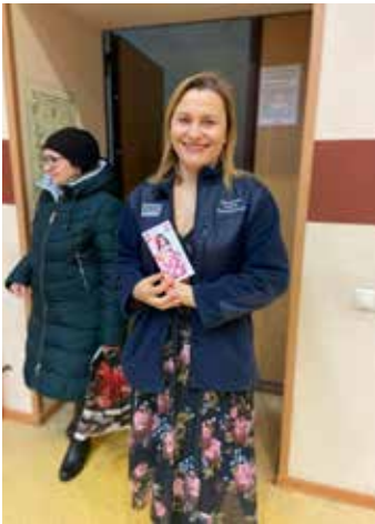
Сладкие подарки любят все!