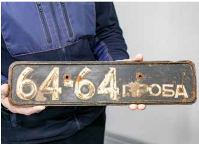
Этот номерной знак — большая редкость, а значит, и ценность для музея «КАМАЗа»

— Такие номерные знаки — большая редкость! Судя по цифрам 64-64, он крепился к одному из автомобилей, который был собран сразу после пуска главного конвейера на АвЗ. На фотографиях КАМАЗов, отправленных после ми-