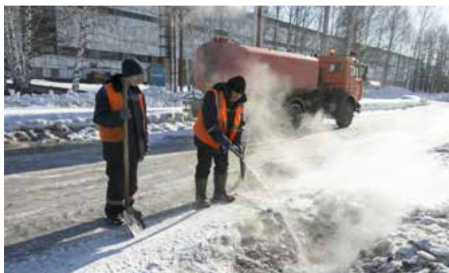
...а потом рабочие проливают колодец горячей водой температурой 80 градусов