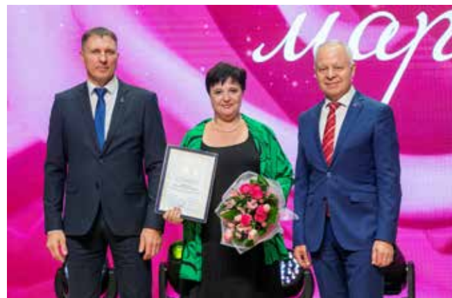
За достижение высоких производственных показателей в работе и многолетний добросовестный труд лучшие из лучших были удостоены почётных грамот ПАО «КАМАЗ»

И сладкого — но об этом позаботились организаторы вечера, так что без подаренной на выходе шоколадки не ушла ни одна гостья.