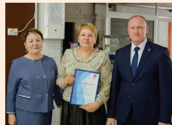
Лучшим награды от директора

В честь юбилея отдела заводской комбинат питания изготовил красивые праздничные торты. Каждому из собравшихся достался кусочек вкусного угощения. Также для всех работников отдела главного технолога профком приготовил подарки — сертификаты на поход в кинотеатр на две персоны.