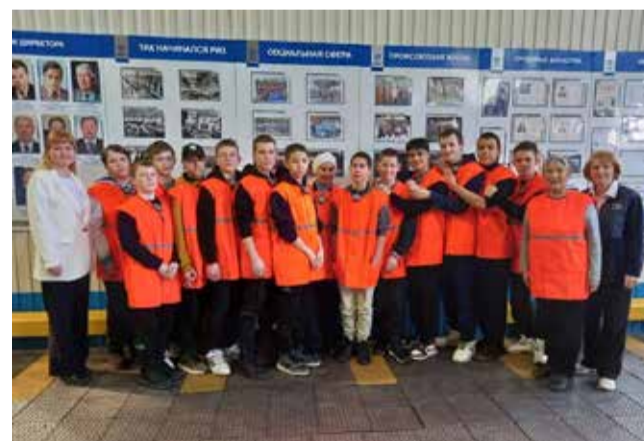
Школьники тепло поблагодарили ризовцев за познавательную экскурсию

Ребята ещё ни разу не были на предприятии, поэтому с нескрываемым любопытством разглядывали оборудование и инструмент, который выпускает завод, и очень внимательно слушали экскурсовода. Будущие выпускники узнали, какие условия и программы есть на «КАМАЗе» для молодёжи. К примеру, им пришлось по душе идея одновременно обучаться и работать на заводе.