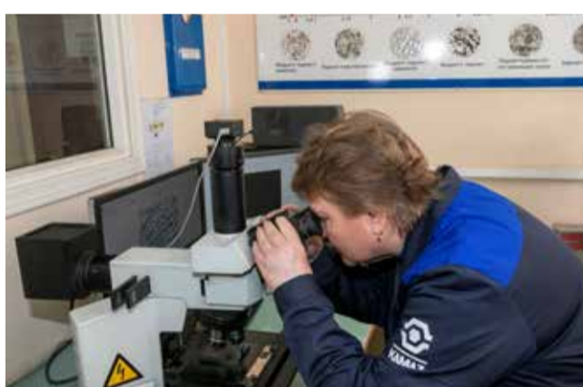
Опытный лаборант не пропустит дефект

— У каждой марки стали своя температура нагрева и охлаждения, — комментирует она. — Потом шлифуем на станке и проверяем методом Роквелла. В ГОСТах прописаны точки, на которых мы должны проверять твёрдость. Кстати, мы единственная ла-