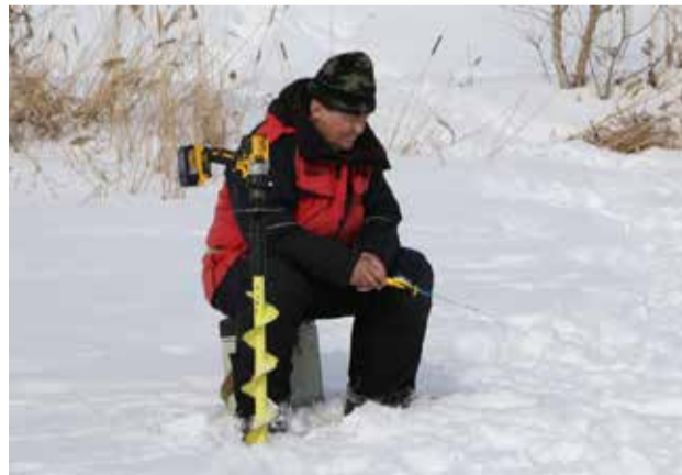
Правильный выбор места для лунки — один из главных факторов удачной рыбалки