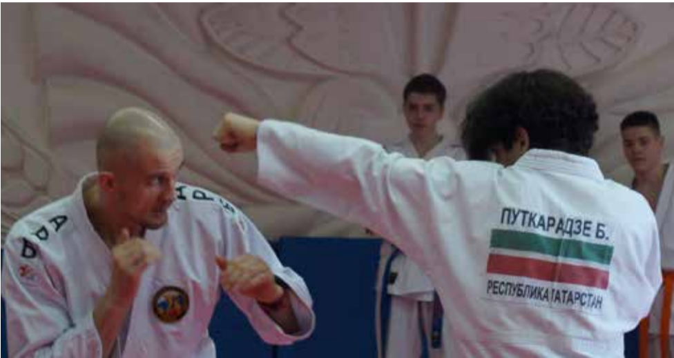
Мастер-класс от трёхкратного чемпиона мира по самбо — настоящий подарок для ценителей рукопашного боя