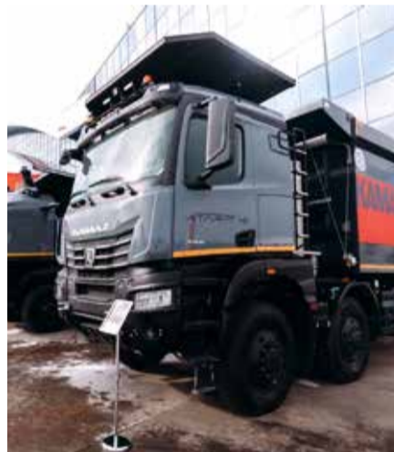
Камазовские «Атланты» притягивают взгляд

стью, сниженными лизинговыми платежами в начале графика и возможностью уменьшения суммы договора лизинга при снижении ключевой ставки Банком России. Также партнёрам предлагается оформить автотехнику КАМАЗ в лизинг по программе «Лизинг «Юбилейный» с нулевым авансом. Доступно и предложение «Лизинг на 7 лет» с увеличенным сроком лизинга.