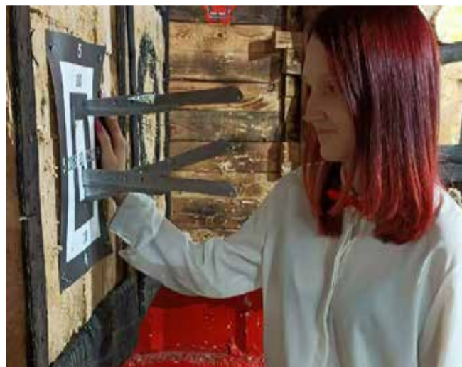
Освоила девушка и судейство в соревнованиях

А ещё она на танцы ходит и дизайн изучает... Но это, как говорится, уже совсем другая история.