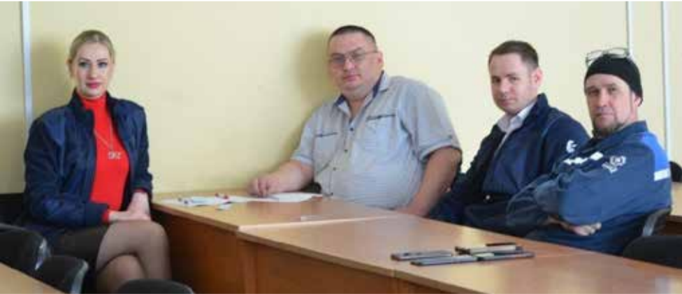
«Республика ШИК» сражалась уверенно, красиво — и заняла первое место

Участники предложили интересное новшество — следующую игру для интеллектуалов готовит команда-победитель. Посмотрим, найдёт ли идея своё воплощение в апреле.