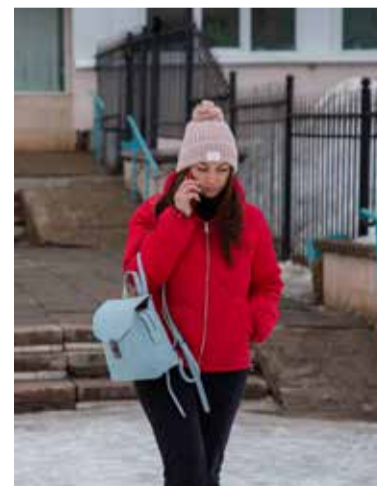
Неожиданный звонок от руководителя? Включите критическое мышление

По всем выявленным случаям мошеннических действий с использованием общедоступных сервисов коммуникации (электронная почта, мессенджеры, телефонные звонки и т.д.) в отношении сотрудников компании незамедлительно сообщайте на sb@kamaz.ru (в глобальном списке адресов «Блок безопасности ПАО «КАМАЗ») с указанием всех обстоятельств инцидента.