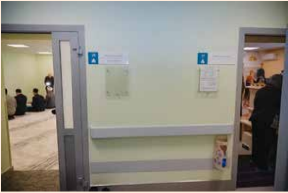
Слева — комната для мусульман, справа — для православных

«Обратите внимание: комнаты находятся рядом. Это отличная черта Татарстана — сохранять межрелигиозный мир и спокойствие в обществе», — отметил муфтий Татарстана Камиль хазрат Самигуллин. Также муфтий добавил, что особо радует забота о слабовидящих. Для них установили информационную доску со шрифтом Брайля, что в моленных комнатах встречается редко.