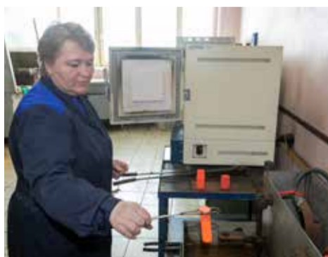
В муфельной печи металл раскаляется докрасна

Напомним, в конце прошлой недели «Челнок» перевёл поездки на микроавтобусах в режим предварительного бронирования. Теперь для поездки на минивэнах пользователям приложения потребуется заранее указать начальную и конечную точки маршрута, а также желаемое время прибытия. Бронь будет доступна за несколько дней, однако для утренних поездок, запланированных с 6 до 8 часов, нужно забронировать автомобиль не позже 23.30 предыдущего дня.