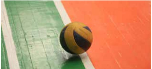
Волейбольные матчи на «КАМАЗе» длятся до двух побед в партиях

Следующие матчи запланированы на 25 марта. «ПЖДТ-Сервис» сразится с литейным заводом, блок продаж и сервиса сыграет с ЗЗЧИК, «РД» померится силой с блоком закупок, а «Челныводоканалу» будет противостоять кузнечный завод.