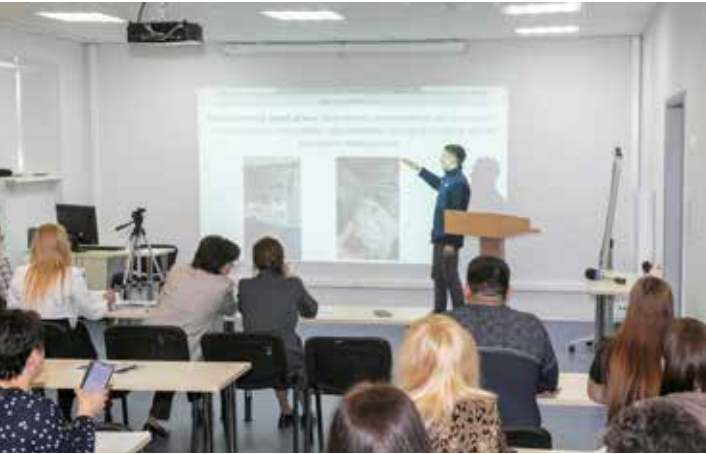
Защиту дипломов прошли 17 мастеров