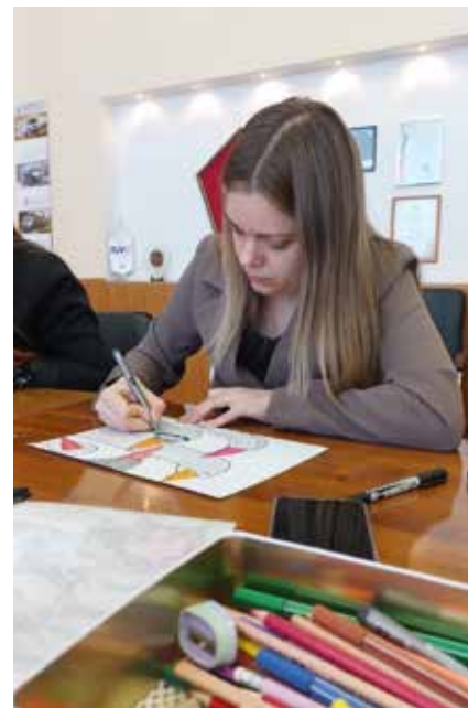
На первом мастер-классе популярностью пользовалась гусятина тема

— Рисование — самый доступный вид творчества, ведь для этого достаточно листа бумаги и простого карандаша. Как говорил Винсент Ван Гог: «Если вы слышите внутри себя голос: «Ты не можешь рисовать», рисуйте во что бы то ни стало, пока голос не стихнет». Для того, чтобы рисовать, не обязательно иметь навыки, главное — получать удовольствие от процесса. Оказывается, у нас на заводе много талантливых людей, которые хорошо рисуют, с богатой фантазией, — де-