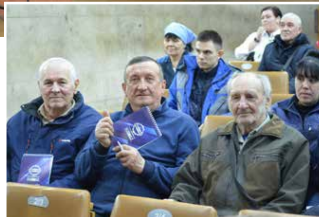
Ветераны ШИКа уже несколько десятилетий остаются членами профсоюза

Директор напомнил, что в призме особого внимания администрации завода остаётся культура производства. «Работа эта каждодневная, и в ней важны все составляющие: чистота в корпусах, чистка и мойка оборудования, качество освещения, технологическая и испол-