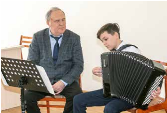
Участники отбора старались показать всё своё мастерство, порой даже играя без нот

Тем временем в малом зале музыкальной школы № 6 звучит скрипка. Преподаватель факультета оркестровых струнных инструментов Центральной