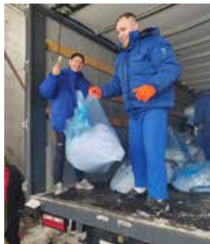
Прежде чем сдать отработанную бумагу, её измельчили в shreddere

Сбор макулатуры — давно сложившаяся традиция среди работников блока развития. Для них сдача бумаги на переработку имеет не только экологическое, но и социальное значение: вырученные средства всегда направляются тем, кто нуждается в помощи. Например, в списке «добрых дел» неоднократно был Дом ребенка, а сейчас помощь оказывается тем, кто находится на переднем крае, — бойцам СВО.