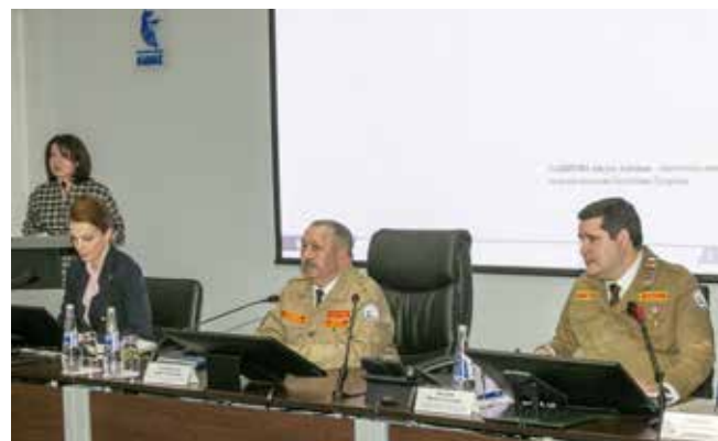
Тема обсуждения острая — кадровый вопрос

Мероприятие прошло в рамках республиканского форума «РОС» «Работа молодым». Помимо него для представителей студотрядов из разных регионов страны (ДНР, ЛНР, Мордовия, Белгородская и Саратовская области и другие) провели экскурсии по четырём заводам «КАМАЗа». А в Молодёжном центре автогиганта обсудили практику трудоустройства производственных отрядов на «КАМАЗ».