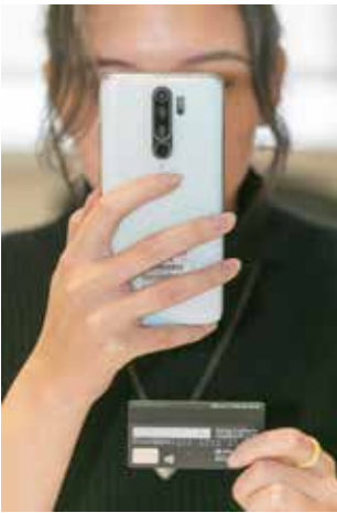
Попасть на удочку мошенников может каждый

Ребёнок должен знать правила и необходимость