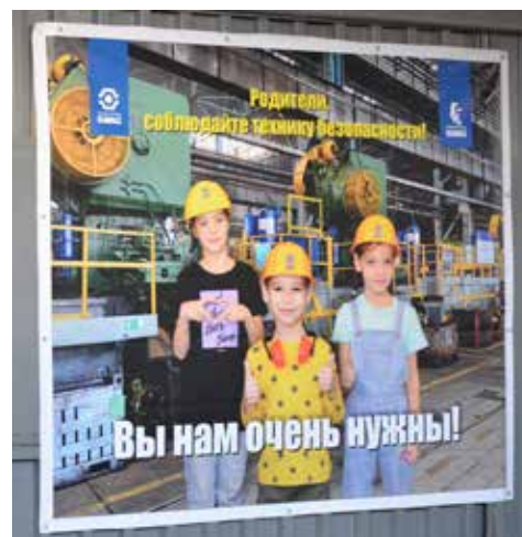
Один из двух баннеров в корпусе рубки металла (КРМ)