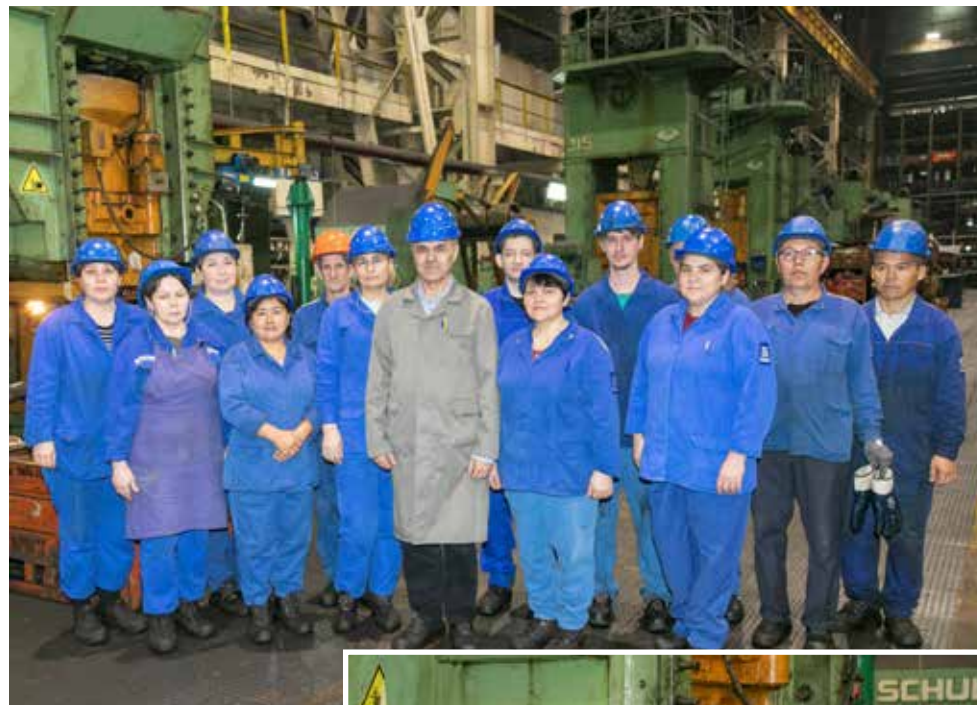
Бригада № 341 — одна из лучших и в прессовом цехе, и на ПРЗ

Поощряются также ответственность, исполнительность, инициативность. Награды за добросовестный многолетний труд здесь