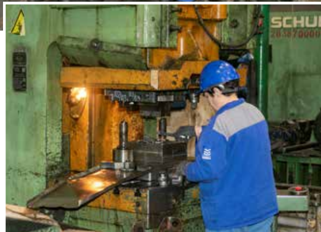
Работа штамповщика, лежащая в основном на женских плечах, требует особого внимания и аккуратности

Чтобы облегчить монотонный труд штамповщицы, мастер и бригадиры практически ежедневно меняют номенклатуру и вес деталей для каждого работника. При таком регулировании и коллективная ответственность возрастает. Новичкам,