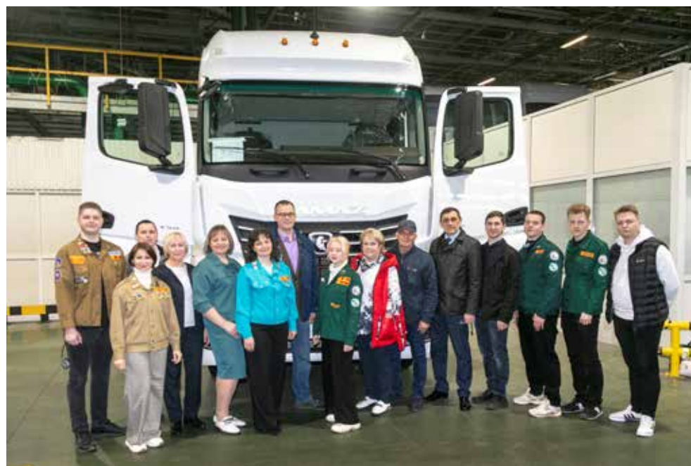
АвЗ — достойная площадка для применения молодых сил

этом всевозможные форматы работы с целевыми аудиториями. Ежегодно профориентационные мероприятия охватывают более 25 тысяч школьников и студентов, ребята проходят практику с последующим трудоустройством, привлекаются и иностранцы.