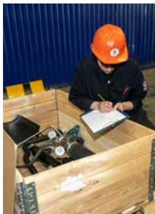
Из тары нужно выбрать всего 10 запчастей