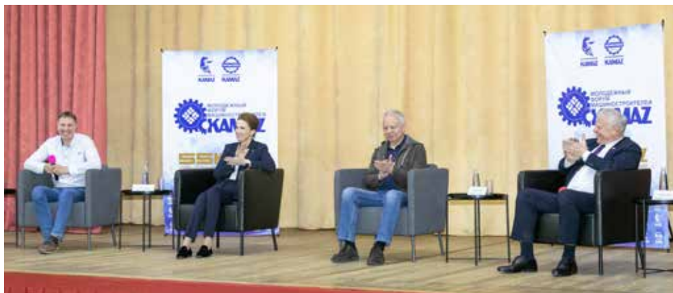
Участники события старались проявить себя и во время некруглого стола, задавая вопросы гостям, а те охотно шли на диалог