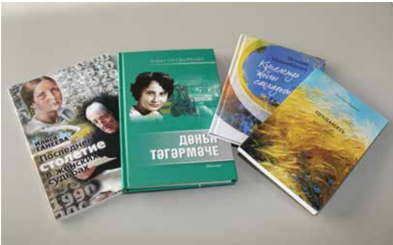
Четыре книги — четыре судьбы