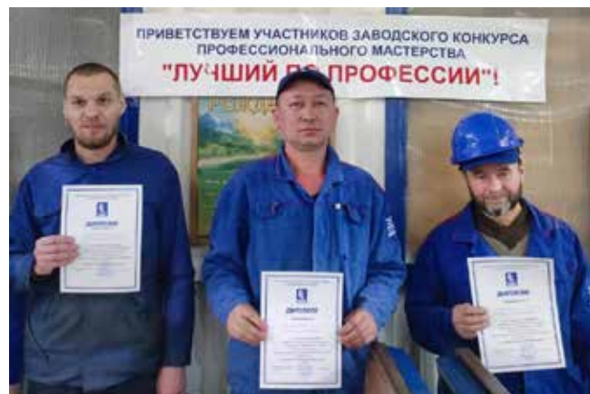
Тройка лучших слесарей-инструментальщиков ПРЗ

— Конкурсанты должны были определить технологическую последовательность операций, правильно разметить заготовку, аккуратно изготовить модель с применением различных инструментов, проделать на сверлильном станке отверстия. Надо было также про-