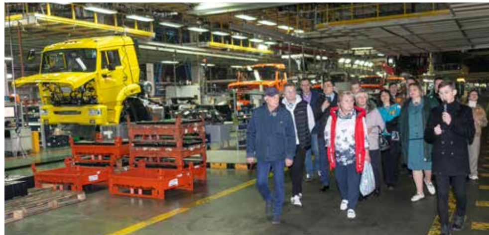
Делегация «Российских студенческих отрядов» осмотрела мощности «КАМАЗа»