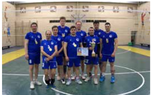
Спортсмены «Челныводоканала» снова лучшие в волейболе на «КАМАЗе»

К финальной игре лишь две команды подошли без поражений в турнире — «ЧВК» и завод двигателей. Судьба «золота» решалась в их личной встрече. В итоге спортсмены «Челныводоканала» одержали победу со счётом 2:0 и подняли кубок над головой.