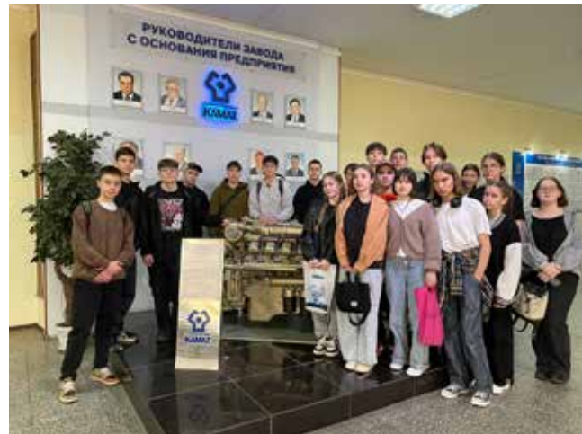
Учеников гимназии № 2 поразила динамичность завода двигателей

обходимых на производстве, об условиях труда, карьерных перспективах,