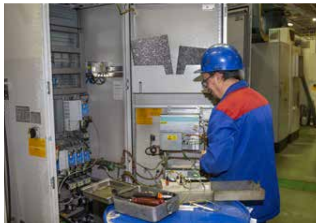
Ремонтник должен быстро найти проблему и устранить её

Перед праздником хочется от души пожелать всем здоровья, профессионального роста, новых достижений. И напомнить — после небольшой передышки нас ждёт традиционная вахта по восстановлению оборудования во время корпоративного отпуска.