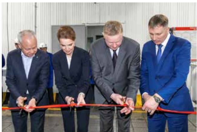
Ленточка перерезана. Добро пожаловать в комнату!