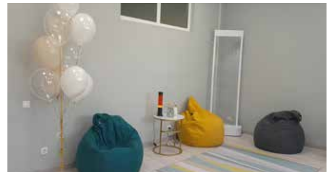
Мягкие кресла, аромалампа и спокойная музыка — то, что нужно для приведения мыслей в порядок

*Нетворкинг — расширение сети знакомств для решения профессиональных и личных задач.