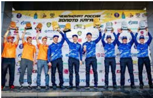
Первое и второе места у «КАМАЗ-мастера», а третье досталось Ural Motor Sport

В мае команда «КАМАЗ-мастер» примет участие в гонке «Пески Арчеда», которая пройдёт в Волгоградской области.