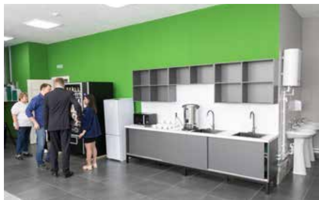
На кухне можно разогреть обед, заварить себе крепкий чай и отдохнуть за столиком

Ещё три комнаты психологической разгрузки уже доступны для сотрудников в производстве цветного литья. Кроме того, в июне распахнутся двери столовой № 20 в АБК-9 после капитального ремонта. В планах на следующий год обновить столовую № 25 в АБК-10.