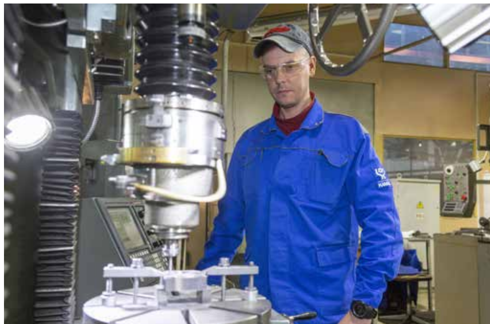
От травмы уберегут средства индивидуальной защиты и осторожность на рабочем месте

Победителям в каждой номинации будут вручены почётные грамоты компании. Коллеги, чаще прислушивайтесь к рекомендациям этих людей, ведь они стоят на страже вашего здоровья.