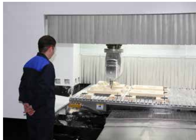
На производстве из пород дерева используется сосна и берёза

— С появлением станка мы перестали делать всё сами вручную, процесс для нас поменялся. В первую очередь мы разрабатываем технологию обработки, пишем управляющую программу на станок и следим за опе-