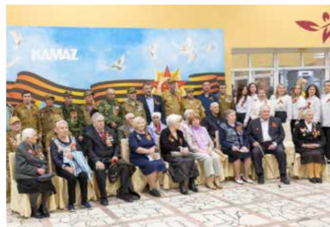
Ветераны — самые дорогие гости на празднике Победы. Они будут максимально окружены вниманием

Памятный вечер, посвящённый Дню Победы, состоится 7 мая в Органном зале. Со словами благодарности ветеранам Великой Отечественной войны, участникам войны в Афганистане, специальной военной операции