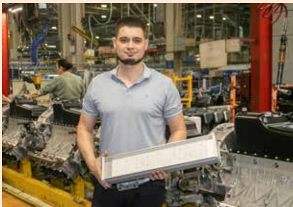
300 таких светильников освещают всё АСП