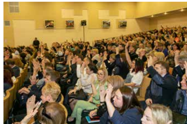
Принятые на конференции решения были единогласно одобрены