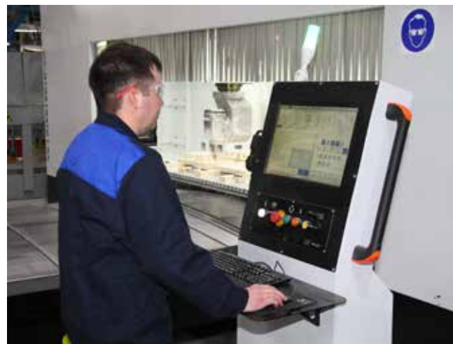
Теперь изготавливать оснастку можно в разы быстрее

рацией, — рассказывает об изменениях в своей работе Айрат, добавляя, что сам станок в освоении несложен.