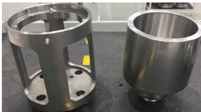
Изначально при изготовлении втулки упорной для АКП-2 применялась оснастка от поставщика (слева), но изготовленная по кайдзен-предложению Раниса Шияпова (справа) исключает забракованность детали

Инженер-программист 3 категории группы программирования технологий Марсель Хузиахметов подал заявку в канцелярию НТЦ для закупки штампов ЭКЗ № 1 и № 2. Отсутствие на чертежах таких печатей приводило к некомплектной передаче документации для открытия заказа на РИЗе. Это влекло дополнительные трудозатраты на проставление