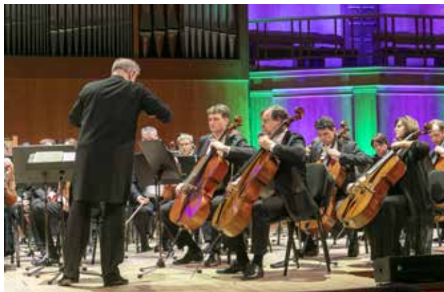
Симфонический оркестр завораживал публику своим исполнением

Публика так и норовила испугать дирижёра и оркестр в аплодисментах, и перед исполнением симфонии № 5 ре минор в четырёх