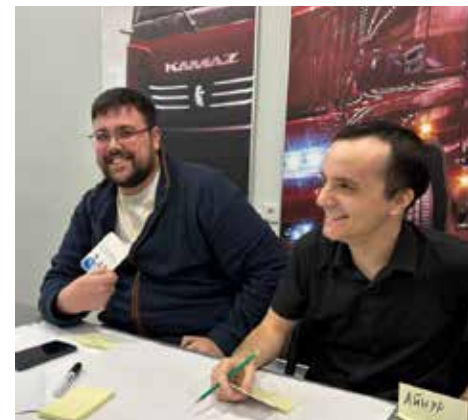
Составление модерационной карты с идеями развития нового сообщества — занятие увлекательное

Они, разделившись на команды, пытались понять, что значит для каждого научная деятельность в компании, с помощью метафорических картин нейросети определяли направления, в которых хотели бы развиваться, анализировали свои ресурсы, записывали желания. Сошлись на том, что в первую очередь молодые учёные должны заниматься прикладными исследованиями, а для активной научной деятельности