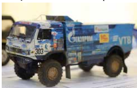
Болид команды «КАМАЗ-мастер» будто бы с финиша дакаровского марафона

Как рассказал сам Динияр, он вдохновился посещением музея команды «КАМАЗ-мастер» вместе со своими