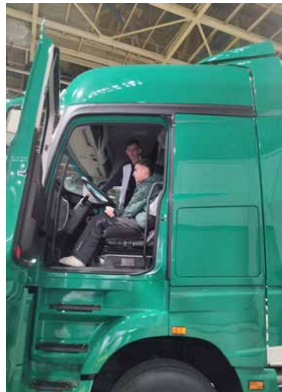
Осмотрев кабину, гость сделал вывод — здесь использованы все современные технологии

На «нитке» сборки кабин для большегрузов поколения К5 идёт модернизация — темп сборки этой модели будет увеличен, она вос-