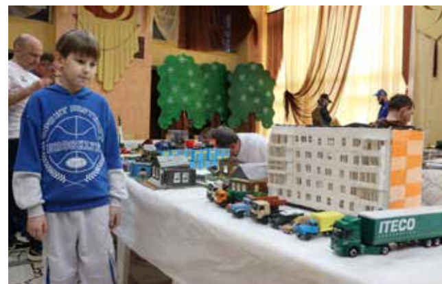
Особое место занимали диорамы: вот панельный дом и избушка, а рядом строительная техника