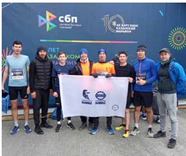
Камазовцы успешно преодолели дистанции Казанского марафона

Камазовская команда состояла из 17 человек, представляющих БЗГД — ДР, департамент продуктового менеджмента, литейный завод, АвЗ, завод двигателей, гендирекцию, «РД», профком, БЗГД по продажам и сервису. Большинство участников команды пробежали дистанции на 3 и 10 км. Пятеро вышли на старт полумарафона, а двое отважились на марафон. Все камазовцы пересекли финишную черту и получили памятные медали участника события.