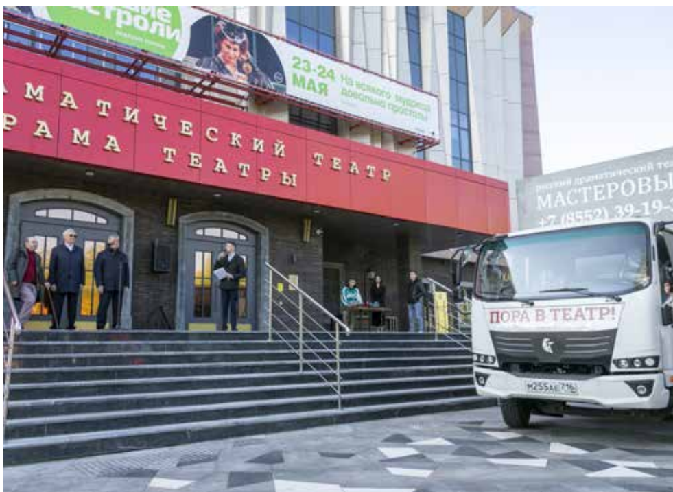
Этот грузовичок будет перевозить декорации и реквизит во время гастролей