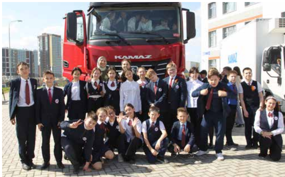
Две модели — «Компас 9» и КАМАЗ-54901 — предоставил НТЦ

Далее ребята погрузились в увлекательные конкурсы, интеллектуальную игру и «Весёлые старты». На этом этапе специалисты блока развития и кузнечного завода выступали в тандеме. Также на День «КАМАЗа» в ЦО № 16 были