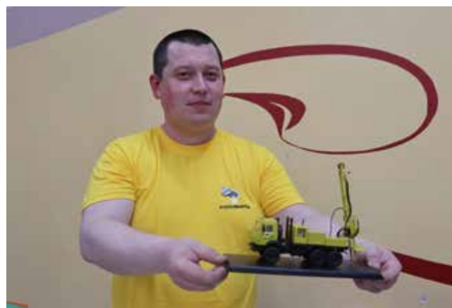
Спецтехника «КАМАЗа» пользуется популярностью у моделлистов

одноклассниками. Подобрал модель, он собрал её три дня. На покраску и нанесение декалей* ушло ещё двое суток. Парень считает грузовик «Синий Армады» самым выдающимся в гамме камазовских автомобилей.