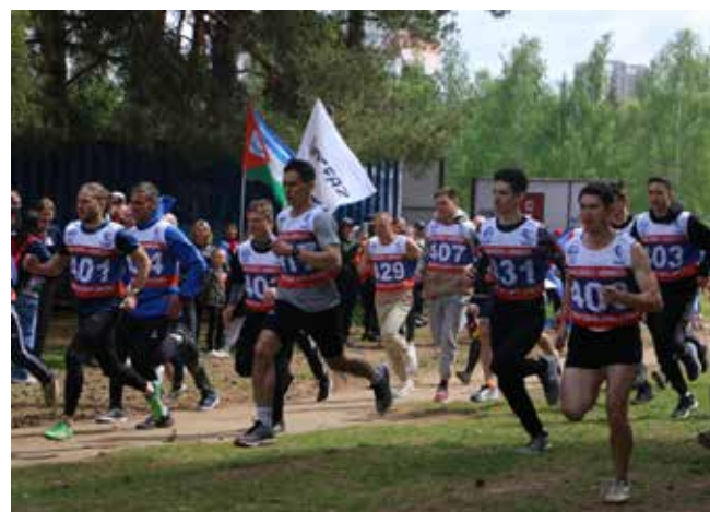
Камазовские легкоатлеты упорно боролись за призовые места