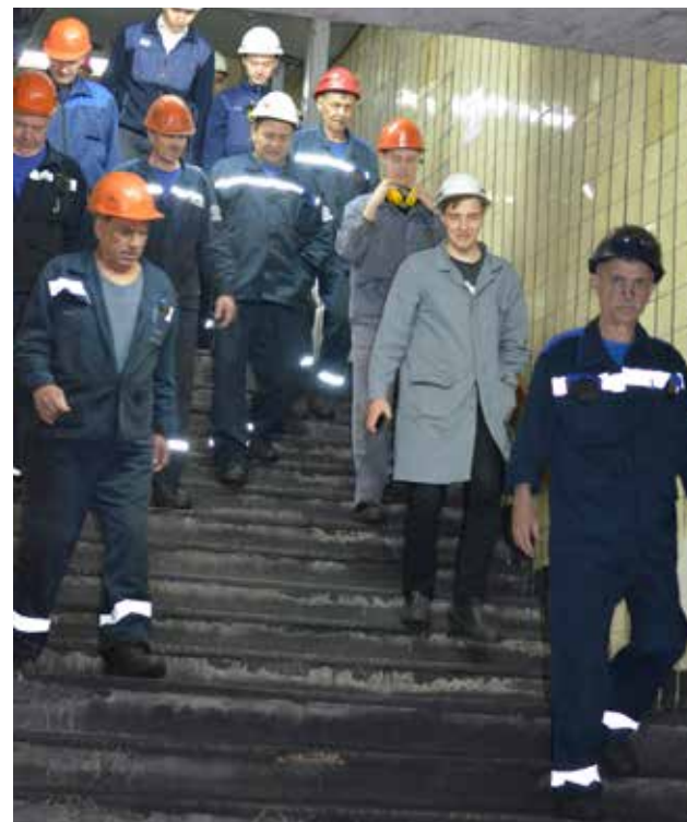
Рабочий персонал КПК-3 следует в защитное сооружение