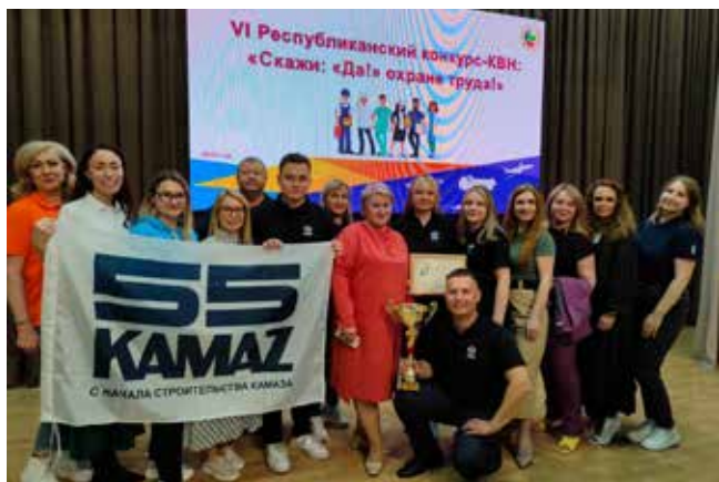
Команда «Нелогичные» — победитель республиканского КВН на тему «Скажи: «Да!» охране труда!»