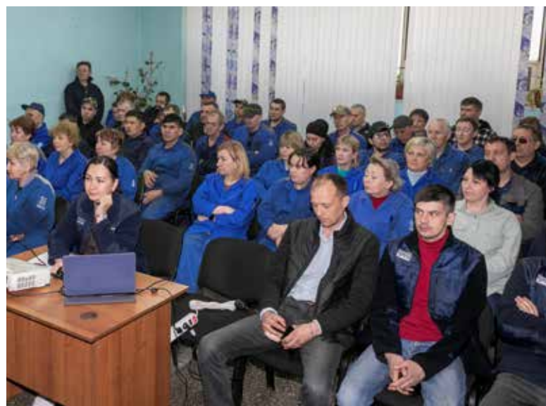
Рабочих призвали активнее интересоваться вопросами качества

— Есть премия за качество, она составляет 50% от всей премиальной части. Как она рассчитывается? Есть базовый уровень — 1, и если качество не на 100%, то за каждую сотую долю снима-