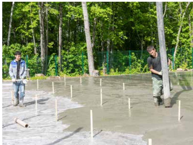
Под спортивные площадки заливается бетонное основание

Параллельно с улучшением бытовых условий продолжают работы по созданию новых спортивных и досуговых зон. Подрядчик проверенный — первую площадку два года назад сделали в «Звёздном», нынче — в «Солнечном». Она уже в три раза больше и включает в себя