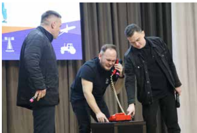
Камазовская сценка о нарушителях зрителям понравилась