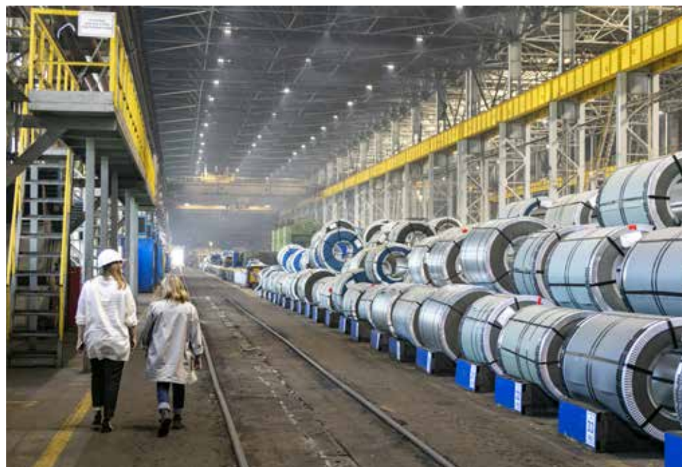
Здесь грузы уложены по правилам, опасности скатывания на передвигающихся нет

Проанализировав ситуацию, комиссия по расследованию сделала вывод: контроль за соблюдением работниками требований инструкции по охране труда осуществлялся не в полной мере. Ещё один немаловажный фактор в сложившейся ситуации — отсутствие в