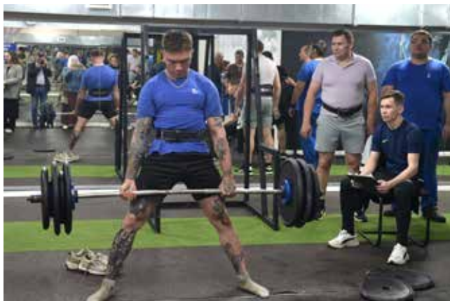
Поднятие железа требует большой концентрации сил

— Человек жив, пока жива память о нём, — обра-