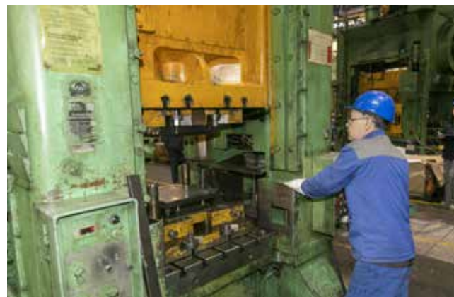
Наладчик должен и в механизмах разбираться, и в материалах заготовок

Лучший наладчик ХШО в профессии более 20 лет, он бессменный бригадир комплексной бригады. На своём участке вместе с другими рабочими обслуживает 28 прессов. Опыт наставничества, на который возлагает большие надежды руководство предприятия, тоже