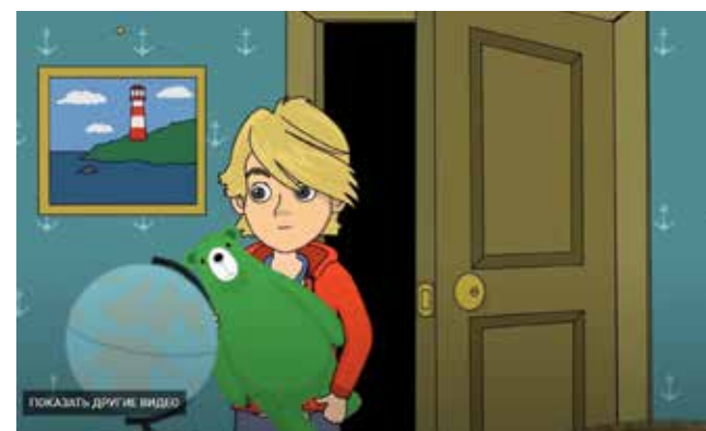
Электронная книга «Каспер, Скай и Зелёный медведь» расскажет детям об основах кибербезопасности

Все электронные устройства в вашем доме должны иметь следующие инструменты: