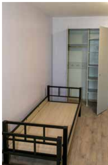
В комнатах обновляются кровати, и шкафы стали функциональнее