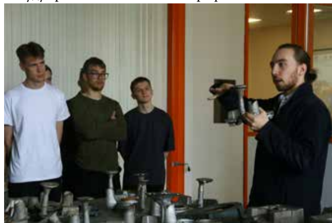
Студенты готовятся стать настоящими литейщиками