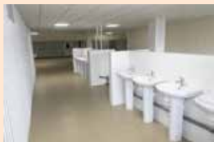
Работы по ремонту гардероба близки к завершению

Работы по обновлению начались в октябре прошлого года. Сделать предстояло многое, ведь гардеробный блок рассчитан на тысячу человек и занимает 1300 квадратных метров.