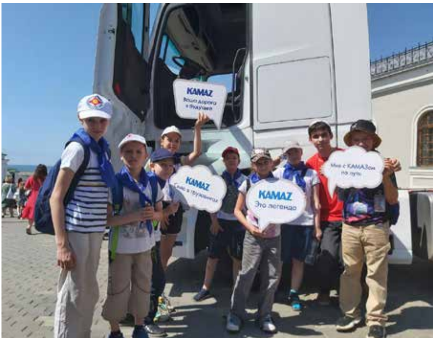
Красавец КАМАЗ-54901 стал звездой фестиваля

У ребят была возможность примерить роль оператора беспилот-