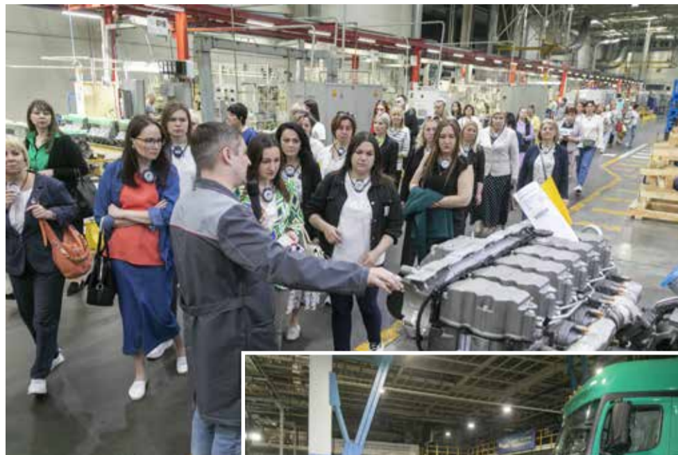
Педагоги убедились: мотор создают настоящие профессионалы

— Образование всегда открыто для любых проектов и начинаний. Важно, чтобы задачи, которые мы перед собою ставим, решались во благо наших детей, — подве-