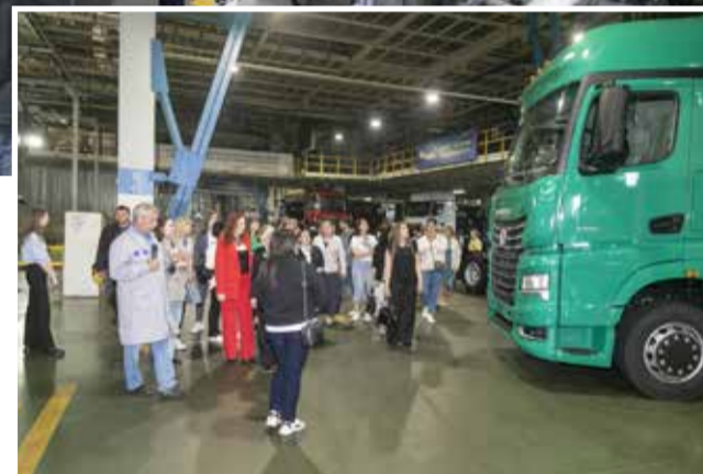
Вот он, красавец КАМАЗ, в создание которого вложен труд тысяч людей

Готовность к сотрудничеству была у всех руководи-