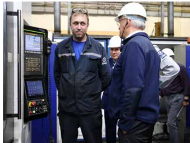
Разговор с рабочими даёт возможность узнать ситуацию изнутри

— Нужно внедрять новые методы, повышать производительность труда и добиваться результатов. Это основа основ, и я считаю, что на «кузнице» это получилось, — резюмировал он.