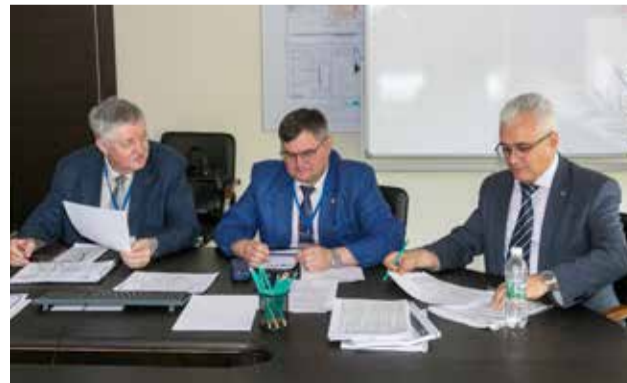
Делегация «Русского Регистра» работала поодиночке, а потом сводила результаты воедино