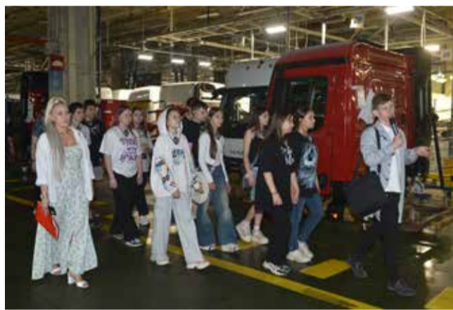
На главном конвейере большегруз собирают прямо на твоих глазах

А 4 июня завод распахнул двери перед школьниками. Вместе с мамами, папами, бабушками и дедушками ребята прошли вдоль конвейера сборки кабин и ГСК-2. Повезло тем, у кого традиционный экскурсионный маршрут пересекался с местом работы родных и близких, но и тут можно было задержаться буквально