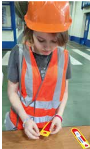
Сердце — КАМАЗу

Закрепляли полученные знания в столовой за обедом, там же обменивались впечатлениями и разглядывали собственноручно сделанные сувениры. А ещё поняли: даже за самым ма-