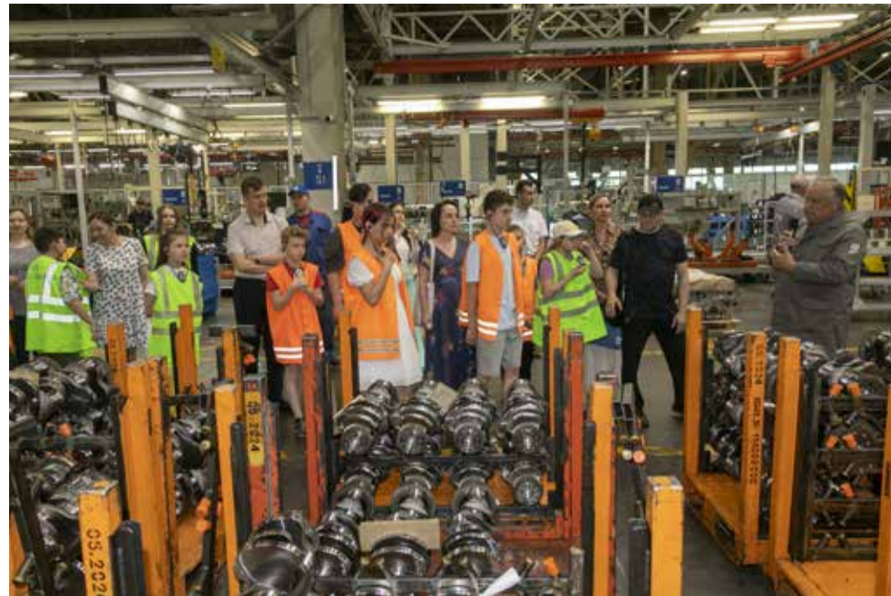
110 ребятшек узнали, как устроен камазовский двигатель