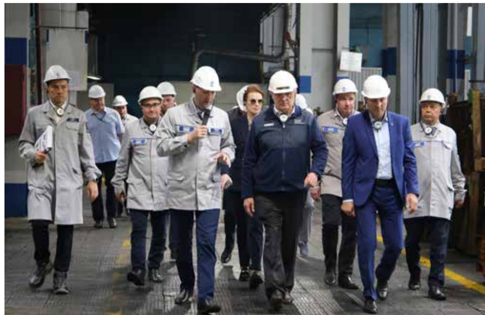
Гендиректор убедился: на кузнице всё получилось

В корпусе рубки металла участники обхода прошли вдоль участка резки заготовок на пресс-ножницах «Фичеп» без нагрева, которому осенью прошлого года был присвоен статус эталонного. Здесь трудятся два оператора по многостаночному принципу: за каждым закреплено по две единицы оборудования, и они обслуживают