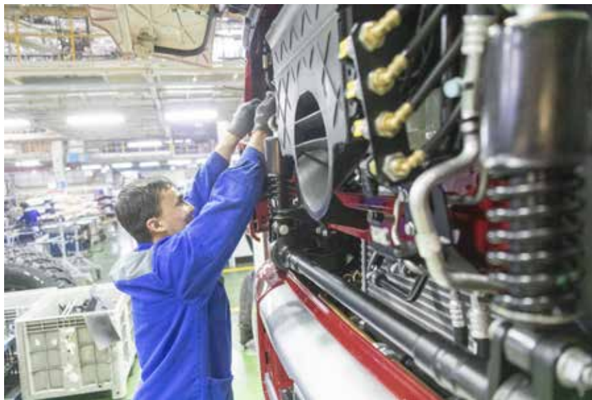
85% работников высказались за повышение тарифов и окладов в структуре зарплат

— Тарифная система, как на «КАМАЗе», по-прежнему применяется в большинстве компаний и может совмещаться с дополнительными механизмами расчётов — например, с грейдовой системой. Времена, когда люди крепко держались за место и были готовы десятилетиями работать в одной компании на одной должности, уходят в прошлое. Чем больше вокруг возможностей, тем меньше шансов, что квалифицированный работник станет сидеть на одном месте — ему нужны внятные перспективы роста. Поэтому в последние годы широко распространяется система грейдов, когда у сотрудников одной специальности может существенно различаться уровень зарплаты. Грейд даёт прозрачные перспективы развития и перехода на следующую карьерную ступень. Мы учитываем эти тенденции, работа над совершенствованием системы оплаты труда не завершена.