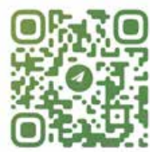
Для пользователей IOS