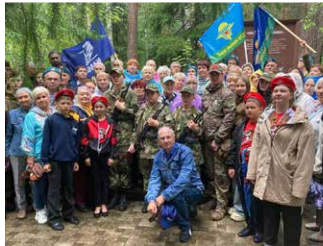
Посещать 22 июня мемориал в Тарловке стало хорошей традицией

Участники митинга почтили память воинов минутой молчания. Затем прозвучали залпы оружейного салюта, и собравшиеся возложили цветы и венки к мемориалу.