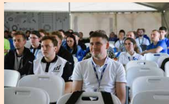
Мастер-классы помогают инженерам осознать свои перспективы в профессии

В конце июня определится обладатель титула самого весёлого и находчивого коллектива на форуме. За него камазовская сборная поборется ещё с пятью командами, представляющими крупные компании страны.