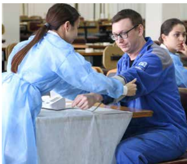
Экспресс-диагностика на рабочем месте — это очень удобно

— Все, у кого будет выявлен повышенный уро-