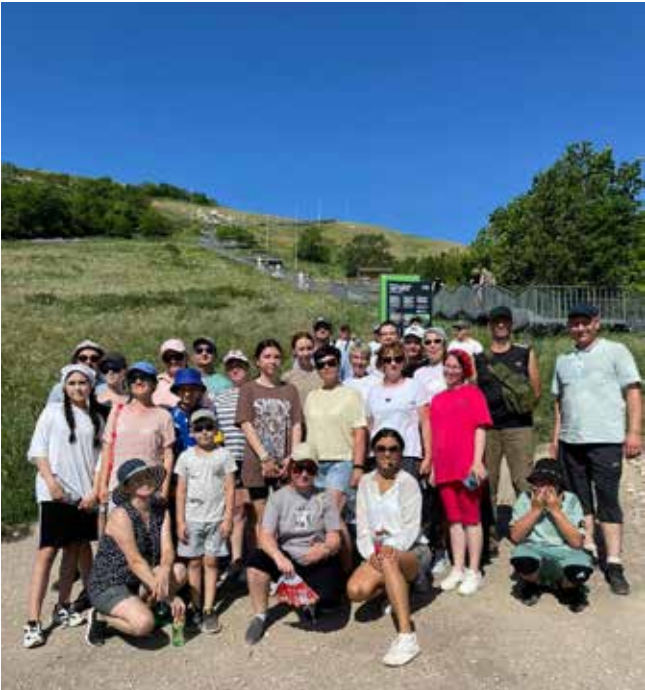
Гора Торатау — башкирская легенда

му «Великолепный страус», где смогли познакомиться с чёрными африканскими страусами, австралийским эму, совами, фазанами, павлинами, верблюдами и другими обитателями фермы. В завершение дня съездили также к Красноусольским источникам минеральной воды. Впечатлений набрали массу, а уж как подзарядились! Теперь с новыми силами в трудовые будни — спасибо профкому и организаторам поездки за такую передышку.