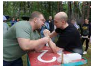
Армрестлинг — ещё один способ проверить силу

Прошли на спортивном поле также состязания по футболу, волейболу и армрестлингу. А гвоздём празд-