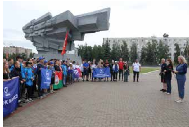
До «Родины-матери» доехали все велосипедисты. Наверное, герои войны оценили бы такой поступок