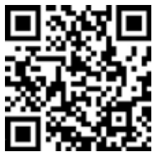
Для пользователей ОС Android