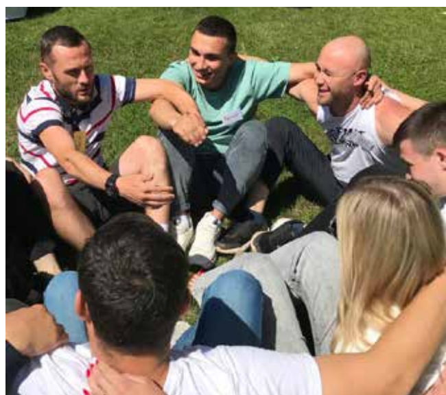
Игры сплотили молодых работников

После тренингов молодёжь ждал накрытый стол с салатами, компотом, пловом, треугольниками и шашлыками. Ребята смогли отдохнуть, пообщаться со своими коллегами, а потом отправились на пляж.