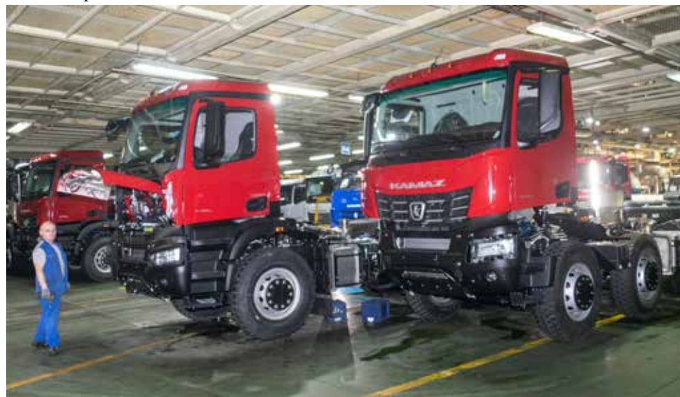
Растёт выпуск тяжёлых самосвалов поколения K5

Оба большегруза со старта шли по конвейеру. Технологи внимательно следили за установкой каждого узла и агрегата, операции должны производиться без