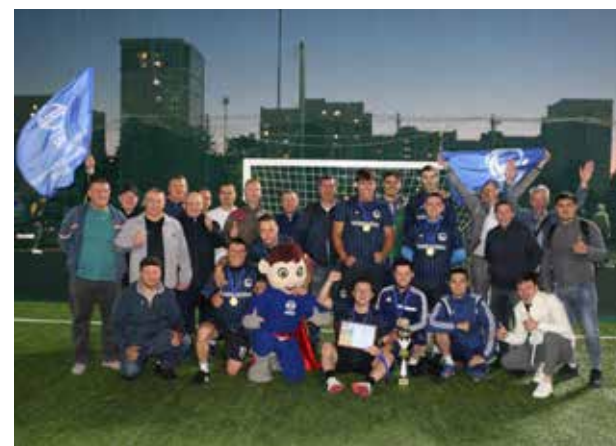
Команда «Челныводоканала» одержала победу во многом благодаря сильной поддержке