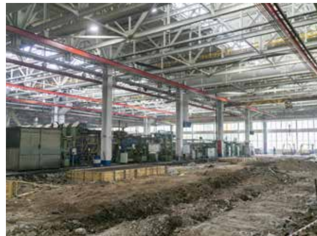
В цехе картеров провели санацию металлоконструкций. Следующий шаг — обустройство полов и заливка фундаментов

Ещё одно важное направление — подготовка участка для оборудования, на котором будут изготавливаться полуоси для большегрузов поколения К5. Эти работы планируются закончить в третьем квартале текущего года.