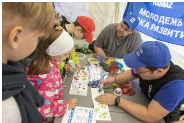
Ананас, аргмак, велосипед — что нарисовать 3D-ручкой?

Для самых маленьких тоже нашлись занятия. Вот ребяташки раскрашивали акварелью гипсовые фигурки автобусов, самосвалов, а рядом собирали пазл по эскизам. Интересующиеся камазовской техникой без особого труда угадывали в