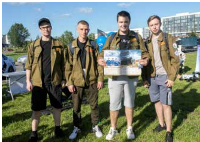
Получить автограф от пилота команды «КАМАЗ-мастер» для студентов из Барнаула — большая удача