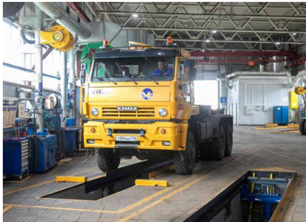
На участке созданы все условия для качественного обслуживания автомобилей, водители видят это и ценят труд слесарей

Вникать молодому мастеру пришлось во множество вопросов. Производственная система «КАМАЗ», о которой он раньше даже не слышал, пришлась ему по душе — хороший инструмент, продуманный, эффективный. Немало времени ушло на изучение инструкций по охране труда, но с этим он