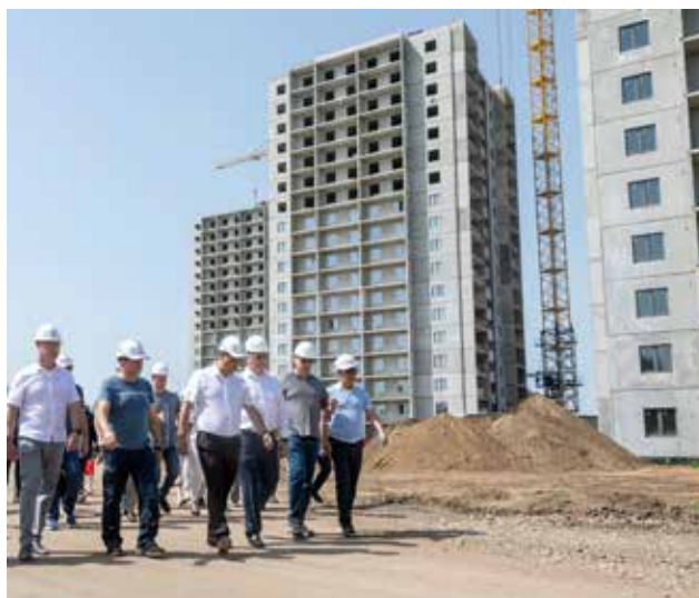
Монтаж трёх 18-этажных домов практически завершён

Обсудили на встрече и вопрос зонирования пространства. Для начала договорились о строительстве парковки на 456 машин между жилым комплексом и улицей Машиностроительной. Без неё жилой комплекс