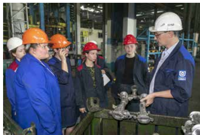
В вузе теория, а на литейном реальность

конца года должно быть сдано 1900 таких большегрузов. У второго собрата, КАМАЗа-65658, темпы роста скромнее. Добавляют веса поколению K5 самосвалы тяжёлого модельного ряда, чей антисанкционный вариант был впервые собран в прошлом году. В 2024-м выпуск КАМАЗов-6595 и 65951 перешагнёт отметку в полтысячи машин.