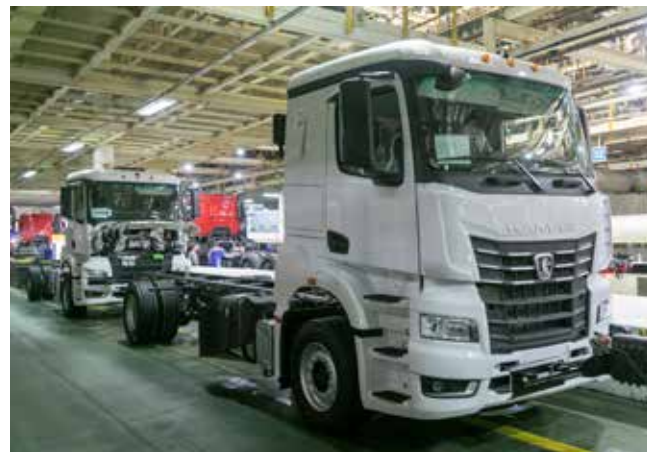
Первые транспортники КАМАЗ-65658 только что сошли с конвейера

Для того, чтобы сделать практику более насыщенной и познавательной, служба по персоналу литейного завода предусмотрела экскурсии в другие производственные корпуса. Начали знакомство