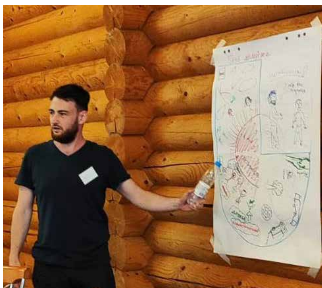
Герб молодёжного сообщества КЗ готов

Следующий номер газеты «Вести КАМАЗа» выйдет 26 июля 2024 года