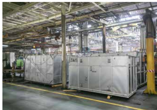
Оборудование прибыло, его монтаж намечен на конец июля