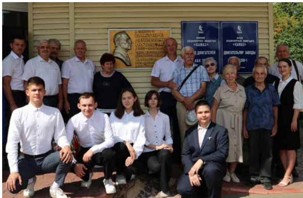
Первого директора чтут и молодые, и люди в возрасте

С лирическими композициями «Россия моя» и