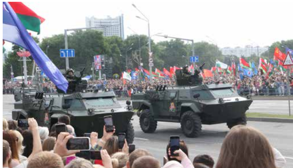
На параде в Минске в честь 80-летия освобождения Беларуси представлена вся мощь вооружённых сил