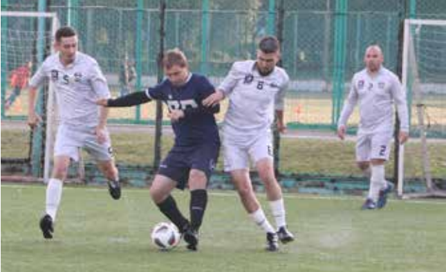
Футболисты стараются показать своё мастерство и в обороне, и в атаке

В матче на поле могут находиться вратарь и восемь по-