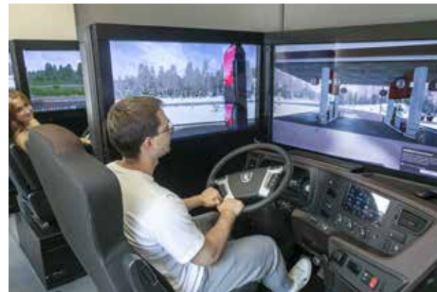
Сидя за рулём K5 в мобильном учебном классе, можно пройти трассу и летом, и зимой

В дальнейшем планируется разработка новых учебных программ для совершенствования курса, в частности в обучение будет введён кейс «Безопасное вождение». На экране будут создаваться аварийные ситуации, а водитель должен вовремя среагировать на них. Рассматривается и вариант обучения удалённым управлением