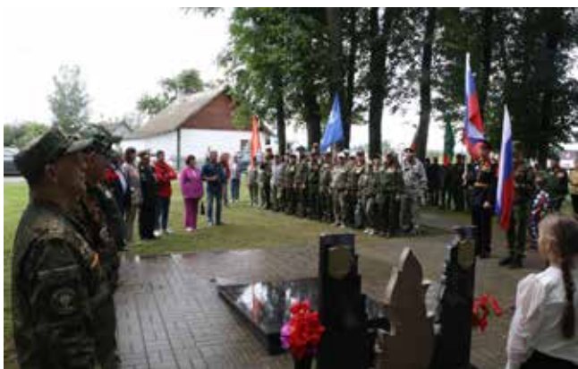
В партизанском крае — деревне Бакшты — царит особая атмосфера

Они заверили, что готовы и впредь оказывать содействие работе по патриотическому воспитанию. А она организаторам очень пригодится — у них уже есть план VIII автопробега, с почасовой детализацией!