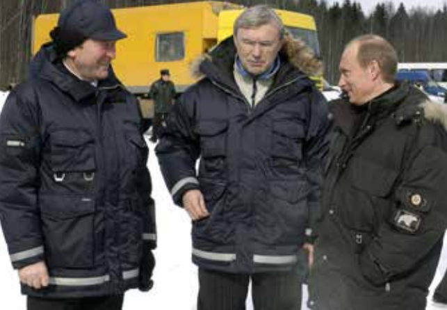
...и даже Президент России

— О, у меня опыт и правда оказался незабываемым (смеётся). В 1974-м, когда я закончил институт, КАМАЗ ещё в полную силу не работал, поэтому меня направили на стажировку на ВАЗ. Приехал, меня с ходу озадачили: вот список деталей, из которых состоит автомобиль, нужно