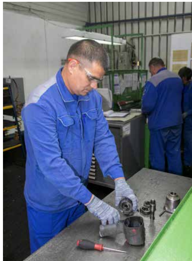
От качества сборки гайковёртов зависит момент затяжки инструмента