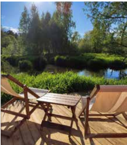
Красивая картинка выглядит заманчиво. Вот только не мешает проверить, не хочет ли кто-то нажиться на этом

тельно прочитайте договор перед его заключением.