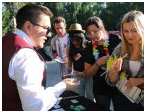
Инструктаж перед важной миссией — спасением планеты