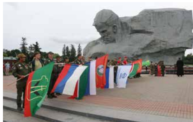
Участники автопробега склонили знамёна, отдав честь подвигу бойцов Брестской крепости

Брестскую крепость защищал многонациональный гар-