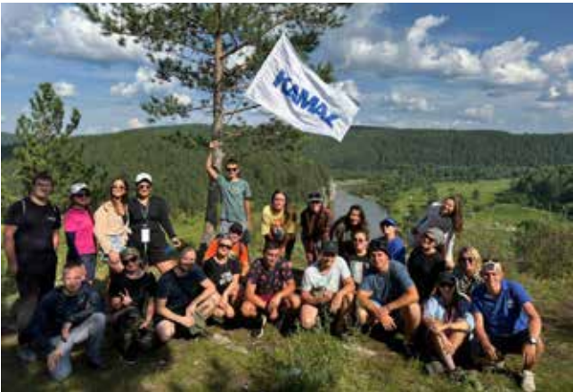
Красивейшие места, хорошая компания... Настоящее летнее счастье!

Познав туристическую жизнь, многие участники сплава присоединятся и к турслёту «КАМАЗа». Активности и приключений много не бывает! Особенно в такой приятной компании.