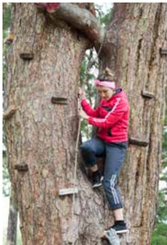
Турслёт у камазовцев всегда проходит шумно и весело

Участники поселятся в палатках, будут соревноваться в конкурсах, напишут письмо будущему туристу, а также повеселятся на выступлении кавер-группы «Сафари». В завершение события лучшие команды получат кубки туризма, спорта, культуры. Определятся обладатель малого кубка и набравший в состязаниях наибольшее количество баллов чемпион.