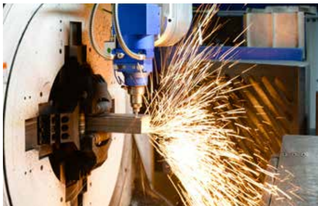
У нового лазерного станка много возможностей

Новые установки отличаются лазером волоконного