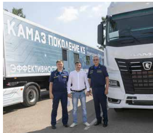
О возможностях учебно-тренировочного центра знают все разработчики и представители «ДОСААФ-Авто Лизинг»

реальным автомобилем. Путешествие по России у мобильного класса на базе КАМАЗа-54901 только началось, и оно наверняка будет долгим и успешным.