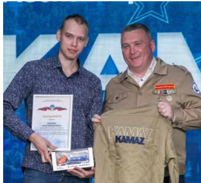
Не забыли про благодарности и подарки для вузов, где учатся ребята