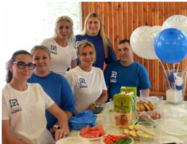
Мастерам праздник очень нужен!

На базе отдыха «Иволга» мастера и бригадиры автомобильного завода отметили свой праздник. Здесь успели и планы работы обсудить, и знаниями истории блеснуть, и Фортуну на щедрость испытать.