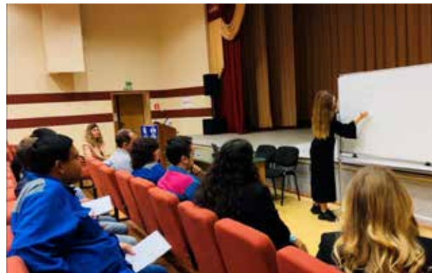
Учить языки интересно и полезно

Записаться на базовый курс, который продлится три месяца, могли все желающие со школьным уровнем знаний предмета. Занятия с опытным преподавателем будут проходить два раза в неделю по вторникам и четвергам в актовом зале АБК-1. Заводчане надеются, что обретенные знания помогут им смотреть фильмы без перевода, лучше ориентироваться в турпоездках, читать книги в оригинале и откроют новые горизонты для развития. Занятия для членов профсоюза бесплатные.