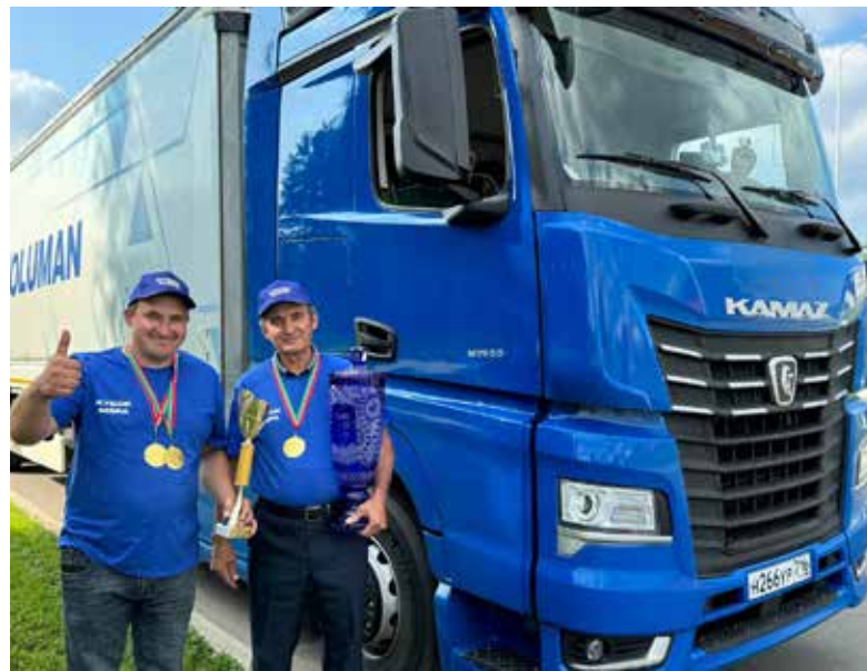
На Кубке мэра Челнов в этом году камазовцам не было равных