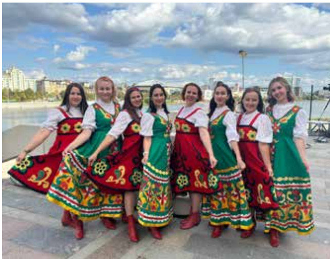
Яркие, задорные артисты не остались без внимания казанцев

Камазовцы, ежегодно покоряя взыскательное жюри фестиваля, получают при-