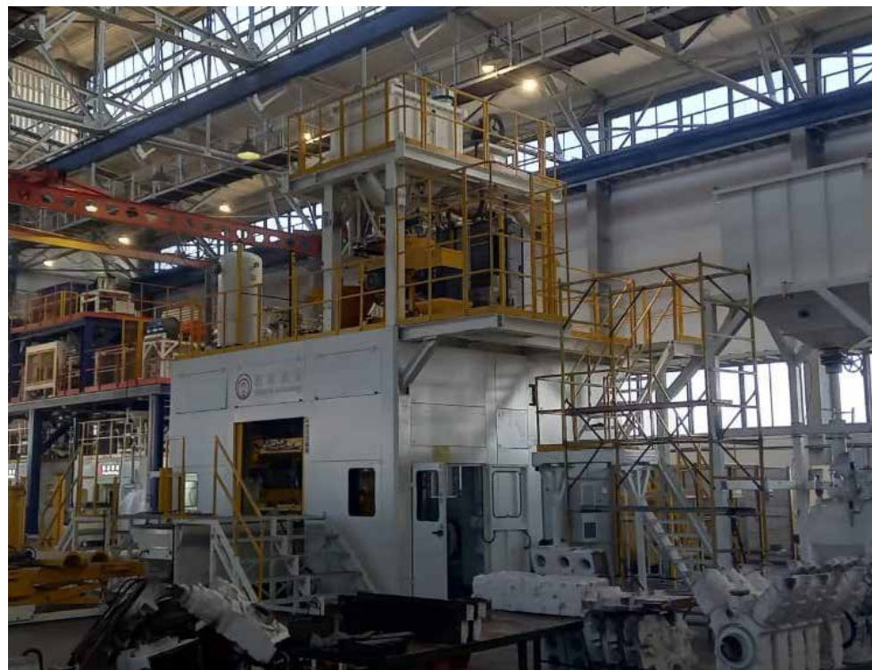
Тутаевский моторный завод оснащается новым оборудованием, что позволяет снизить себестоимость продукции и значительно улучшить её качество

— «КАМАЗ» активно развивается, осваивая новые технологии, поставляя на рынок востребованную продукцию. Удаётся ли дочкам из блока автокомпонентов двигаться в том