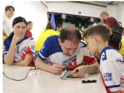
Папа — лучший учитель

Организовал уютное домашнее соревнование профком автогиганта. Участие в конкурсе приняли 15 команд-семей. Им предстояло пройти пять спортивных состязаний: футбольный дартс, боулинг, прыжки на банане, бег в штанах и гусеницу. Предложили участникам и менее активный досуг — для них устроили четыре мастер-класса. Сборка управляемой машины, пайка фонарика, сборка подставки для телефона и ключницы — вот такие полезные в семейной жизни лайфхаки!