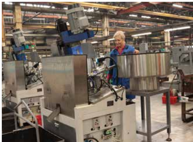
На БелЗАНе полным ходом идёт техническое перевооружение

Сейчас разрабатывается проект развития блока до 2030 года, в нём будут учтены в том числе и риски. Задач много, они разной степени сложности, многие будут решаться при участии специалистов НТЦ и Технологического центра. Работы хватит всем.