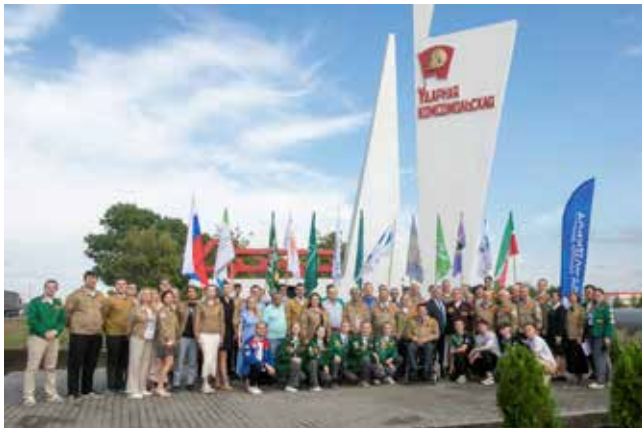
Ветераны и молодёжь встретились у стелы, посвящённой ударной комсомольской стройке «КАМАЗа»

...Пусть студенты шагают в бойцовках навстречу — Будет связь поколений сынов и отцов. Пусть эта история пишется вечно, И вечно не будет бывших бойцов.