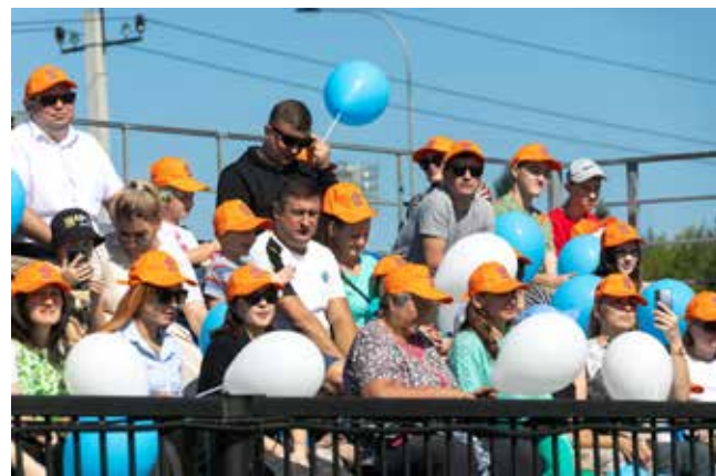
За водителей на трибунах переживали их родные и коллеги