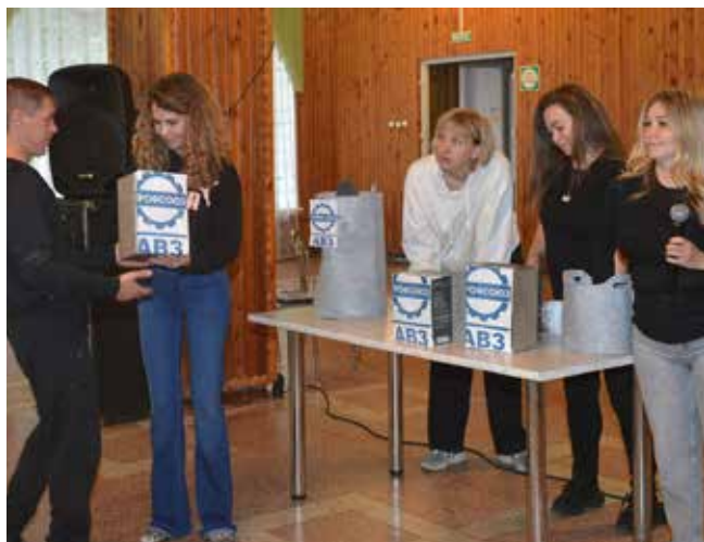
Лотерея от заводского профкома всегда поднимает настроение