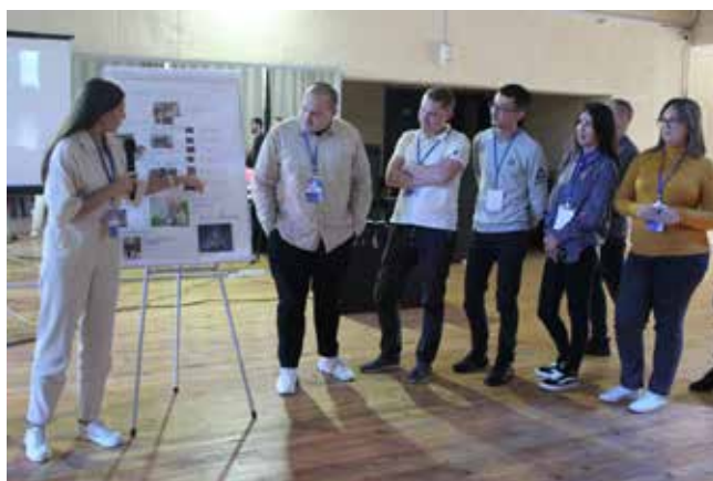
Форум сплотил молодых ещё сильнее

В первый день участники постарались определить главные проблемы в работе с молодёжью. В ходе обсуждения они выделили ключевые направления будущей работы: адаптация специалистов, информационная поддержка, развитие культуры, волонтерство и спорт.