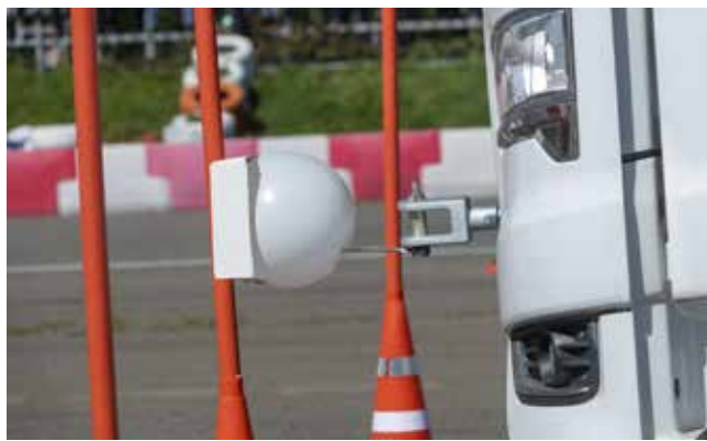
Проткнуть шарик — та ещё задачка: нужно хорошо прицелиться и стойку не уронить