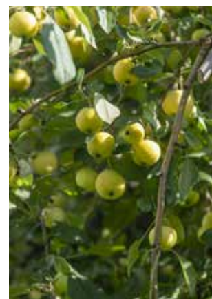
Больше 40 лет они радуют сначала цветением, а потом плодами

няет силой, спокойствием и тихой радостью. Сад есть