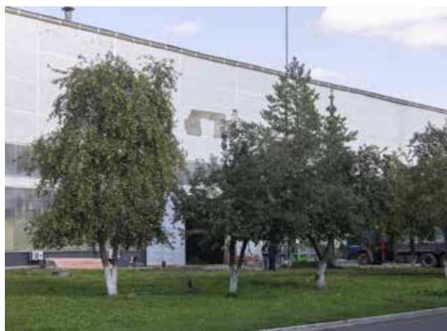
Эти яблони посажены в середине 70-х

Всё сбылось. В начале мая яблони радуют заводчан пышным цветением, в августе — красивыми плодами. В обеденный перерыв в саду или на аллее кто-нибудь обязательно делает селфи в окружении этой красоты.