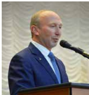
Владимир Чагин — человек авторитетный

29 августа легендарный гонщик Владимир Чагин встретился с коллективом завода двигателей. Работники рассказали Чагину о сложностях социального характера, с которыми приходится сталкиваться в быту и во взаимодействии с разного рода учреждениями. Спикер взял на заметку общественно значимые просьбы для проработки их на парламентском уровне.