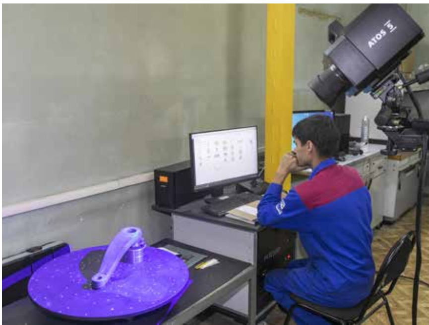
Оптическая координатно-измерительная машина оценит и геометрическую точность детали, и все размеры