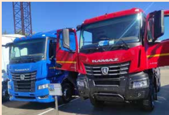
Новейшую камазовскую технику представили в сервисном центре Марусино

На Дне клиента представили востребованные модели камазовской автотехники — гости могли ознакомиться с автомобилями КАМАЗ, в том числе с новинками модельного ряда поколения K5. О модельном ряде камазовской автотехники и её сервисном обслуживании потенциальным клиентам рассказали представители ТФК «КАМАЗ» и «Автозапчасть КАМАЗ». Также они организовали традиционный «круглый стол», в ходе которого ответили на вопросы потребителей.