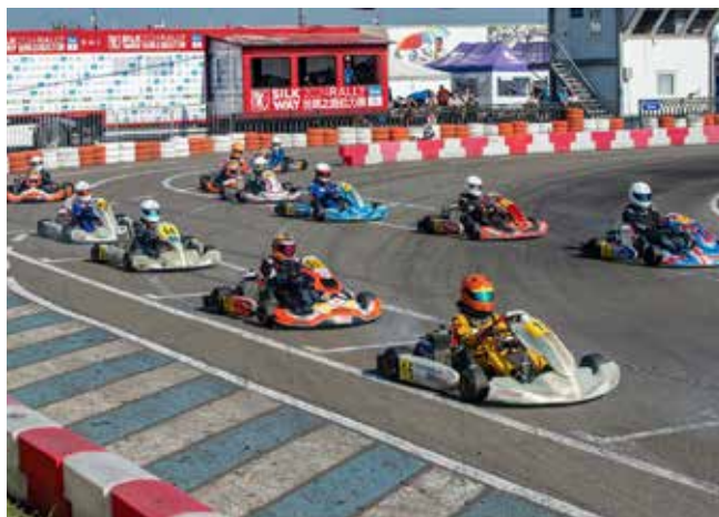
Педаль в пол — юные картингисты мчатся к финишу!

гонщиками. Кроме личных успехов, по итогу состязаний отмечались и командные достижения. В этом зачёте победу отпраздновали представители челнинской команды MAD MAX racing team. Юниоры «Синей армады» расположились на второй строчке. На третьей позиции оказалась команда «Вятка-Карт» из Кирова.