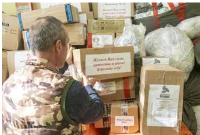
Следующая поездка в зону СВО для Рауфа станет уже 20-й