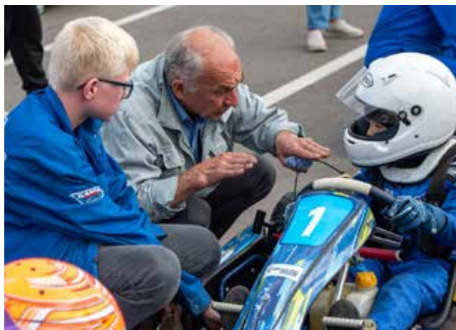
Спортсмены внимательно относятся ко всем советам наставников