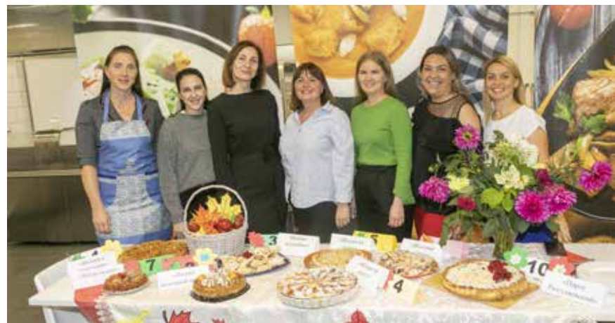
Вот они, мастерицы из блока закупок, со своими шедеврами

Выпекается пирог при температуре 180 °С 40 минут. Готовый десерт выложить на тарелку начинкой вверх и залить кремом. Приятного аппетита!