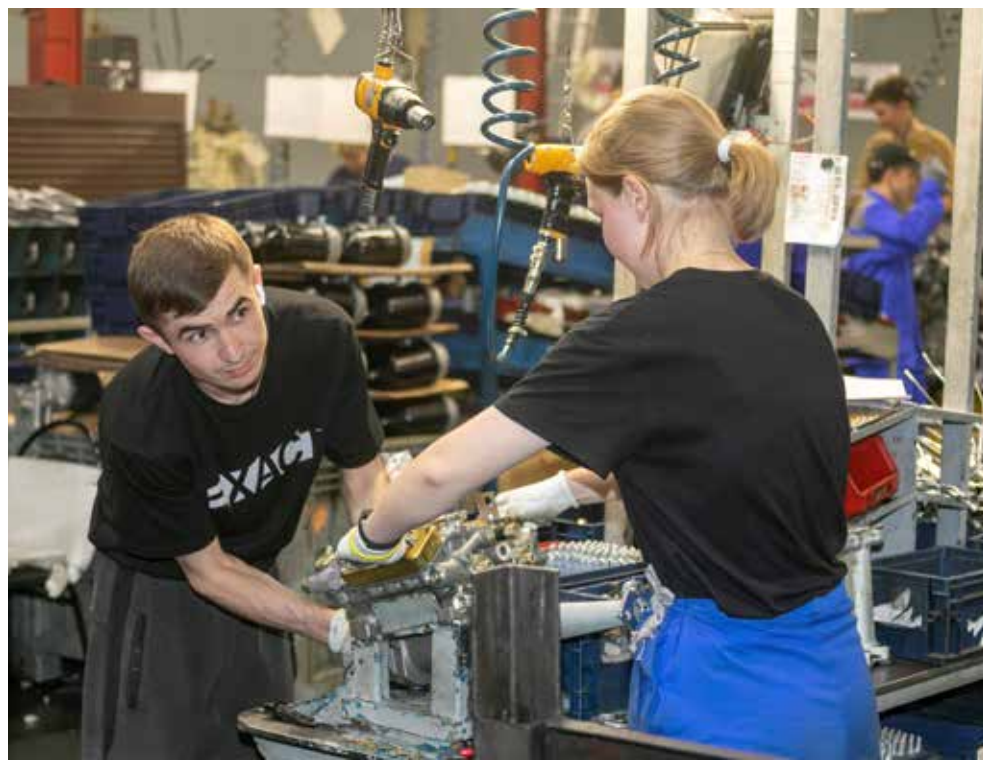
Работа на производстве — бесценный опыт для студентов

Далее профориентационная работа продолжается в школах, вузах и ссузах. Для каждого возраста — свои «фишки» и «плюшки».