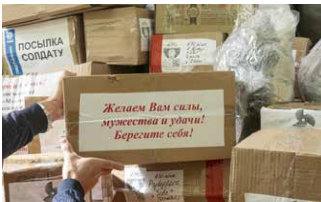
Объём приходящего со всех подразделений «КАМАЗа» гуманитарного груза поражает

— Личные посылки мы никогда не оставляем. Кровь из носу, но их нужно в любом случае доставить до бойца, — объясняет Рауф. —