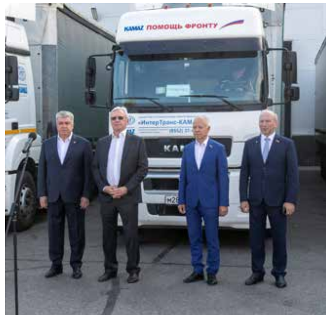
Руководство «КАМАЗа» держит под особым контролем всех работников, отправленных в зону СВО

— Сейчас меня все знают — и воины, и их жёны, и командиры. Будем помогать нашим бойцам до победы, — уверен экспедитор и добавляет: — Надо отдать должное и камазовцам на передовой — парни возмужали, стали серьёзные. Уныния там нет. Все бодрые и настроенные только на победу.