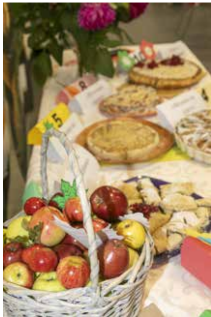
Каждый пирог по-своему прекрасен