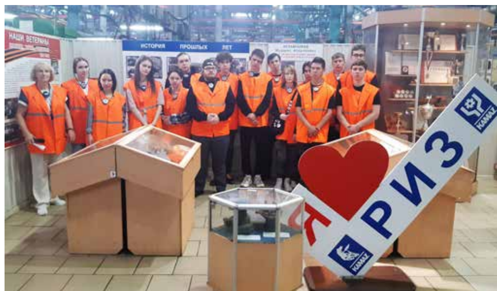
На РИЗе студенты получили первое представление о производстве

продлилась полтора часа. На ней побывали 24 сту-