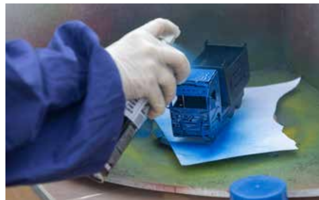
Покраска модели КАМАЗа — «фишка» прессоворамщиков