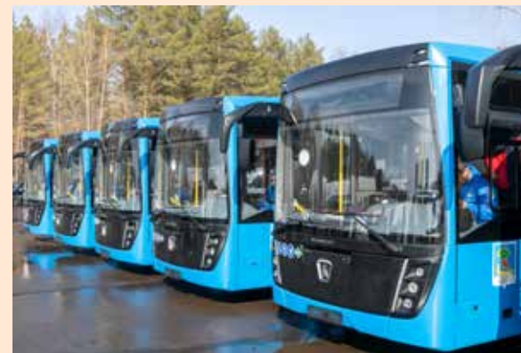
Камазовские автобусы уверенно заходят на рынок

По данным аналитиков, в целом производство автобусов в России за семь месяцев выросло на 17,2% до 21,9 тыс. единиц. В их число входят 536 электробусов, 1300 автобусов, предназначенных только для сидячих пассажиров, а также 245 автобусов на шасси отечественных грузовых автомобилей.