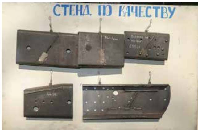
Перед глазами Нутфуллина стенд с эталонными швами на рамы разных моделей КАМАЗов. Эта подсказка помогает выводить шов ровно