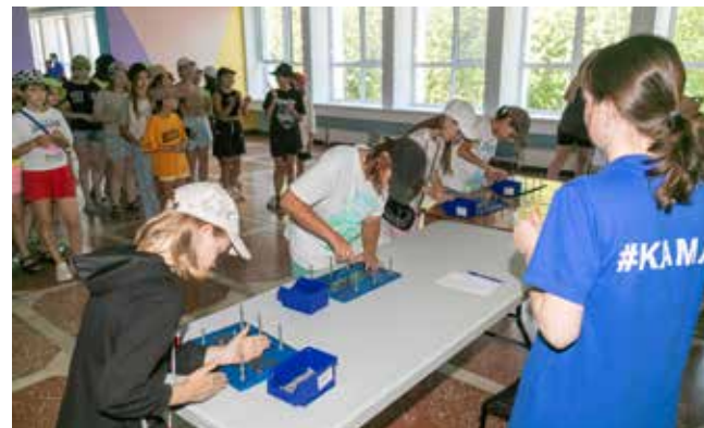
Дни «КАМАЗа» пользуются успехом не только во время учёбы, но и летом в загородных лагерях

— Сейчас у нас есть задача провести для учеников