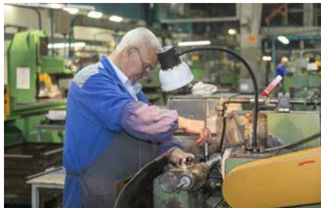
Мастера своё дело знают — брака у них не бывает