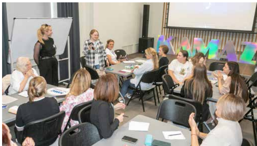
Профориентаторы внимательно слушали советы о проведении Дня «КАМАЗа»