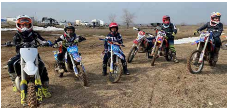
В мотошколе «Техногород Наиком» появится ещё 40 мест

В рамках «Техногорода» работает и картодром «КАМАЗ» — здесь, в частности, открыта школа картинга и регулярно проводятся турниры по этому виду спорта, включая один из этапов первенства и чемпионата РТ по картингу. Помимо этого, «Техногород» сотрудничает в формате допобразования с детским технопарком «Кванториум» в Набережных Челнах.