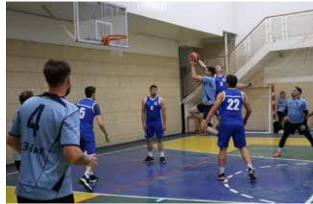
Бросок — и мяч попадает в корзину

Таким образом, в финал вышли ПРЗ и «ЧВК». В матче за третье место сразились спортсмены БЗГД — ДР и ЛЗ. О заключительных встречах первенства читайте в следующем номере.