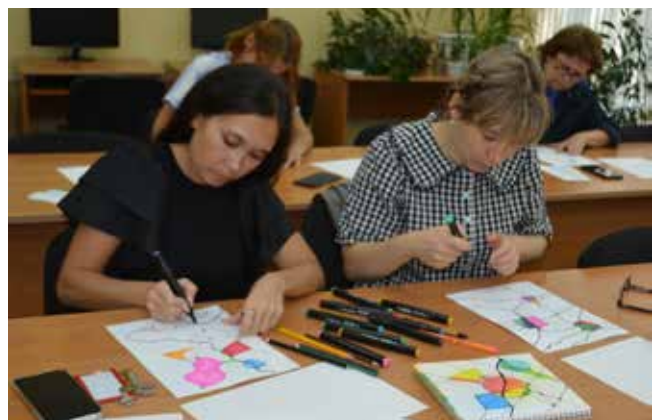
Фигуры, линии, цвет — всё имеет значение!

Желающих постичь алгоритмы и методы нейрографики на кузнечном заводе меньше пока не становится. Кто-то ищет дополнительную информацию в интернете, в книгах, пытается самостоятельно достичь совершенства, а кто-то с удовольствием посетит очередной мастер-класс. Ведь узнавать новое и учиться — это всегда полезно, ведь нейрографика дарит настроение и только положительные эмоции.