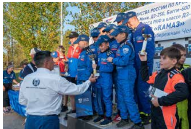
«КАМАЗ-мастер Юниор» — на верхней ступеньке пьедестала

В заездах спортсмены показали своё умение управлять техникой.