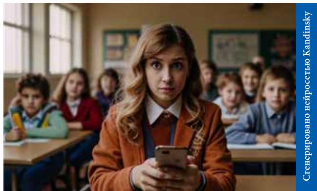
Сгенерировано нейросетью Kandinsky

Чтобы не было мучительно больно, обезопасьте родительский чат