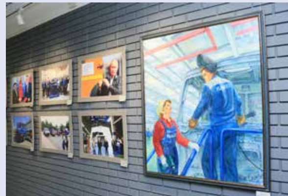
Выставка будет очень насыщенная

О стоимости билетов можно узнать по телефонам +7 (8552) 38-16-24, 38-89-42. Адрес выставки: г. Набережные Челны, проспект Мира, д. 51/16.