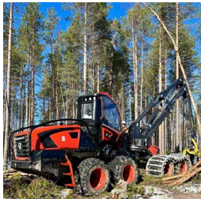
Новинки «КАМАЗа» для лесозаготовительной промышленности тестируются в Карелии

Все эти автомобили в течение 2023–2024 годов тестируются партнёрами автогиганта. Полевые испытания проходят в Карелии, на территории аренды филиала по лесным ресур-