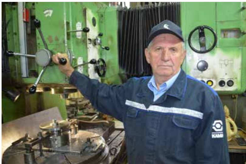
...и сейчас, в 2024-м