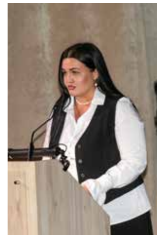
Слово — заводским делегатам