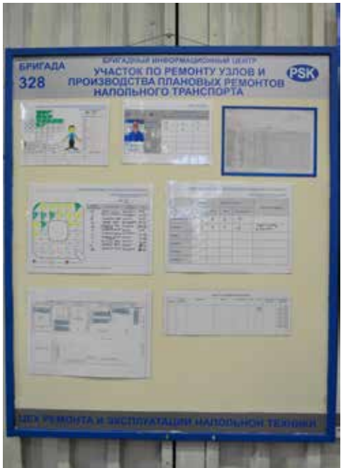
Так теперь выглядит бригадный информационный стенд на ремонтном участке напольной техники в КРМ

Обмен информацией и быстрое принятие решений — эти составляющие остались неизменными в предназначении обновлённого бригадного центра. Директор кузнечного завода Игорь Малясёв распорядился до конца этого года разместить порядка 36 новых БИЦ во всех подразделениях завода. Все они будут изготовлены силами специалистов бюро хозяйственного обслуживания и цеха ремонта и обслуживания оборудования корпуса № 5 КЗ.