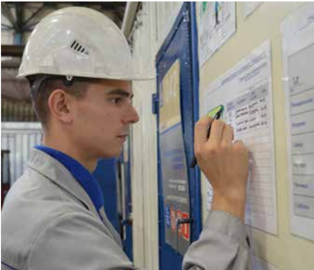
Руководители пилотных участков прошли обучение по заполнению новых бланков с ключевыми показателями

— Обновлённый БИЦ содержит всю необходимую информацию для оперативной работы любого руководителя и отображает текущую ситуацию на конкретном участке или в бригаде.