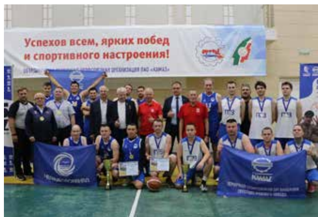
Призёрам вручили дипломы, кубки и медали соревнования

На «КАМАЗе» завершился турнир по баскетболу в рамках Спартакиады 2024 года. Соревнование организовано профкомом компании.