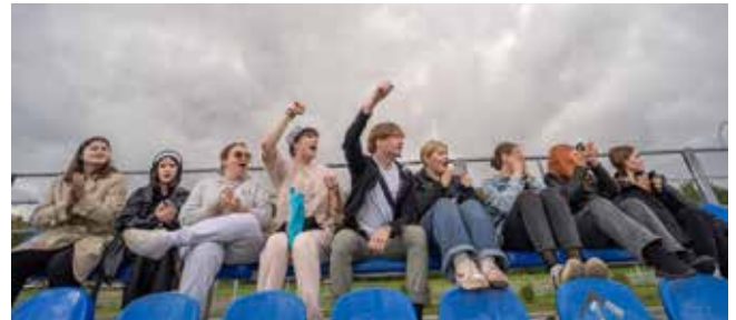
Студенты активно переживали за своих одноклассников...