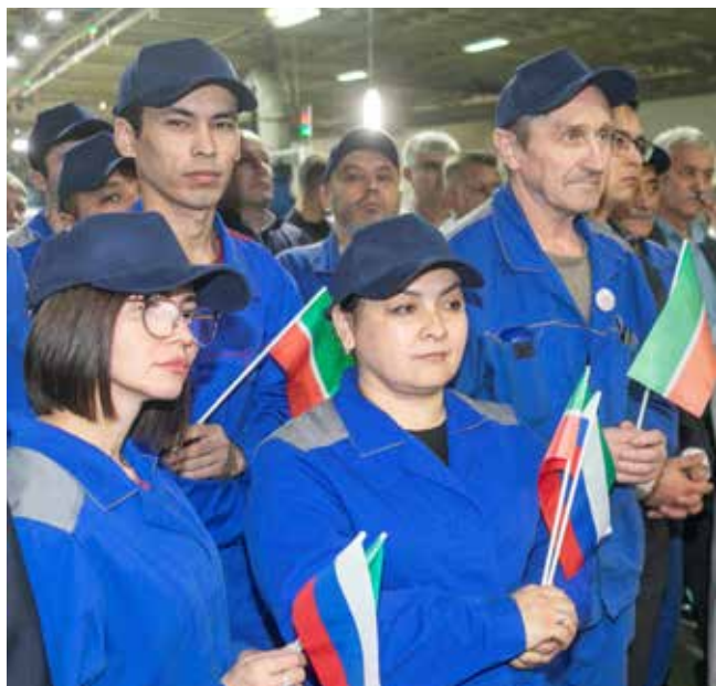
Для заводчан выпуск 2,5-миллионного большегруза — повод для гордости

Основные торжества по поводу Дня машиностроителя и выпуска 2,5-миллионного грузовика состоятся 4 октября.