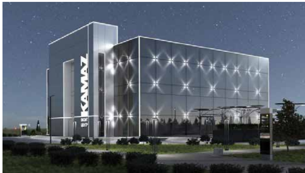
Здание Визит-центра в проекте

этаже по плану представят экспозицию цифрового музея. Здесь организуют показ интерактивных роликов обзорного характера об истории компании, её текущем состоянии и продукции. Тут же планируется установить тренажёр, имитирующий кабину спортивного грузовика команды «КАМАЗ-мастер». Внутри неё можно будет прочувствовать со-