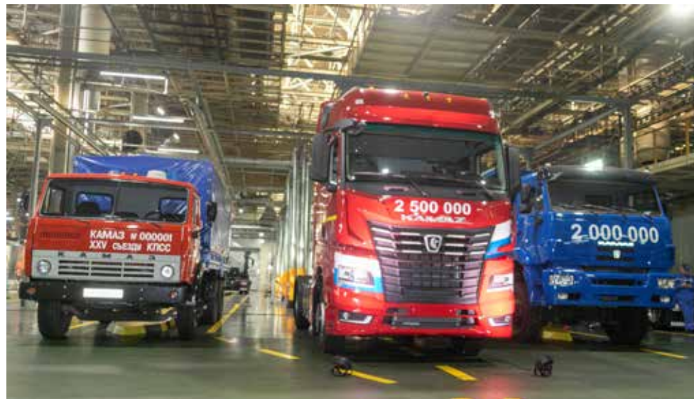
За каждым автомобилем — веха развития «КАМАЗа»

Надолго в памяти останется и церемония награждения, состоявшаяся в исторический день. «За добросовестный, плодотворный, высокопроизводительный труд» звание «Почётный машиностроитель» Министерства промышленности и торговли РФ приказом министра присвоено шести камазовцам из разных подразделений компании. Каждый из них внёс большой вклад в разработку и выпуск как юбилейного грузовика, так и других перспективных продуктов компании.