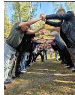
Участники тренинга стали по-настоящему сильной командой

Тренинги для персонала руководством завода организуются регулярно, и эта серия испытаний тоже наверняка даст свои плоды — молодым руководи-