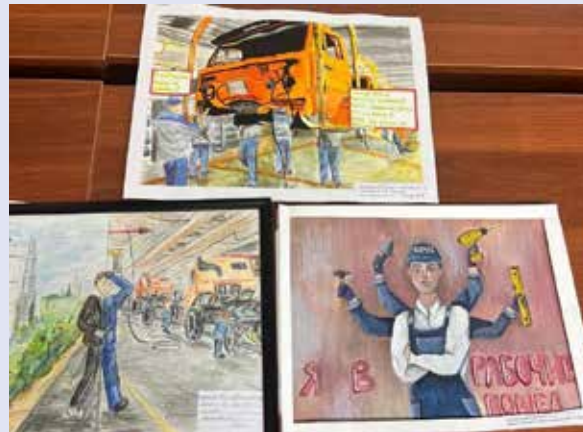
Все работы несут мысль, что быть камазовцем здорово

Конкурс, посвящённый 55-летию с начала строительства автогиганта, проводился профкомом «КАМАЗа». Всех победителей и призёров ожидают дипломы и ценные подарки.