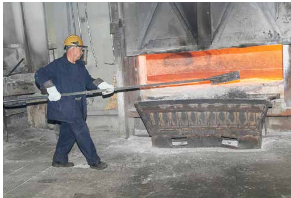
Шлака в алюминиевом сплаве быть не должно, поэтому плавильщик скребком убирает его с поверхности

Каждый два часа Искандар набирает сплав в небольшой кокиль. Когда металл