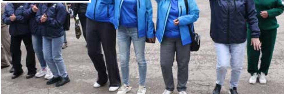
Логисты зажигали под зазорные песни на свежем воздухе