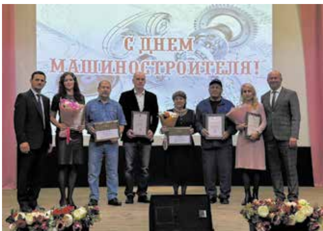
Награждение лучших — неотъемлемая часть праздника