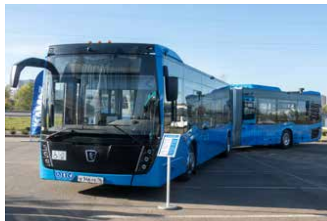
Общая пассажировместимость этого сочленённого 18-метрового автобуса — 162 человека. Здесь 44 сидячих места

— С каждым годом мы увеличиваем число производимой техники, в год больше 2000 единиц пассажирского транспорта сходит с конвейера. Наш транспорт отвечает всем требованиям и нуждам как покупателей, так и непосредственных пользователей. Растёт и география продаж, всё больше регионов получают автобусы и электробусы. И мы не хотим останавливаться на достигнутом, в каждом городе должна быть наша техника! Разумеется, эта цель требует от нас перестройки работы по сервису, чтобы все вопросы покупатели могли решать быстро. Для этого мы создали целое направление, — заверил он.