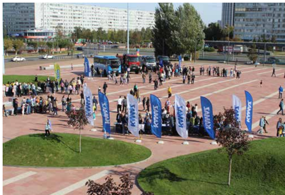
Челнинцы просто не могли пройти мимо и заглядывали на «КАМАЗ-фест»