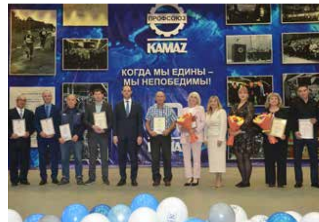
В честь праздника награды вручаются за особые достижения