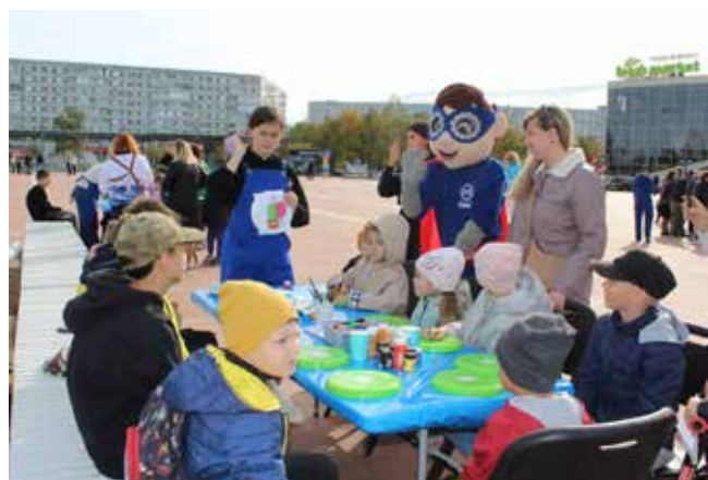
К украшению фрисби ребятами подошли креативно

Творческие коллективы «КАМАЗа» подготовили концертную программу, подарив собравшимся песни «Вперёд, Россия», «Реальная жизнь», Parizod, «Синяя вечность», «В Набережных Челнах». Прозвучали со сцены и стихи. Гостям праздника особенно понравилось стихотворение «Знаешь ли ты, что такое «КАМАЗ»?». А в завершение программы выступила Набережночелнинская филармония.