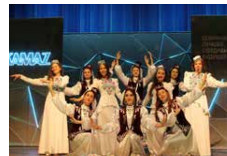
Такие концертные номера завораживают своей красотой