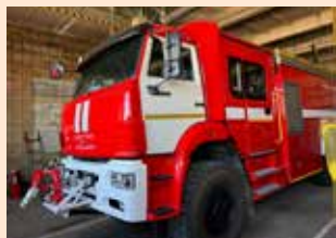
Аэродромная пожарная машина не позволит случиться пожару

Этот автомобиль предназначен для противопожарного обеспечения полётов и защиты объектов инфраструктуры. Он изготовлен на базе шасси КАМАЗ-65222 и оборудован всем необходимым для тушения пожаров на воздушных судах и объектах аэропорта.