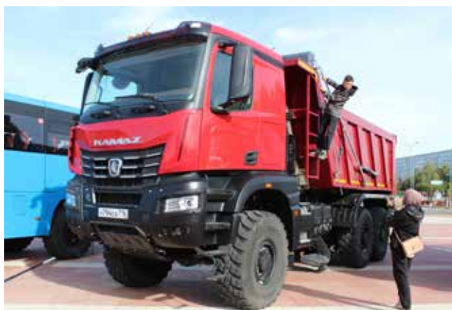
Самые любопытные изучали каждую деталь новейшего самосвала