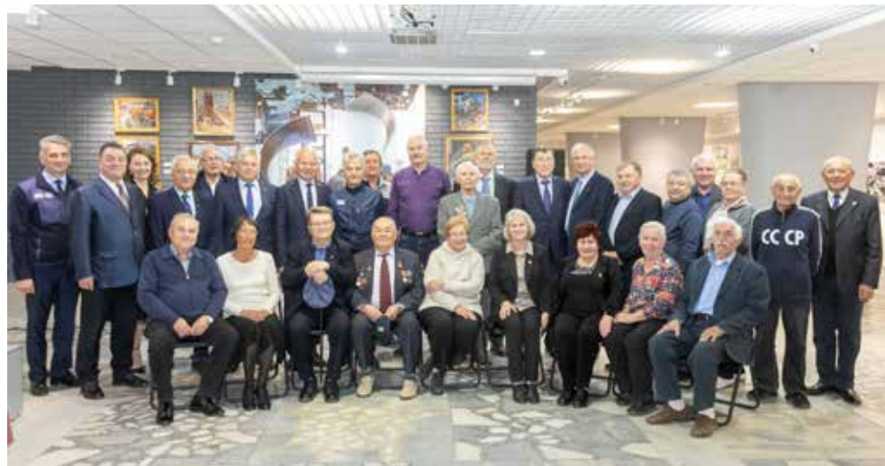
Первыми посетителями выставки стали ветераны «КАМАЗа»

Вниманию посетителей в хронологическом порядке представлено более 180 экспонатов. Сотрудники музея выбрали всё самое интересное за 55-летнюю историю автогиганта, они же каждый день, кроме понедельника, проводят экскурсии. Экспозиция будет работать до конца октября.