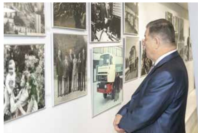
Фотографии из богатой событиями истории автогиганта переносят в прошлое