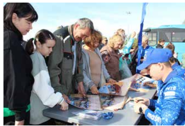
Календари с автографами пилотов «КАМАЗ-мастер» — заветный подарок события