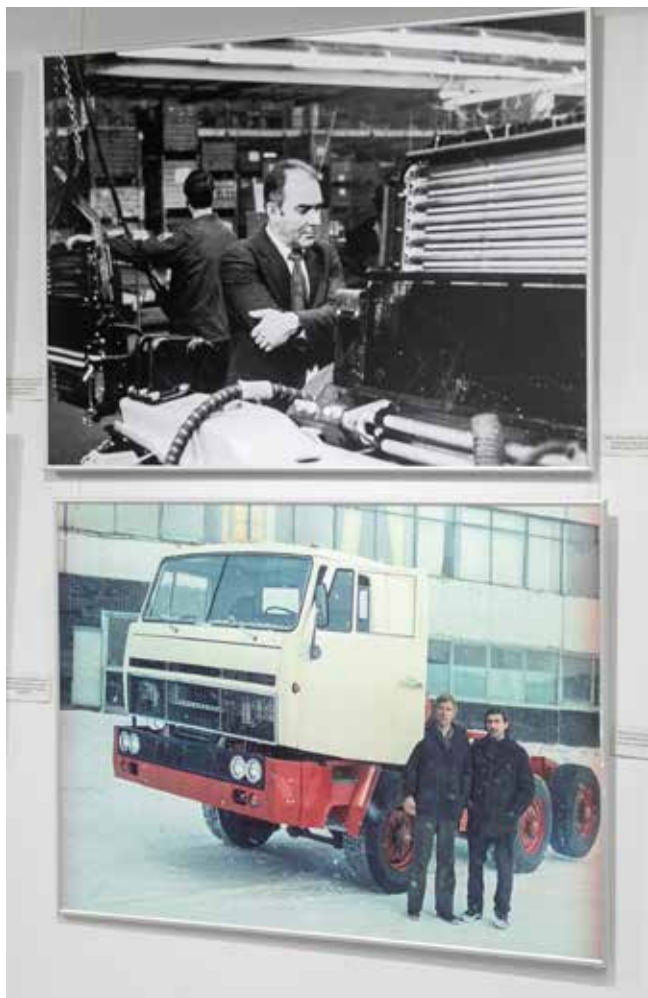
В начале 80-х камазовские конструкторы вынуждены были передать эту модель МАЗу