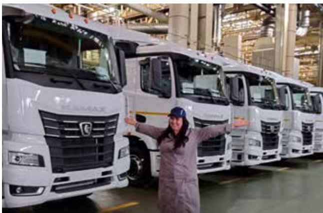
Всё это сделали мы!