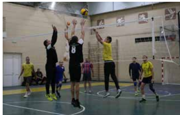
Иногда вместо мощного удара лучше аккуратно перебросить мяч через сетку и соперников

По итогу в полуфинале дизелисты сыграли с «ЧВК», а спортсмены БЗГД — ДР сразились с литейщиками. Матчи также шли до двух побед в сетах. В финал, намеченный на 18 октября, вышли БЗГД — ДР и «Челныводоканал».