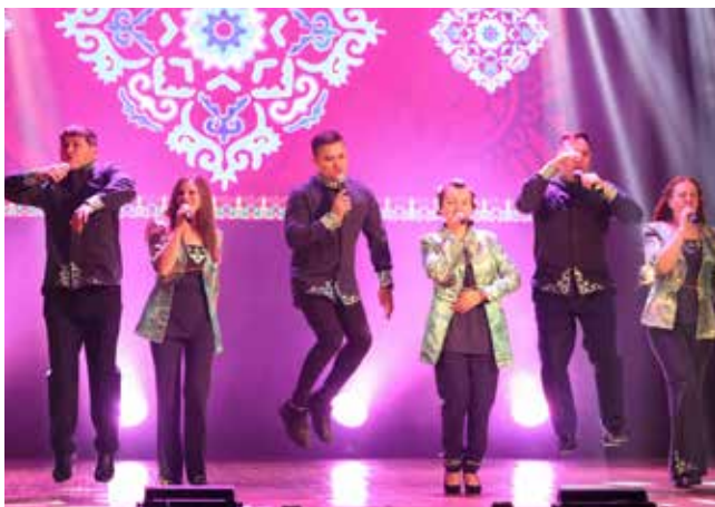
В исполнение лирических песен артисты с ПРЗ вкладывают всю нежность и страсть

12 октября в ДК «КАМАЗа» состоится гала-концерт зонального этапа фестиваля «Наше время — Безнен заман». Камазовцы готовятся к нему основательно, так что у ценителей творчества снова будет шанс увидеть их на сцене, а заодно и поддержать нашу творческую сборную.