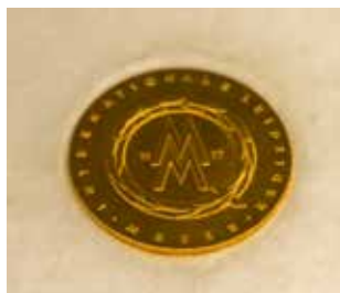
Эта золото «Лейпцигер Мессе» дорогого стоит!

В советском павильоне демонстрировались ГАЗ-53, ЗИЛ-133-Г, «Жигули», «Москвичи». На соискание золотой медали претендовал как раз «Москвич», но жюри отдало предпочтение КАМАЗу.