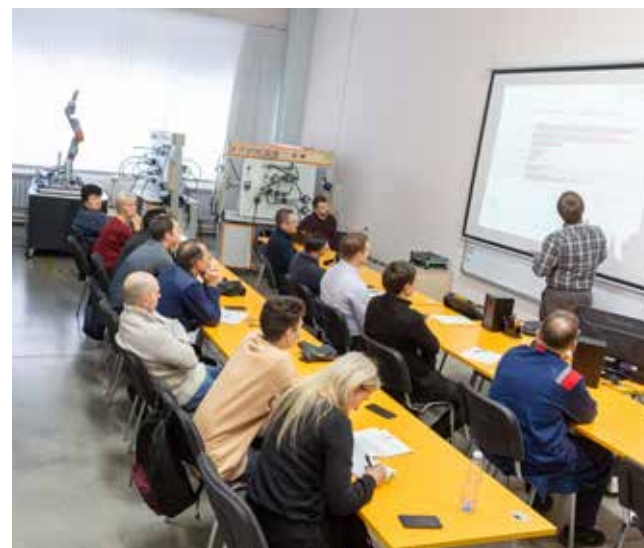
Занятия в МЦПК ведут опытные педагоги с богатым багажом профильного практического опыта работы на производстве

модействие с «Российскими студенческими отрядами». Предлагаем обучать ребят на своей базе, дистанционно во время каникул, к примеру. А когда они приедут на завод, то закрыть и практическую часть. То есть параллельно с основным обучением можно без проблем получить и рабочую профессию. Проект пока в разработке, думаю, скоро сможем уладить все формальности.