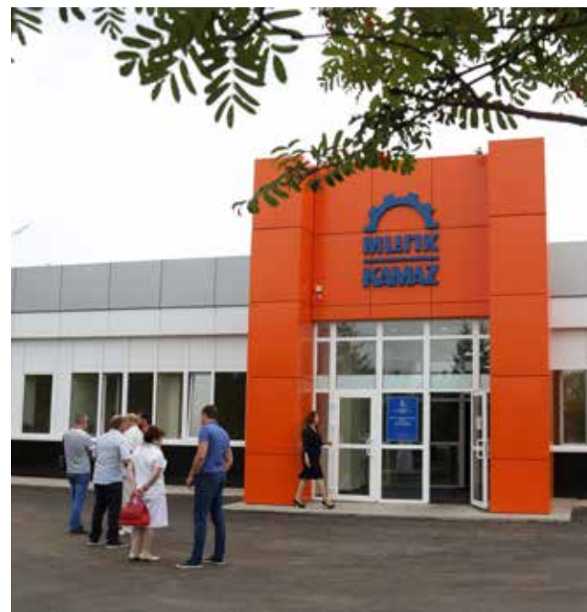
Учебный центр расположен на территории «КАМАЗа», рядом с Техколледжем им. Поташова и заводом двигателей

Также регулярно обновляем наши программы, запускаем новые, меняем старые, если в том возникла необходимость. Из того, чем хотелось бы поделиться, — планируем наладить взаи-