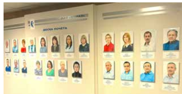
25 лучших кузнецов — на Доске почёта

Все заводчане, чьи фамилии занесены на Доску почёта, остаются примером преданности своей профессии и вносят большой личный вклад в развитие кузнечного завода и «КАМАЗа» в целом.