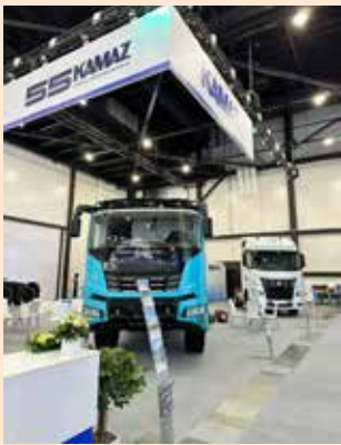
На ПМГФ «КАМАЗ» был представлен достойно

Производство автотехники в газомоторном исполнении — одно из приоритетных направлений развития для «КАМАЗа». Автогигант ведёт активную работу по расширению линейки выпускаемых газовых автомобилей и автобусов, повышению надёжности и улучшению технико-эксплуатационных характеристик газомоторной продукции.