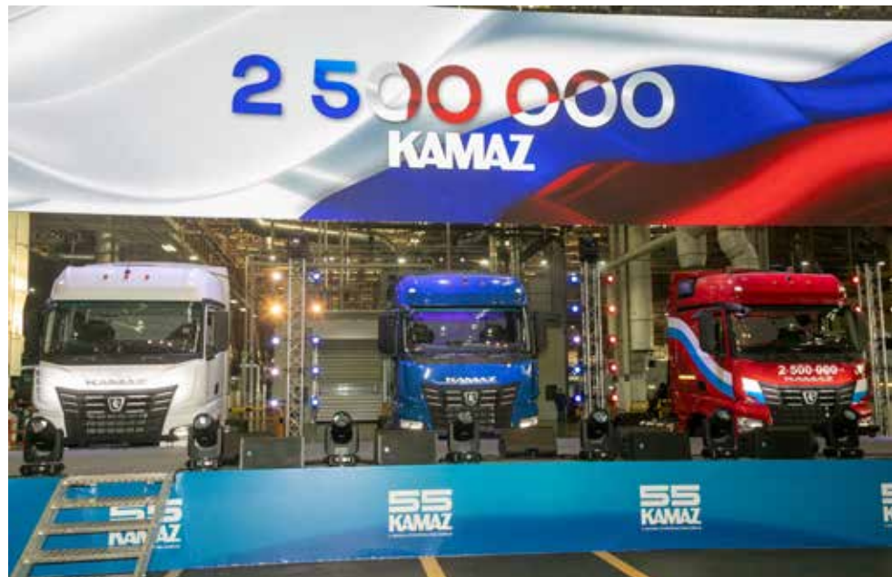
Вот они, большегрузы, олицетворяющие технологичность, мощь и интеллект «КАМАЗа»

— Ещё недавно рабочие на конвейере говорили: мы можем делать автомобили другого класса. И когда «КАМАЗ» перешёл на сборку принципиально нового большегруза, гордились, что всё получилось. Огромный труд, множество задач, которые мы решаем, позволяют нам добиться многого, — размышлял генеральный директор «КАМАЗа» Сергей Когогин. — Экономика нашей страны вряд ли смогла функционировать, не будь в разных отраслях хозяйства наших автомобилей. Сейчас наша главная задача — обеспечить обороноспособность страны. Каждый день с кон-