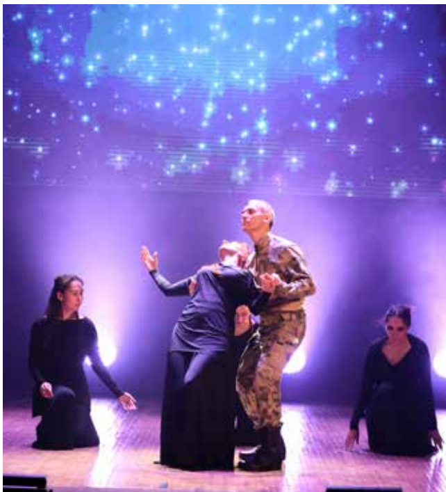
Композиция «Ты жди меня там» больно откликнулась в сердцах зрителей

В том, что прессоворамщики «ваще крутые», никто не сомневается, их хорошо знают не только на «КАМАЗе», но и в