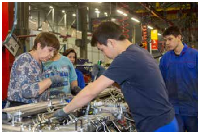
За каждым новичком присмотрит более опытный работник

— Сейчас благодаря проекту «Развитие системы наставничества» идёт плотная многосторонняя работа. Специалисты из МЦПК, Корпоративного университета, руководители и начальники цехов всех