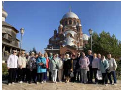
Спасибо «КАМАЗу» за путешествие!

Впечатлил ветеранов и уникальный современный музей. Они с удовольствием поглядели на археологические экспонаты и отдали должное масштабу работ по раскопу