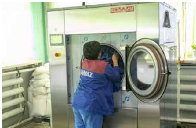
В новое оборудование можно загрузить 50 кг спецодежды

А ещё с обновлениями исключили необходимость использования центрифуги. Ведь отжимом теперь тоже занимается стиральная машина — после завершения цикла работнику прачечной только и остаётся, что отправить чистое бельё в «сушилку».