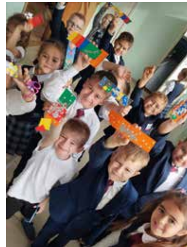
На Дне «КАМАЗа» каждый школьник получил небольшой сувенир

Время пролетело незаметно, а главное, что у каждого класса было своё знакомство с «КАМАЗом». В этот день сувениры с символикой автогиганта получили не только победители соревнований, но и все ученики. А ещё на память у них останутся фотографии с грузовиком, сделанные во дворе школы.