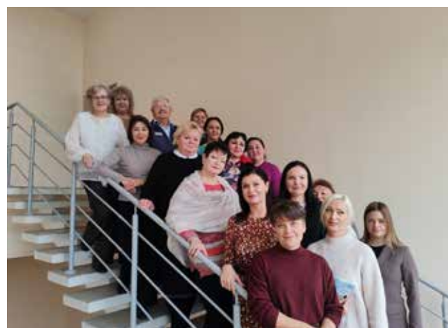
На память о встрече останется фото с автором книг (на переднем плане)

Встреча закончилась автограф-сессией, но теперь напоминать о ней будут ранее выпущенные книги «Конечная остановка» и «Тариф на связь», а также