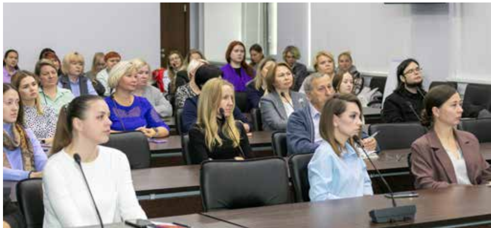
Аудитория внимательно слушала советы и самое важное записывала в блокноты

Собравшимся также представилась возможность анонимно сдать экспресс-тест сразу после лекции. Капельку крови из пипетки врачи наносили на тестер. Одна проявившаяся полоса означала, что в организме нет инфекции, две — нужно сдать анализ на более глубокое исследование уже в СПИД-центре. Прошедшим тест врачи дарили буклеты, в которых рассказывалось, где и как можно заразиться ВИЧ, и что нужно делать, чтобы избежать этого.