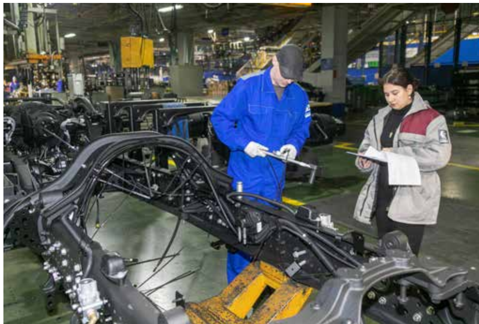
От затяжки каждого болта зависит качество всего автомобиля