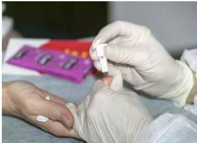
Экспресс-анализ крови покажет, есть ли в организме инфекция

Узнать свой ВИЧ-статус можно только по анализу. Причём, заметила врач, при трудоустройстве каждый сдаёт кровь, но она не проверяется на наличие этого вируса. По закону такой анализ проходят только медицинские работники. Но любой россиянин имеет право бесплатно и анонимно сдать кровь в поликлинике по месту жительства, здесь же можно получить справку об отсутствии инфекции.