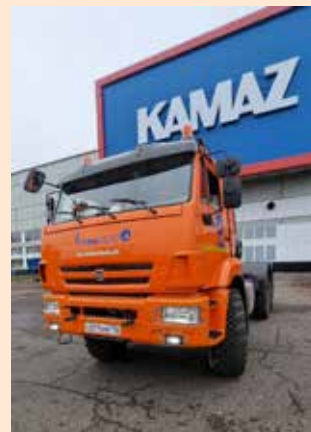
С новыми автомобилями вырастет эффективность перевозок

Руководство рассчитывает на повышение эффективности эксплуатации парка за счёт снижения простоев на ремонт и затрат на запчасти и материалы.