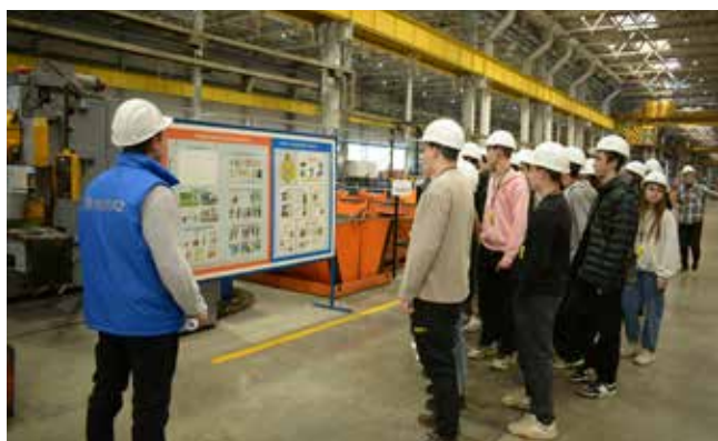
Студенты увидели, как организовано производство на «НЕФАЗе»