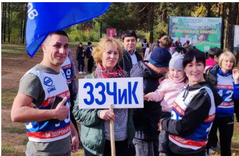
На соревнования приходят и с детьми, пусть привыкают

Что тут скажешь — пример такой активной и энергичной мамы определённо заразителен!