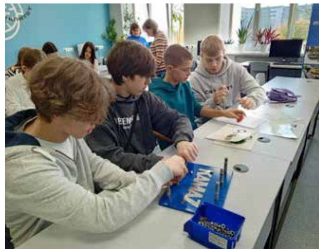
Ребята быстро справлялись с закручиванием гаек

Школьники, покидая политехнический колледж, обсуждали День «КАМАЗа», делились со своими одноклассниками впечатлениями и разговаривали об инструментах и профессиях, которыми в будущем, возможно, они обучатся.