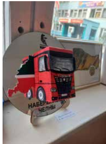
Ребята состязались в креативности: на конкурс ученик 4 «Б» Дима Назин сделал объёмную модель КАМАЗа-54901 с флагом Татарстана

Новинками стали разные мастер-классы. Ведущий специалист ОРП КЗ Ульяна Старовойтова и младшеклассники из заготовок для аппликаций мастерили закладки для книг. Технологи Ирина Яшина и Эдуард Рылов вместе с восьмиклассниками самостоя-