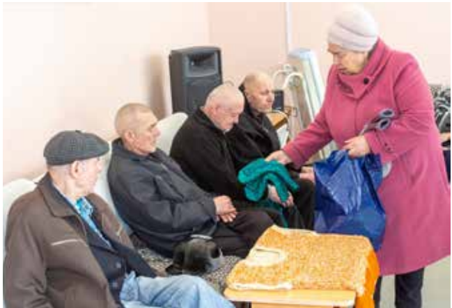
Своим теплом ветераны щедро делятся с теми, кто в этом нуждается

Оказывать гуманитарную помощь особо нуждающимся пенсионерам помогает тесное сотрудничество с профкомами подразделений и Фондом благотворительной и социальной помощи компании. Не забыта и работа по организации досуга пенсионеров. Популярностью пользуется литературно-музыкальный