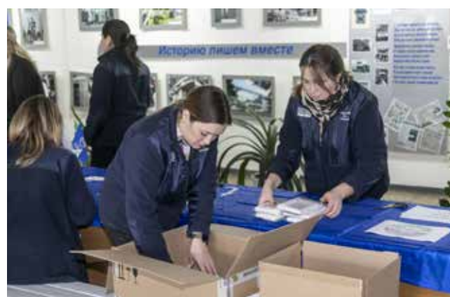
Стопки комплектов аккуратно укладываются в коробки

Меньше часа мамам с ПРЗ понадобилось, чтобы изготовить 150 комплектов сухого душа, а всего собрано 15 коробок с гуманитарной помощью. Посылки пла-