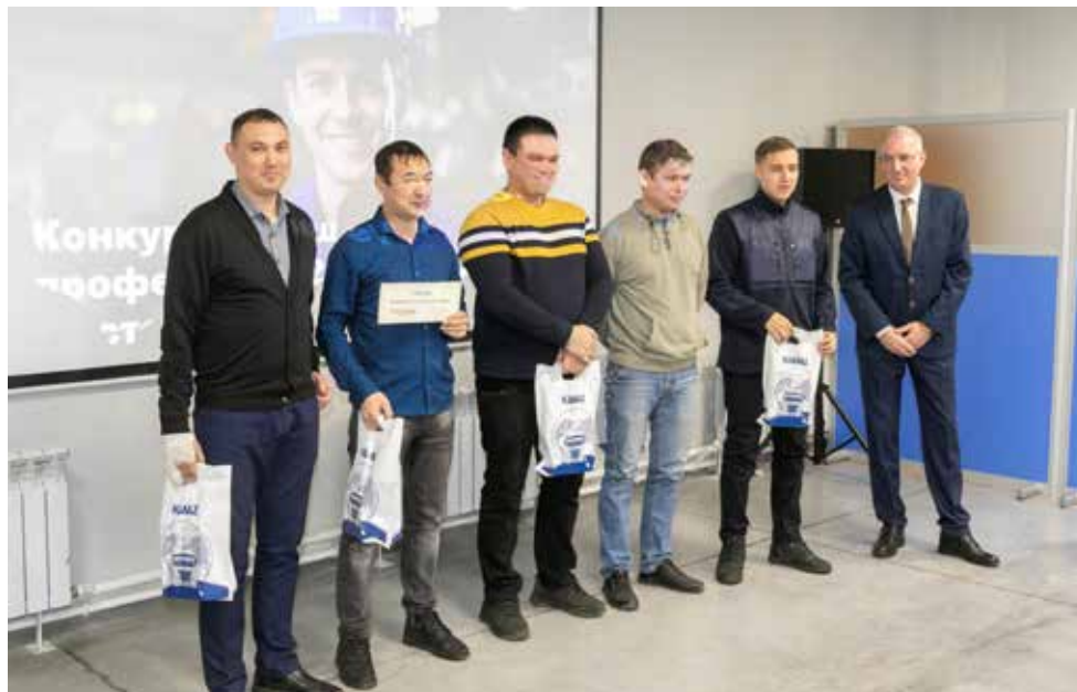
Мастера кузнечного завода — команда победителей

Всем призёрам были вручены призовые чеки: суммы, указанные в них, будут зачислены в очередную заработную плату, а заслуженные награды, в том числе и переходящий кубок, будут вручены на традиционной конференции мастеров, которая состоится 6 декабря.