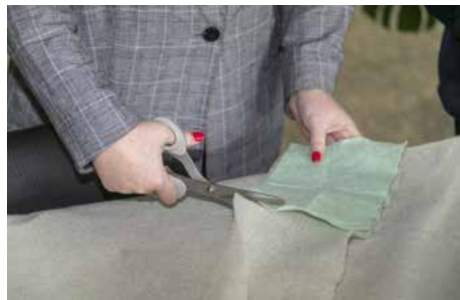
Изготовление сухого душа начинается с раскроя ткани

службу, и бойцов из других городов. А праздники ещё будут, их отмечать гораздо приятнее, когда близкие рядом.