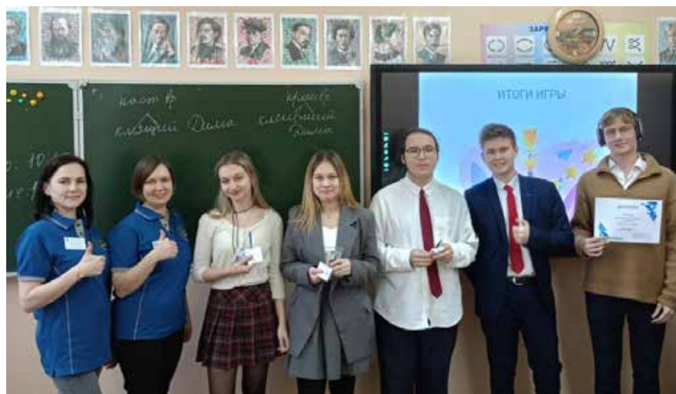
Победители викторин получили дипломы и камазовские сувениры

В это время спортивный зал гудел от радости и веселья. Ученики пятых и шестых классов прыгали, бегали, огибая конусы, словом, соревновались в эстафете. Победителей наградили дипломом и блокнотами.