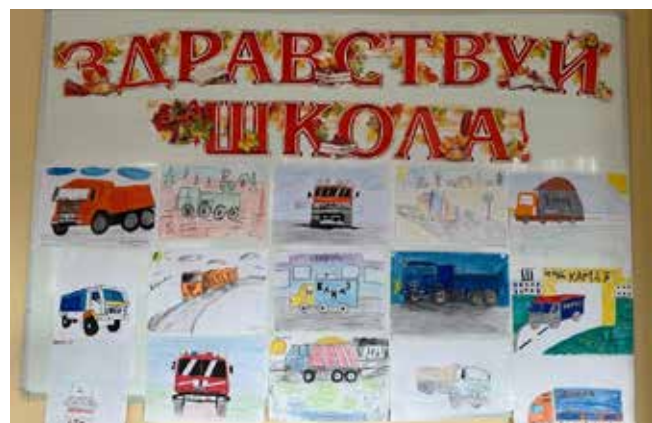
На рисунках школьники изобразили самосвалы, бортовые грузовики и спецтехнику

Время пролетело незаметно. В этот день каждый ученик получил в подарок брелоки, ручки, карандаши и магниты с эмблемой компании. А в завершение события школьники поблагодарили камазовских гостей за праздник и с хорошим настроением отправились по домам.