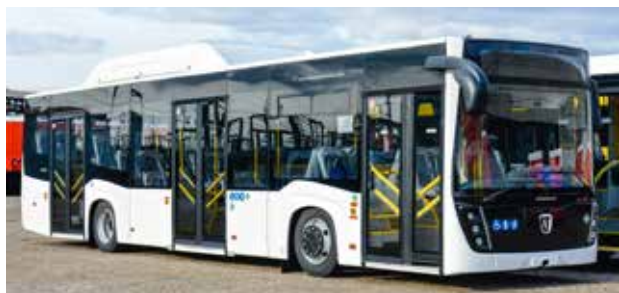
Газовый автобус НЕФАЗ-5299 — в сотне лучших товаров России