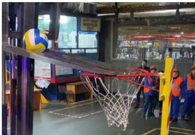
Мяч катится точно в сетку