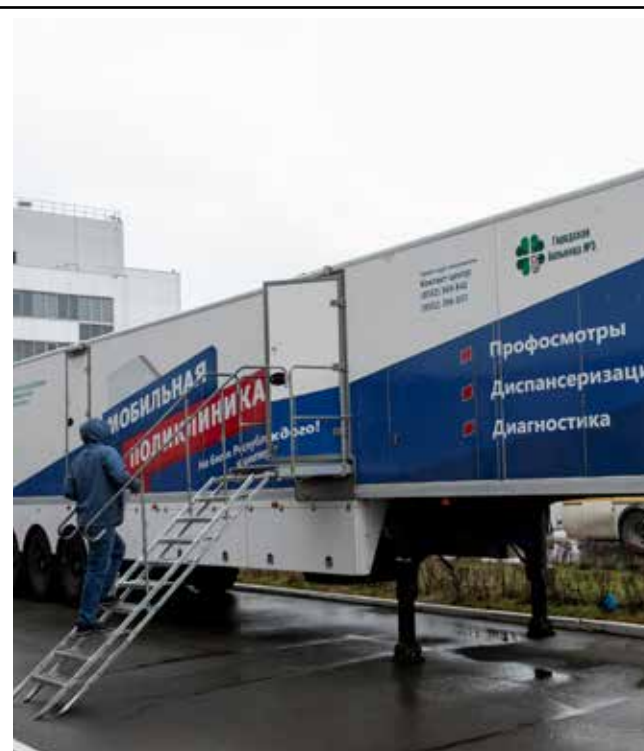
Мобильная поликлиника позволяет пройти медосмотр всего за 20-40 минут

После приёма сотрудников генеральной дирекции модуль отправится на литейный завод, а затем на РИЗ. С результатами обследования можно будет ознакомиться через две недели после прохождения диспансеризации.