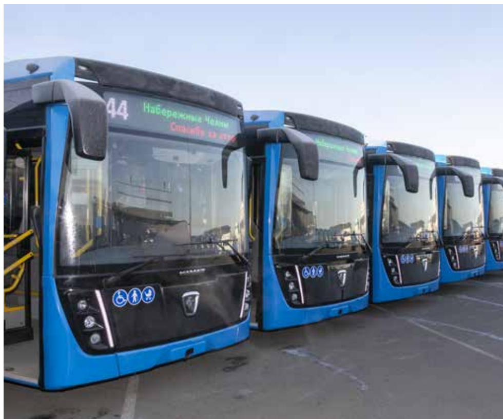
Автопарк Челнов пополнился ещё 44 автобусами камазовского производства

главной социальной задачей и любой городской администрации, и администрации региона. Мы стремимся сделать всё, чтобы наша техника не подводила, и готовы к дальнейшему сотрудничеству.