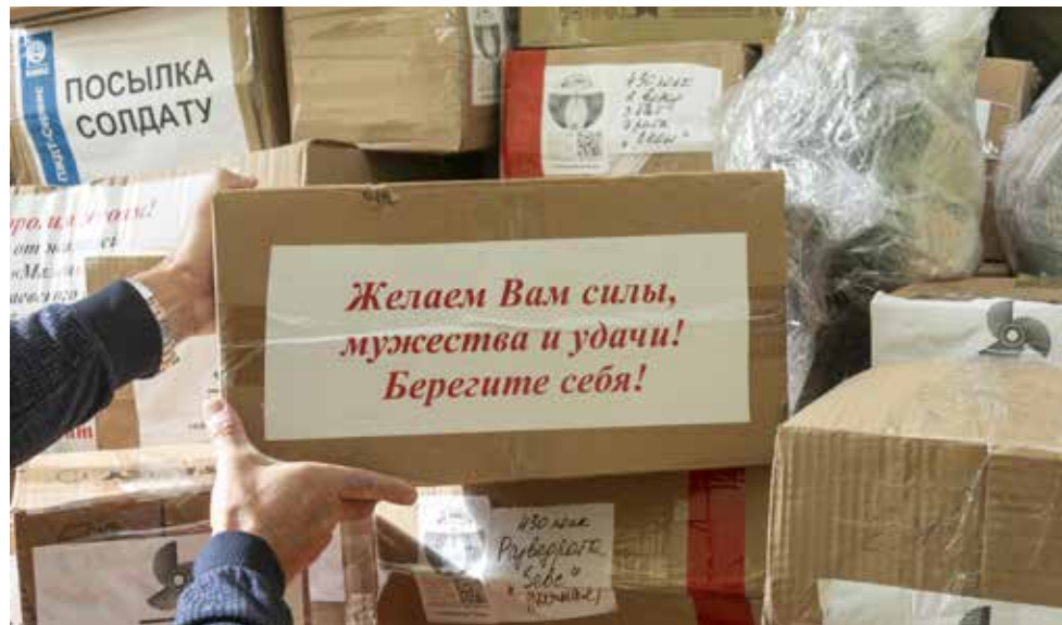
Помощь камазовцам в зоне СВО — главное направление последнего времени

бедой в фонде и тех камазовцев, которые попали в чрезвычайные ситуации. В таких случаях фонд объявляет добровольный сбор средств среди работников «КАМАЗа», из которых потом оказывается материальная помощь пострадавшим.