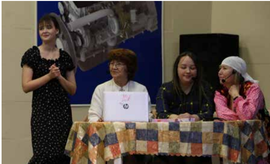
Постановка о трёх поколениях женщин нашла особый отклик в сердцах зрителей