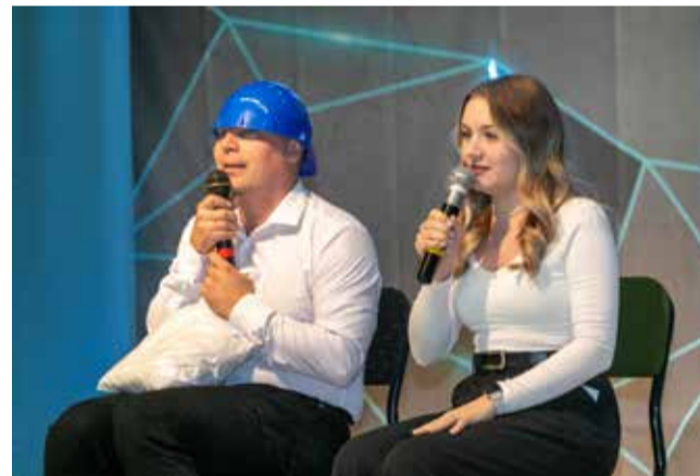
«Нелогичные» уверены: когда за руль садится новичок, лучше принять все меры предосторожности