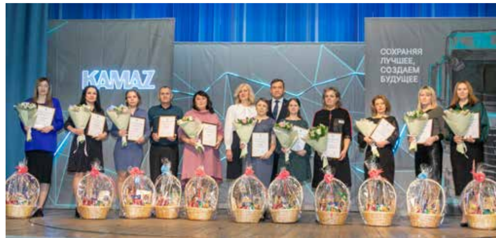
Заслуженная награда — лучший подарок к празднику

По традиции на празднике был особо отмечен мно-