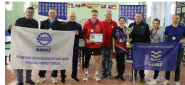
Спорсмены ПРЗ — сильнейшие теннисисты на «КАМАЗе» в 2024 году

По итогам состязания первое место заняла команда прессово-рамного завода. На второй позиции разместились спортсмены завода двигателей. Тройку призёров замкнули кузнечы.