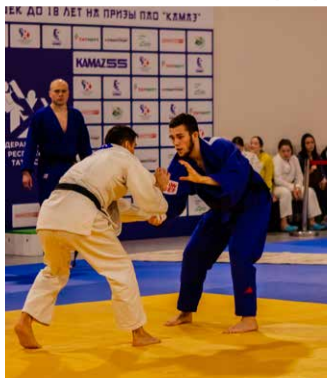
Дзюдоисты продемонстрировали зрелищные поединки, в которых было много борьбы

Подготовил Кирилл Свиридов.