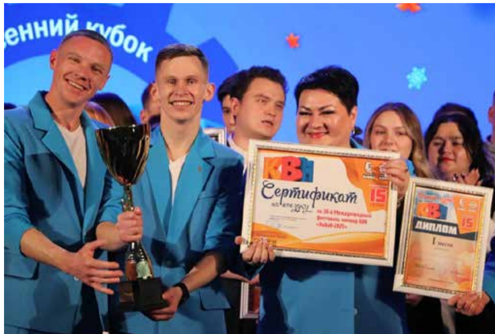
Победа на осеннем Кубке КВН стала шестой для команды АвЗ за 15 сезонов

По итогу игры третье место поделили «Нелогичные», «Далай рама» и «ЗДвиг». Второе — у команды «Мы из Центра». На первом месте также оказались два коллектива — «Мои красавицы» и «Полный привод». Автозаводчане попадали в призы в виде места на весеннем и летнем Кубках 2024 года, поэтому команда в следующем году представит «КАМАЗ» на фестивале «КиВиН» в Сочи.