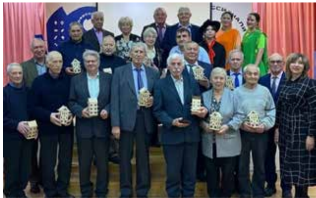
Гости праздника помнят ещё первые двигатели

Первопроходцы от души поблагодарили студентов за подарки. Они были искренне тронуты вниманием молодёжи. В завершение гости праздника сделали общую фотографию на память.