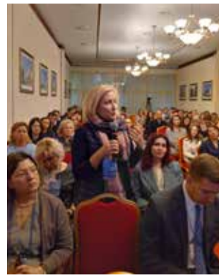
Обсуждение тем активно велось и на пленарном заседании

Координировала работу секций, помогала участ-