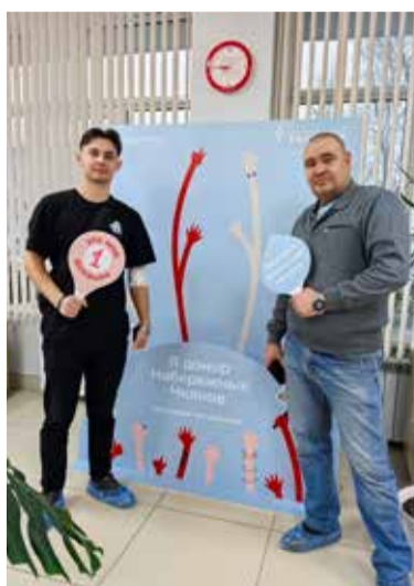
20,5 литра крови — итог завершающей год акции

— С каждым разом всё больше камазовцев хотят стать донорами, и это очень здорово! Благодаря их добрым и отзывчивым сердцам за 2024 год мы сдали почти 94 литра крови, — подчёркивает Ксения и с уверенностью говорит: — В следующем году мы обязательно продолжим это доброе дело.