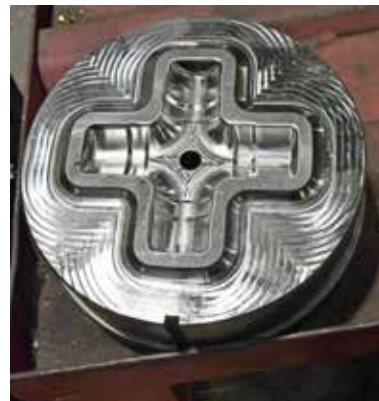
Момент обработки и готовая оснастка