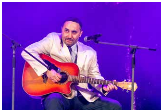
Песня «Человек, не любивший меня» заставила поразмышлять каждого

ющийся образ. «Какая красота», — слышалось из зала.