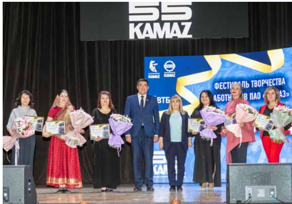
Худруки заводов и подразделений получили не только благодарности за свой труд, но и аплодисменты зала

Особый шарм концерту придавало погружение в другую культуру: литейщицы продемонстрировали вокально-хореографический номер «Жизнь — это кабаре», а дизелисты вновь порадовали индийским танцем и соответствующими нарядами. Публика восторженно встречала каждый яркий, элегантный или запомина-