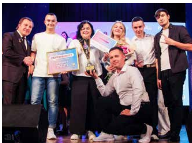
«Нелогичные» — чемпионы юбилейного X сезона Лиги работающей молодёжи Челнов

— Это профком. Держись от них подальше, — посоветовал камазовец и спросил: — Ты умеешь петь или танцевать?