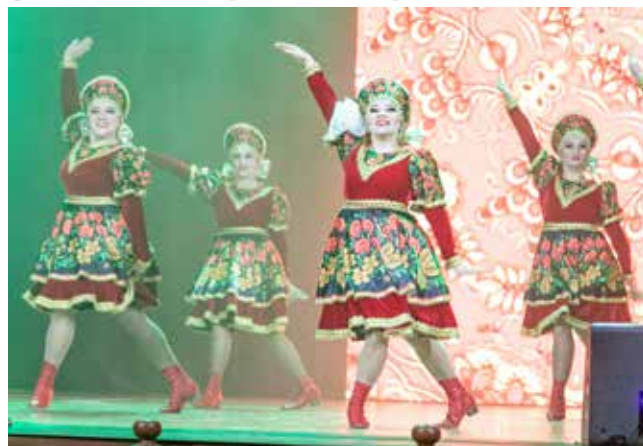
Задорные литейщицы немного похулиганили на сцене

Фестиваль завершился на мажорной ноте. На сцену вышли все камазовские артисты и спели песню «Вперёд, Россия», а зрители поднялись со своих мест и горячо аплодировали не только этому номеру, но и всем выступавшим в этот вечер.