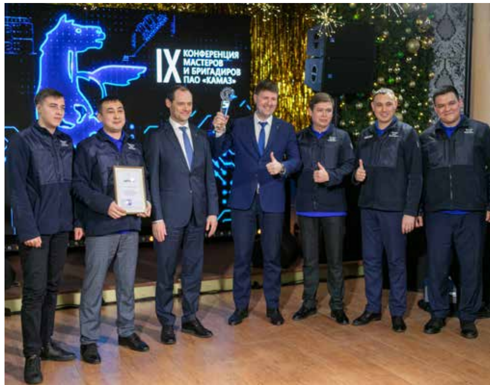
Кубок «КАМАЗа» снова у команды кузнечного завода

В праздничную атмосферу участников конференции вернули кадры хроники сборки 2,5-миллионного автомобиля, сошедшего с конвейера в сентябре. Каждый работник автогиганта вложил в него частичку своей души, а мастера — те самые люди, которые закручивают шестерёнки большого камазовского механизма. Сначала