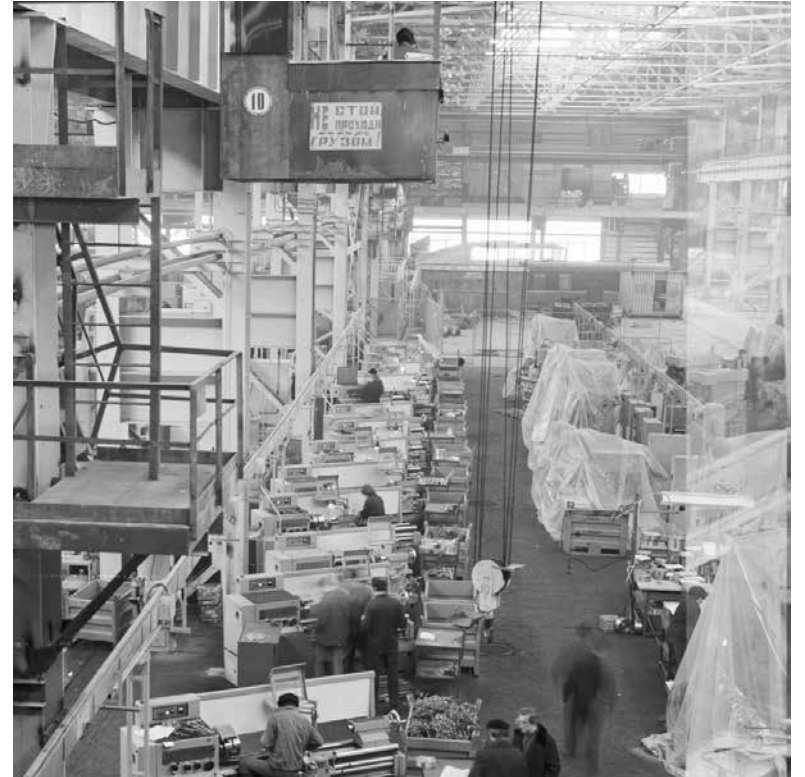
К декабрю 1974 года в ШМЦ уже было смонтировано 72 единицы технологического оборудования

И на этапе контроля произошли изменения: качество крупногабаритной штамповой оснастки контролируется с помощью координатно-измерительной машины, то есть компьютера, обрабатывая все замеры, выдаёт результат с просчитанными отклонениями. А это всегда оперативно и точно.