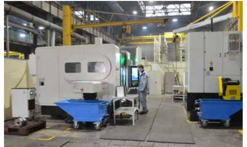
Обновлённый новейшими обрабатывающими центрами участок изготовления штампов «круглые в плане». Идёт процесс обработки крестовины