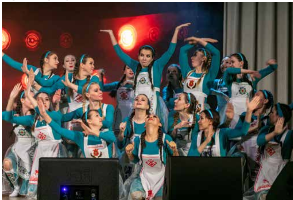
Номер «В ритме родной земли», взявший «серебро» на фестивале «Новое время — Безнен заман», восхитил и камазовскую публику