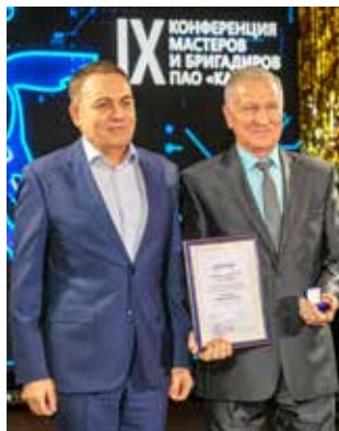
Звание «Почётный мастер КАМАЗа» присваивается самым опытным руководителям

мены в мире технического прогресса, но без мастера их не осуществить.