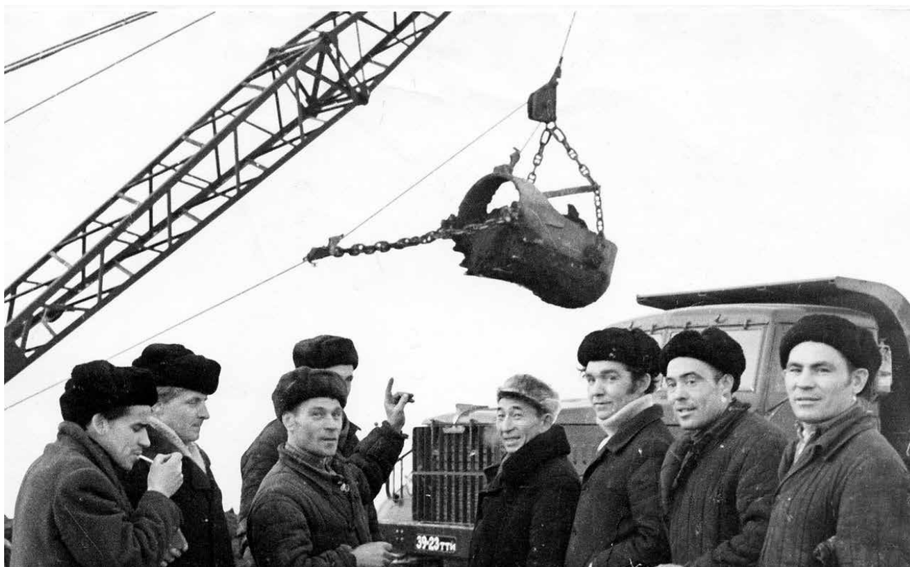
13 декабря 1969 года. Вынут первый ковш на стройплощадке автогиганта

Виктор Бурасов, с 2012 года возглавлявший центр закупок и более 40 лет посвятивший автогиганту, ушёл на заслуженный отдых.