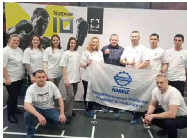
Ударная десятка «КАМАЗа» 2024 года

лась. Рефери помог потуже затянуть её фиксаторы на запястье, — рассказывает Пахомов. — Было тяжело пробить грушу. Но все участники соревнования