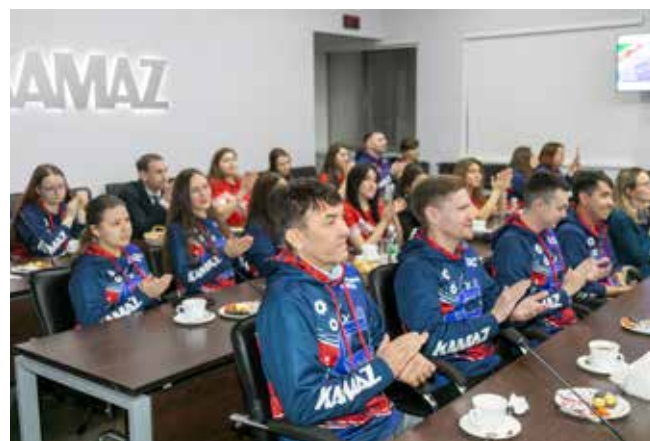
У камазовских артистов было много предложений по репетициям и выступлениям