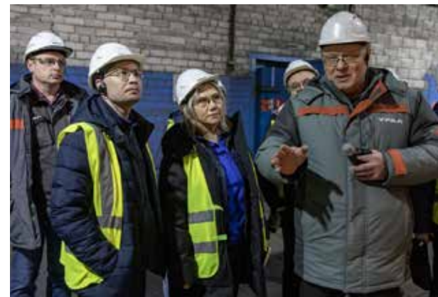
Опыт «Урала» камазовцам пригодится

Стороны договорились сотрудничать, обмениваться опытом. Ответный визит представителей миасского завода на «КАМАЗ» намечен на 2025 год.