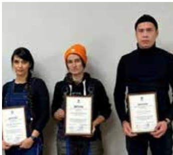
Тройка лучших водителей «Газели»