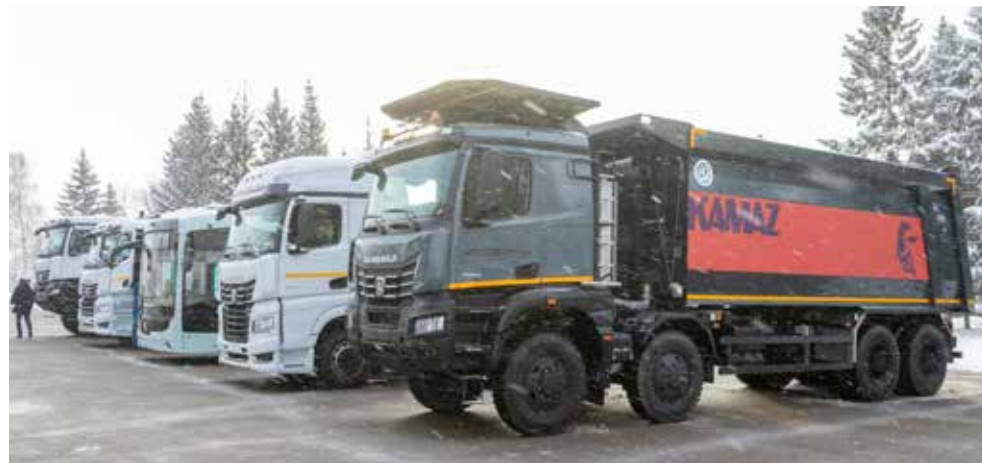
Новейшие образцы камазовской техники — прекрасное украшение праздника

К слову, о единении — поздравили автогигант с красивой датой и стипендиаты благотворительного фонда «Новые имена», которому «КАМАЗ» много лет оказывает поддержку.