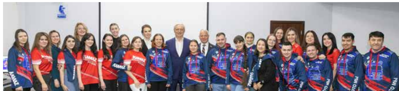
В конце участники встречи сделали общую фотографию на память