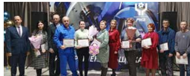
Празднование Дня инструментальщика на «Маяке» — традиция РИЗа