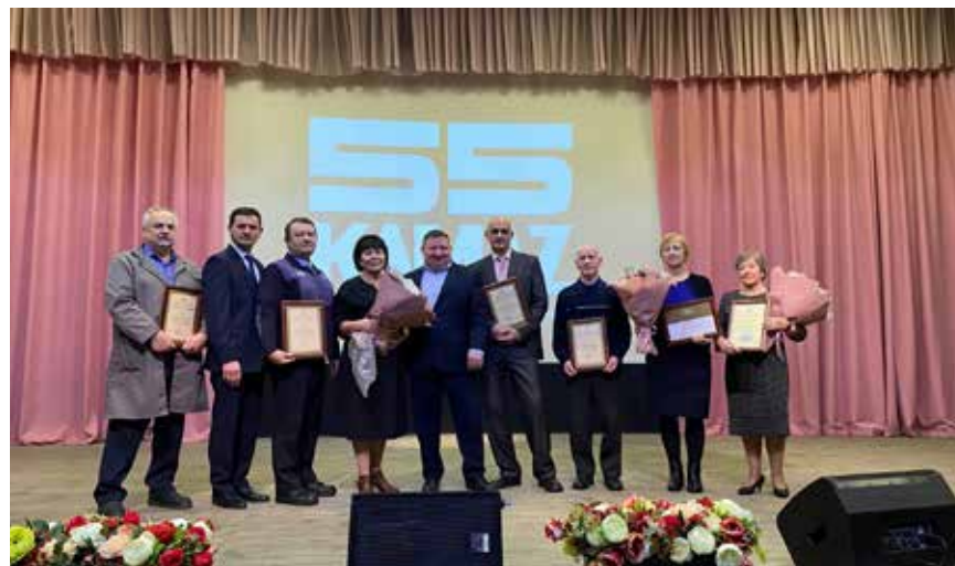
Лучшие заводчане отмечены наградами

На такой высокой ноте и завершился праздник, оставив яркие впечатления у всех участников и гостей.