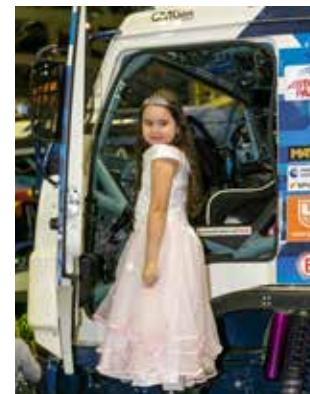
Новогоднее фото у кабины настоящего гоночного болида

Дети сотрудников команды подготовили спектакль по мотивам пьесы «Смех и слёзы» Михалкова. Мальчик Андрюша заболел перед шахматным турниром. Ночью ему приснился сон, в котором он попал в страну во главе с шахматным королём Унылио VII. Его наследник Чихальё очень болен, а фавориты самодержца, коварные карты Пиковый валет и Крестовая дама плели интриги, чтобы захватить трон. По настоянию злодеев наследнику всё время читали страшилки. Этот метод якобы мог вылечить принца. С этим не согласился Андрюша: наследник здоров, просто ему нужен смех, а не слёзы. Герой провёл весёлую зарядку под бодрую