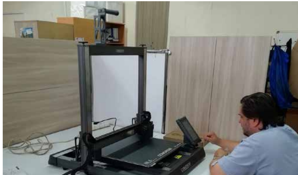
С помощью 3D-принтера необходимую для производства деталь можно изготовить с нуля за несколько дней