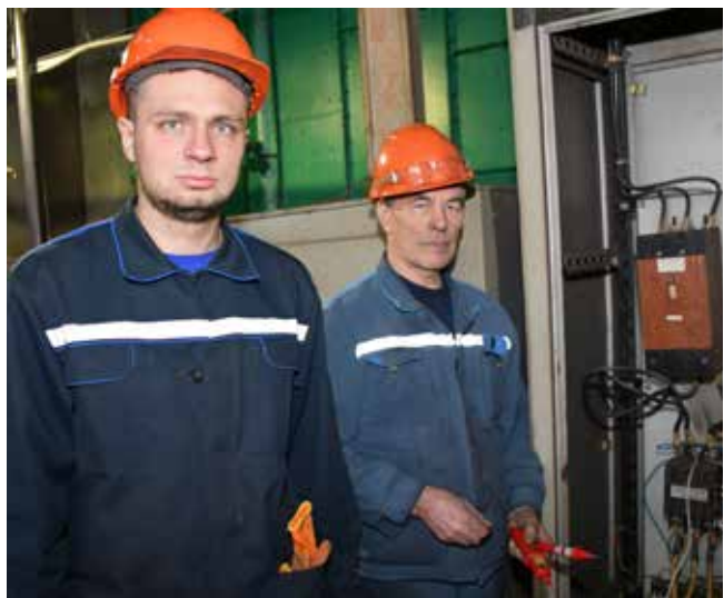
Наставник и ученик уверены, что только знания помогут в покорении электроэнергетики