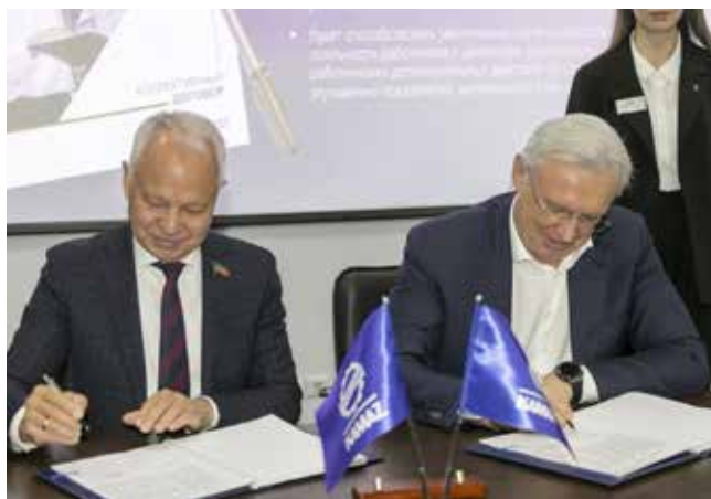
Колдоговор на 2025–2027 годы подписан