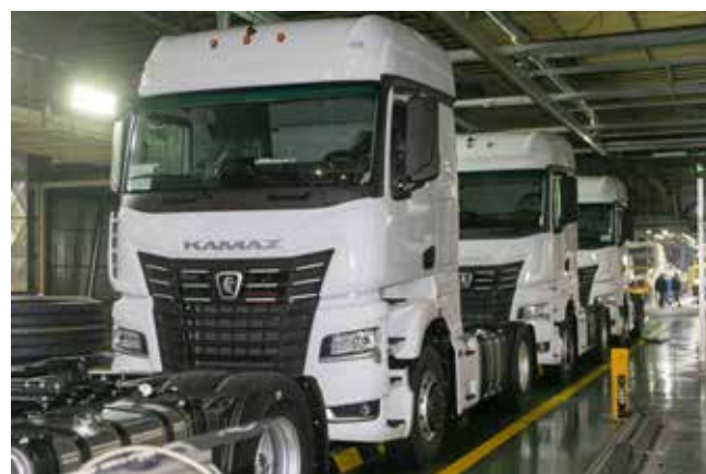
Конвейер под завязку заполнен белобоками красавцами. Скоро каждый из них обретёт своего хозяина

заменены коробка передач, раздаточная коробка, пневматическая аппаратура. Большую плавность хода и устойчивость обеспечит пятилистовая рессора на передней подвеске. Для повышения надёжности и грузоподъёмности была