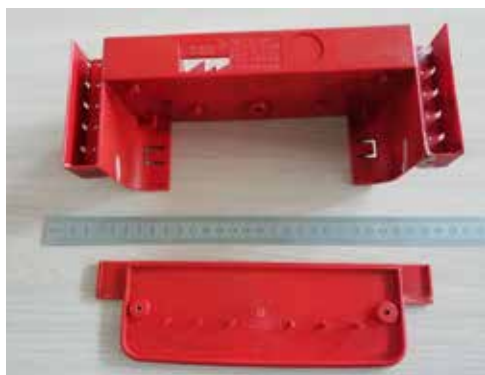
Готовые детали выполнены с филигранной точностью

Ещё один несомненный плюс использования 3D-принтеров — возможность отказаться от хранения больших запасов деталей. Ведь необходимую запчасть можно попросту создать в любой момент! Главное — разработать на компьютере 3D-модель и иметь необходимые материалы для печати. А всё остальное сделает машина: быстро и недорого.