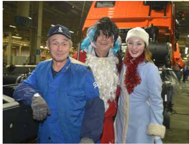
Загадывай желание скорей...

— Год был успешный, плодотворный, — подводит итог