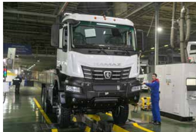
Новый седельный тягач 65955 — самый высокий в поколении K5

В антисанкционном исполнении у трёхосного седельного тягача 65955 более мощный двигатель в 560 л.с., есть комплектации как с электрогидроусилителем руля, так и с двухконтурным ГУРом. Были также