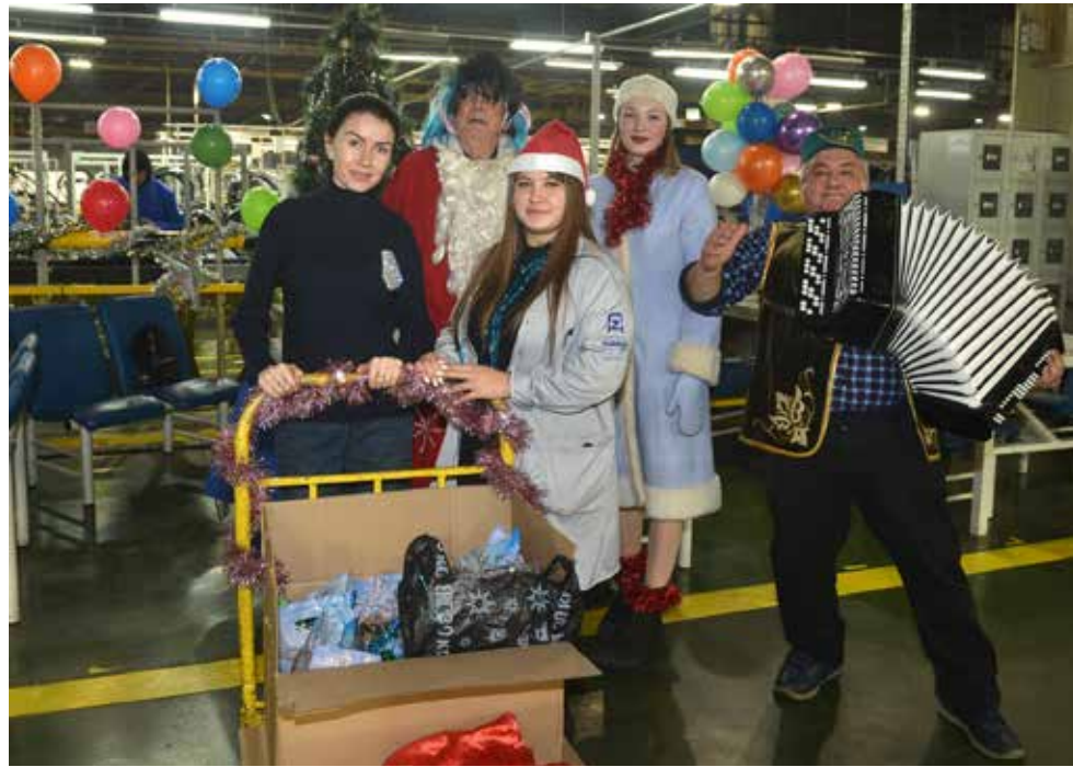
А мы к вам с подарками!

В целом же участники конкурса постарались на славу: чего только не использовали! Снеговиков «лепили» из глины, бумаги, шерсти, пластика, ткани, носков, воздушных шаров, металлических банок, жгутов, пенопласта... И с размахом создатели поиграли — какие-то работы занимали целый угол, а какие-то можно было рассмотреть только через лупу. А уж чем только не занимаются творения заводчан! Снеговички украшали ёлки, играли в снежки, мели снег, дружили со змеями и катались на санках (а один и вовсе, забравшись в сапожок, мечтательно воображал себя водителем КАМАЗа)... Одним словом, креативность дизелистов зашкаливала!