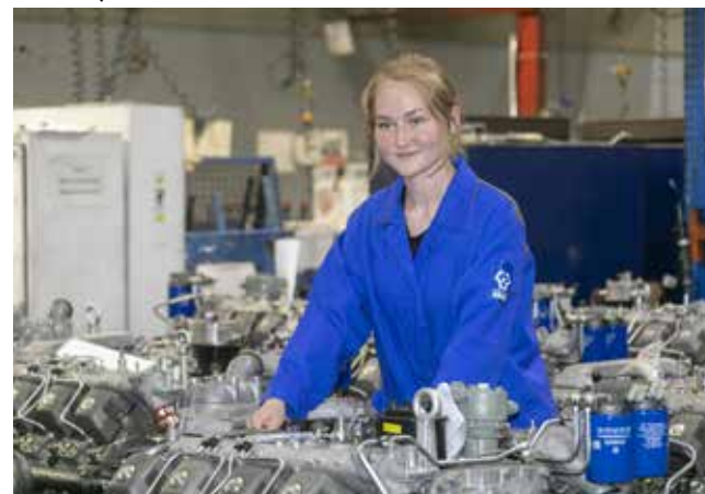
Этим летом попробовать свои силы на производстве смогли студенты из 11 регионов страны

Вот это поворот, а? Россияне его, к слову, без внимания не оставили — на момент написания этого материала в карточке товара уже больше 200 вопросов, и шуточных, и серьёзных... Равнодушным не остался никто!