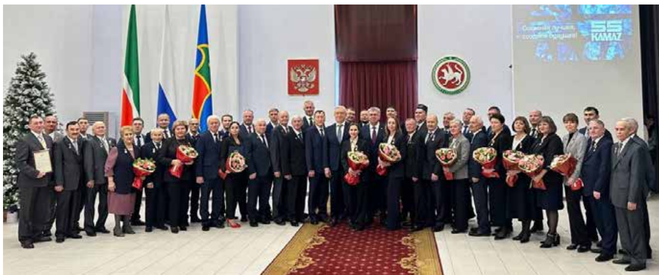
Эти люди — золотой фонд «КАМАЗа»