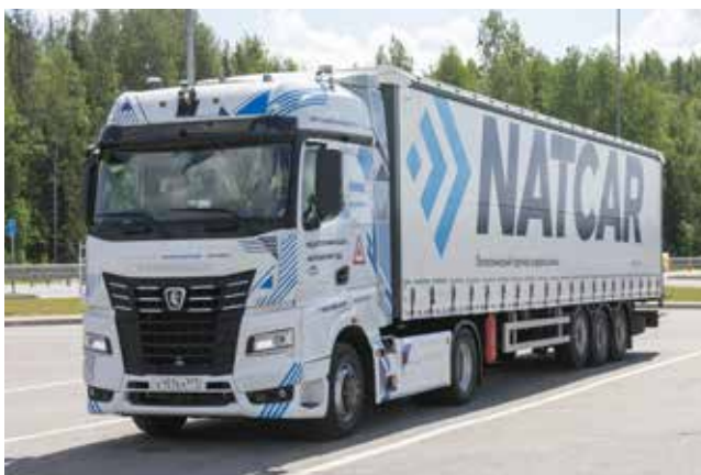
Тягач под управлением ИИ везёт на ПМЭФ особо ценный груз — гендиректора «КАМАЗа»