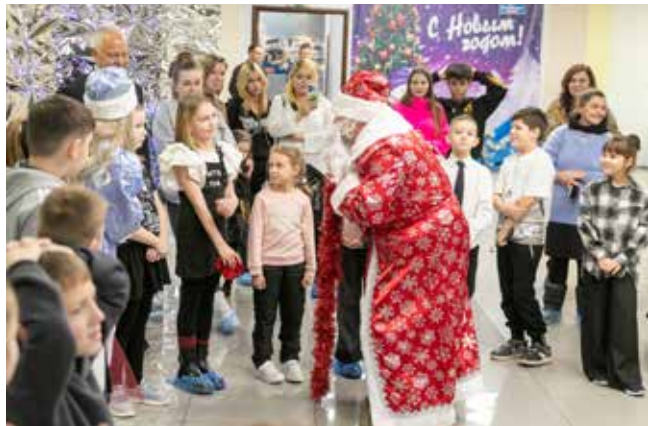
Досталась волшебная рукавичка? Рассказывай стишок

Гостей праздника в этот день ждала насыщенная программа. Ребятишки посетили музей «КАМАЗ-мастера», а в