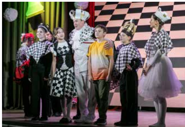
Юному зрителю запомнились яркие образы героев спектакля

Набравшись впечатлений и пополнив свой личный альбом фотографиями, гости направились в зал «Мираж», где продолжился праздник.